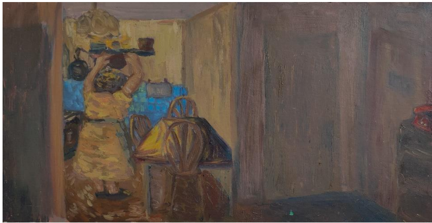
Brajković, L_ Sjećanja_#2 Teta Marta, 28 x 50cm, ulje na medijapan ploči, 2024