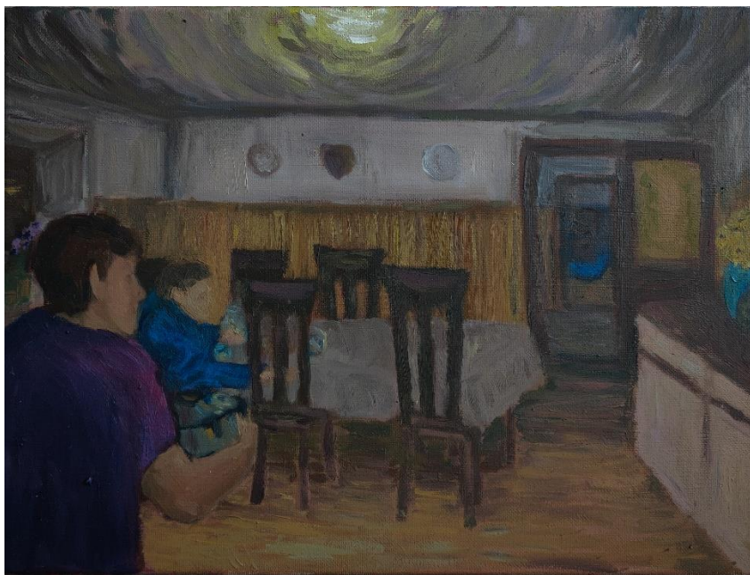
Brajković, L_ Sjećanja_#3 Poli none i noneta, 30 x 40 cm, ulje na medijapan ploči, 2024.