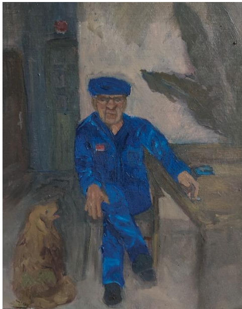
Brajković, L_ Sjećanja_#6 Barba Nini i Bobi, 24 x 30 cm, ulje na medijapan ploči, 2024.