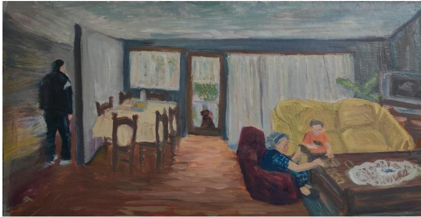
Brajković, L_ Sjećanja_#1 Opet si pobedio ,28x 50 cm, ulje na medijapan ploči, 2024.