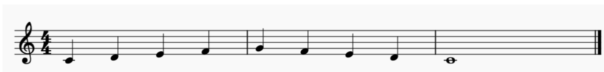
Slika 5. Primjer fraze u uzlazno-silaznoj kombinaciji