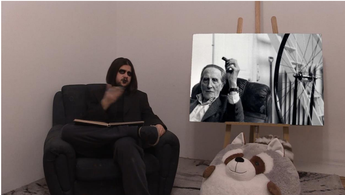
5. Scena iz videa, poglavlje Dadaizam

Nakon Prvog svjetskog rata dogodio se raspad sistema. I svaki raspad sistema je savršena prilika za novi sistem, novi red, koji će učiti na greškama svojih predaka. Moj osobni problem s dadaizmom je što kroz svoj besciljni humor slavi odustajanje. Dadaizam je kao žrtva neke traume koja ne može prijeći preko vlastite prošlosti te zapije u njoj. I dok se ostatak svijeta razvija i ide naprijed, ta žrtva zaostaje u vremenu, u najgorem dijelu svog života.