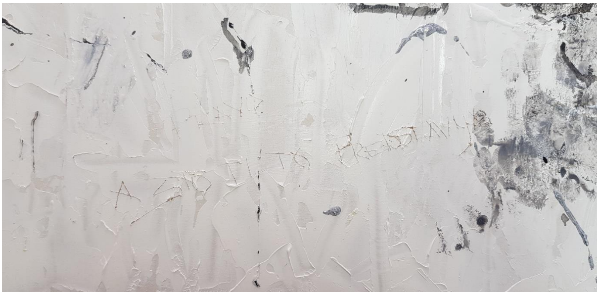
Slika 3. Detalj-„A što ti to predstavlja?“