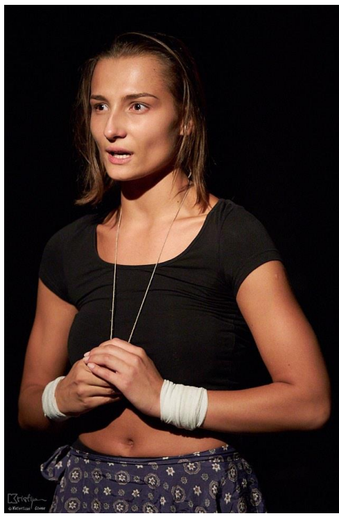
Slika 5. Samo-stimulacija u odrasloj dobi.