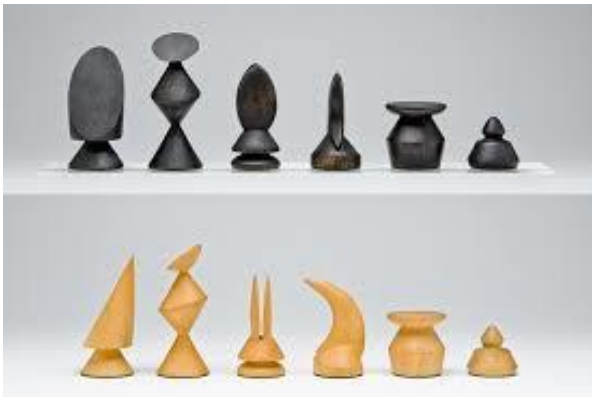
Slika 1. Dizajn šahovskih figura Maxa Ernsta

Šah nalazimo i u različitim umjetničkim praksama, od primjera motiva u tradicionalnom slikarstvu gdje motiv šaha može postati geometrijska struktura koja ponavlja poteze izvedene u šahovskoj partiji poput radova hrvatskoga umjetnika Sandra Đukića 2 , do interesa za dizajn figura poput umjetnika dvadesetog stoljeća Mana Raya, Maxa Ernsta i Marcela Duchampa. 3