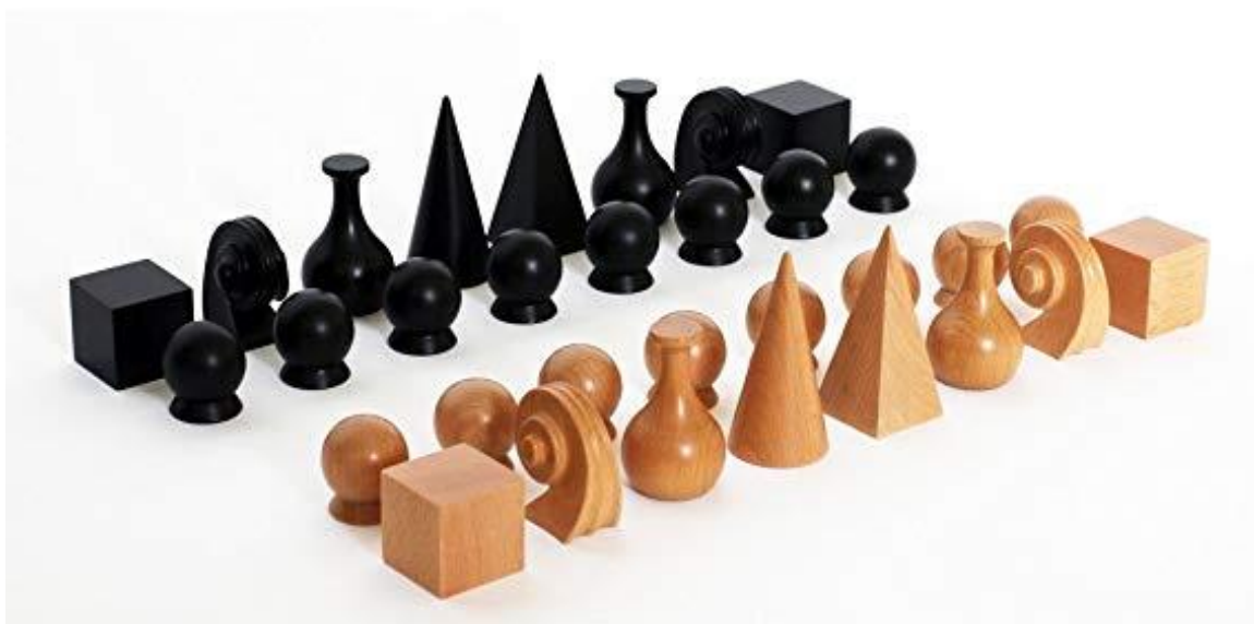
Slika 2. Dizajn šahovskih figura Mana Raya