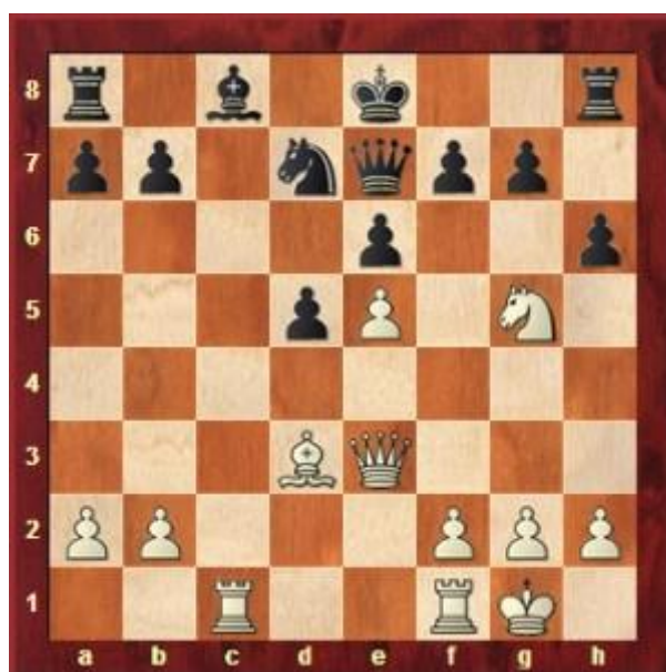
Slika 7. Primjer igre Magnusa Carlsena s 11 godina (već je tada postizao vrhunske rezultate u šahu, odigrao je remi s G. Kasparovom)

U suvremenoj pedagogiji aktivnost igre smatra se neizostavnom za potpunije ostvarenje odgojno obrazovnih ciljeva. Igram se djeci pomaže lakše razumjeti određeni nastavni sadržaj, potiče ih se na veću aktivnost i lakše uključivanje u nastavne zadatke. Igru djeca doživljavaju spontano i rado se u nju uključuju pa se i bolje motiviraju za nastavu. Učitelj neprestanim mijenjanjem sadržaja rada omogućava djeci aktivnije spoznavanje sebe i okoline.