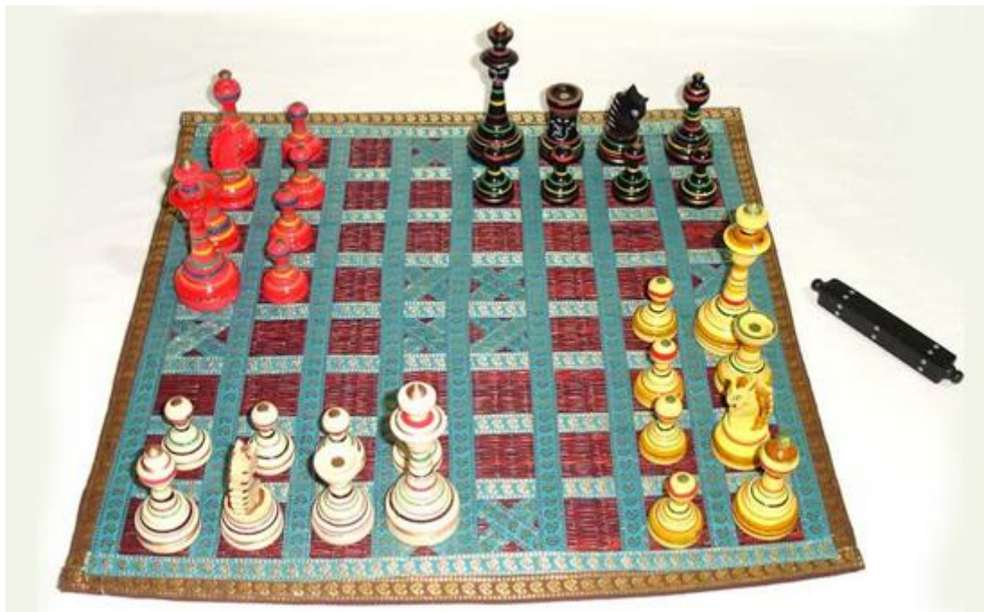
Slika 5. Chaturanga

Suronja), zarobljen od Mlečana, igrao šahovski meč u kojem mu je protivnik bio dužd Petar II. Orseolo. Dobio je sve tri partije i time zadobio slobodu, a po nekim verzijama i vlast nad dalmatinskim gradovima. Nakon toga je stavio šahovsku ploču u svoj grb.