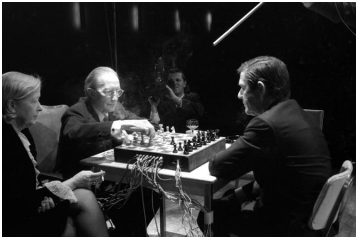
Slika 4. Fotografija s izložbe Marcela Duchampa i Johna Cagea pod nazivom “Reunion”