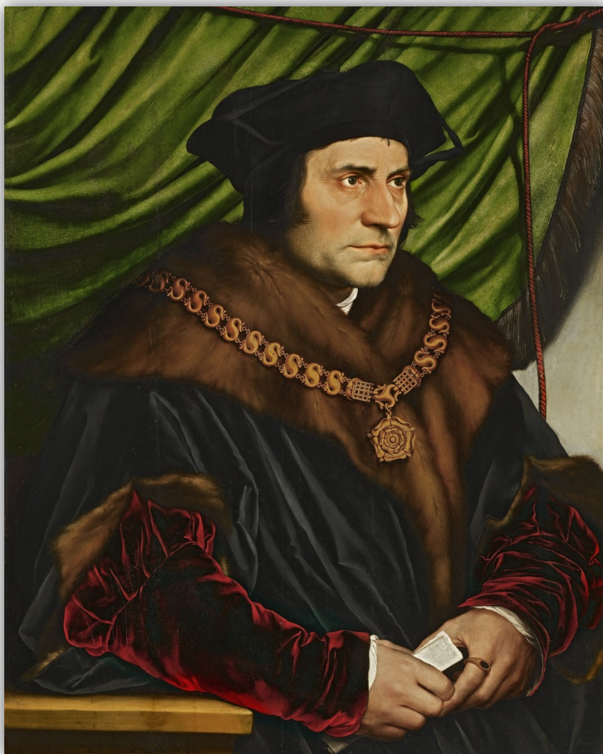
Slika 2. Hans Holbein mlađi, Portret Thomasa Morea , 1527.