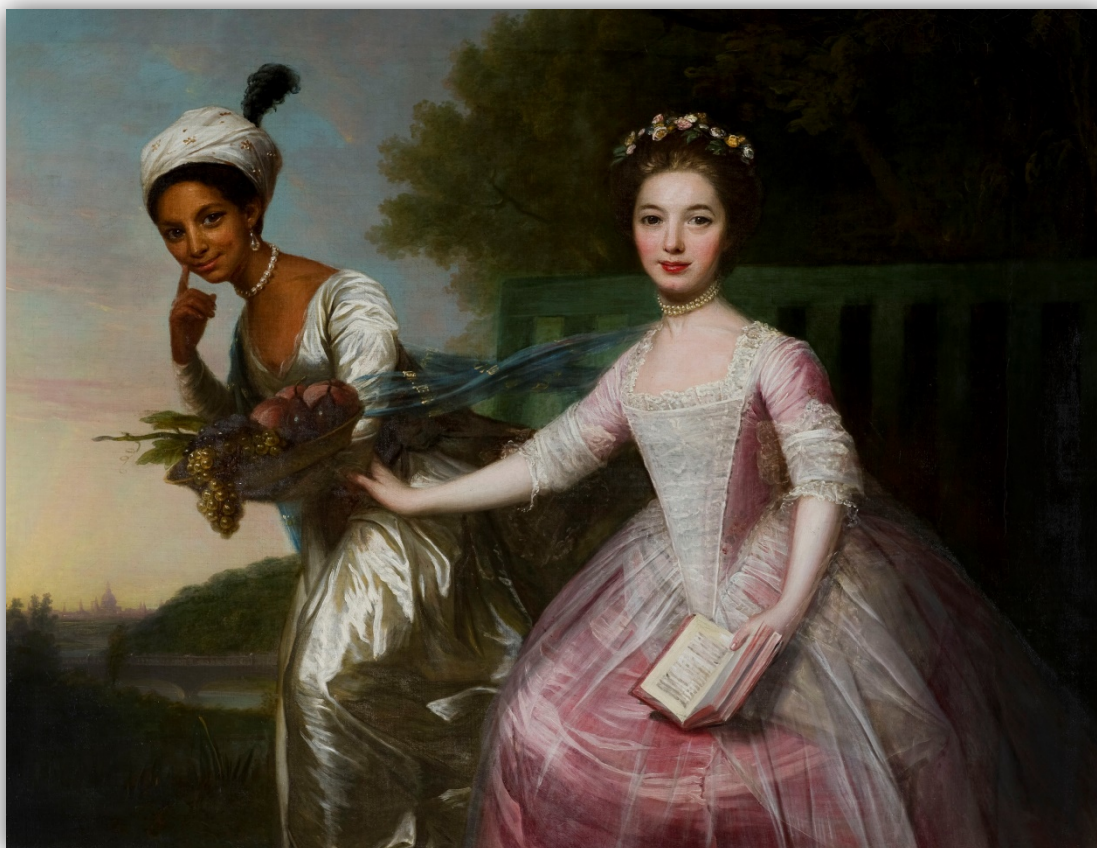
Slika 5. David Martin, Bez naziva, 18. stoljeće