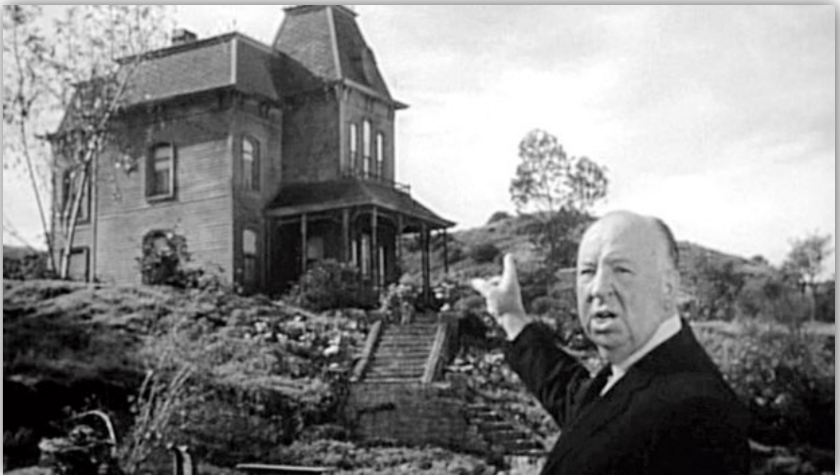
Slika 7. Alfred Hitchcock, Psiho , 1960.