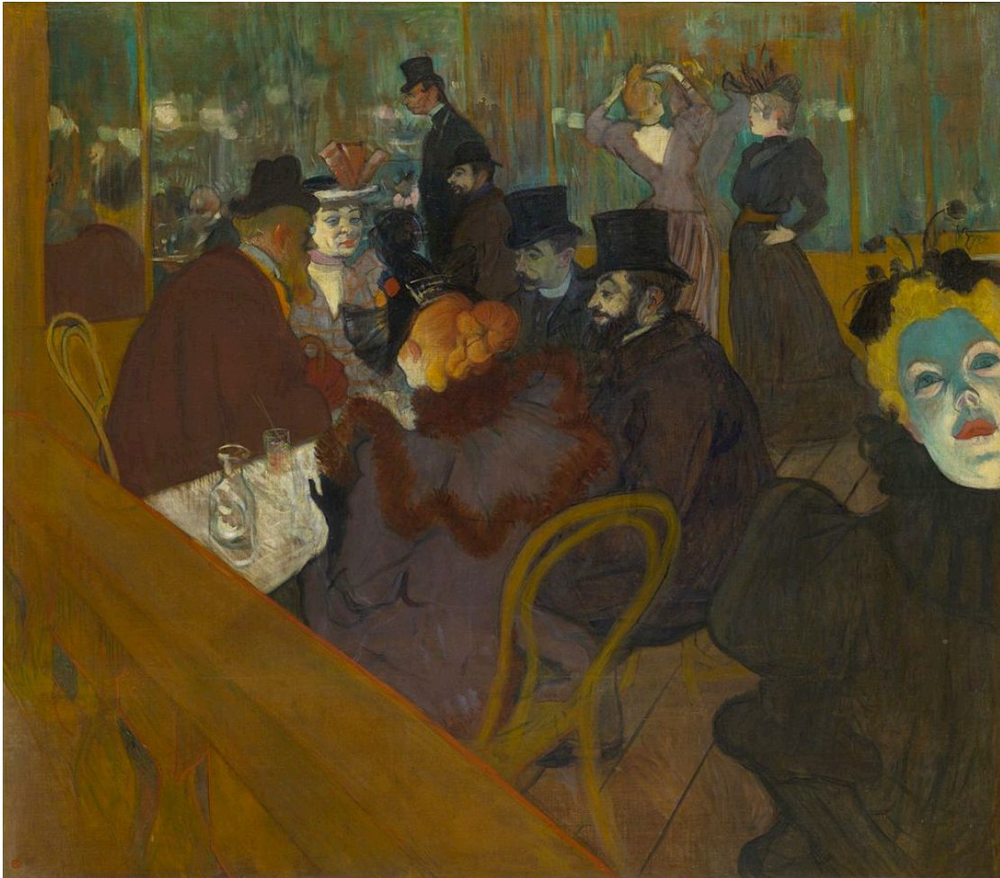
Slika 12. Henri de Toulouse-Lautrec, U Moulin Rougeu , 1892.-1895.

Skupina se sastojala od devet učenika i dvoje studenta Akademije za umjetnost i kulturu u Osijeku koji nisu sudjelovali u izvedbi reinterpretacije. Učenici su radionicu odradili u prostoru predviđenim za radionice unutar Muzeja likovne umjetnosti. Pomoću pripremljenog materijala kojem su učenici mogli pristupiti putem stranice thinglink.com ( https://www.thinglink.com/scene/1249358398806294530 ), učenici su imali trideset minuta za pripremu reinterpretacije umjetničkog djela. Obzirom kako je radnja Lautrecove slike smještena u noćne sate ugostiteljskog objekta u Parizu (vidi Sliku 12.), učenici su odlučili pristupiti temi na jednak način. Okupili su se oko stola te pomoću plastičnih čaša i boce ljepila za drvo simulirali večernje pijančevanje u noćnom baru. Učenici su preko pametnog telefona pustili glazbu koja je najbolje odgovarala zamišljenoj reinterpretaciji, uz koju su dvije učenice plesale u pozadini. Ostatak učenika je sjedio za stolom, simulirali opijanje i kartanje, dok je