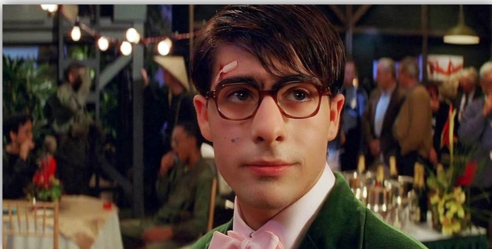
Slika 1. Rushmore , 1998.