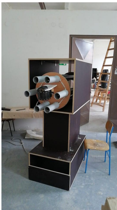
Slika 2. Skelet i top, Ivan Kopp, drvo, plastika, led svjetla, disko kugla