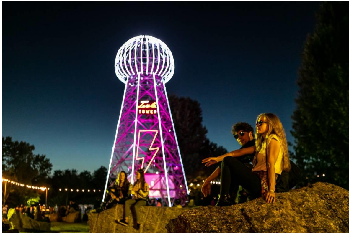
Slika 2. INmusic festival; Zagreb