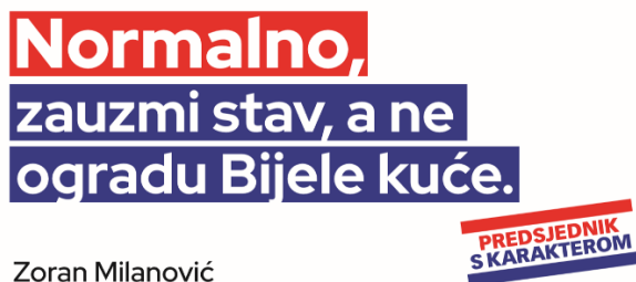
Slika 13: Predizborni plakat Zorana Milanovića

Zoran Milanović aktualni je predsjednik Republike Hrvatske koji svoju dužnost obnaša od 2019. godine.