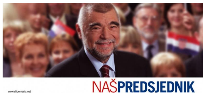
Slika 6: Predizborni plakat Stjepana Mesića iz 2005. godine (preuzeto: https://www.sinisajagodic.com/hr/ )