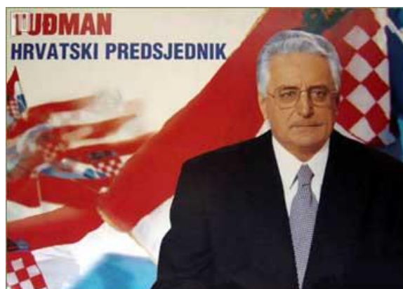
Slika 3: Predizborni plakat Franje Tuđmana iz 1997. godine