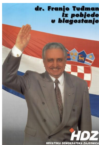
Slika 2: Predizborni plakat Franje Tuđmana iz 1992. godine