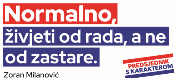
Slika 14: Predizborni plakat Zorana Milanovića