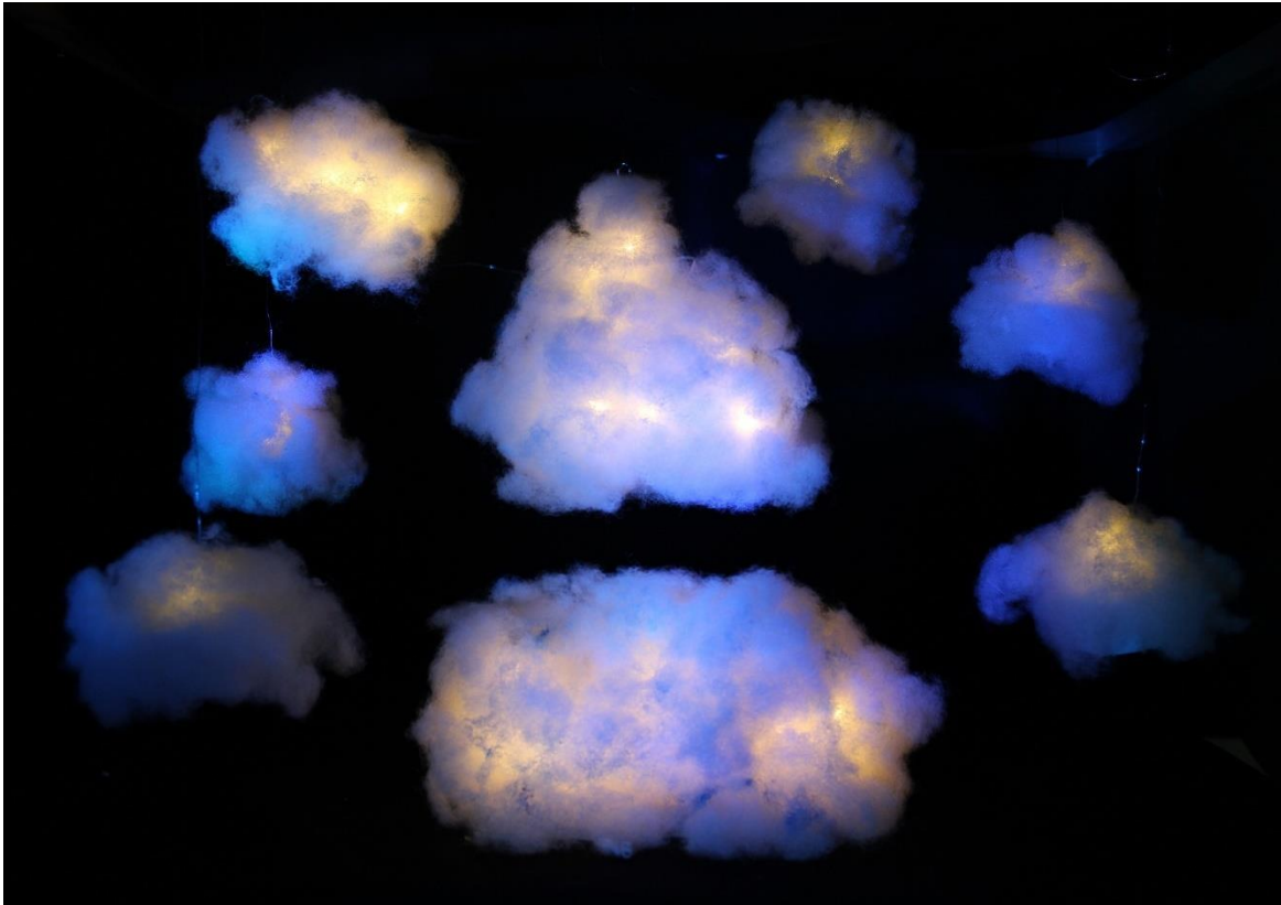
Slika XVII. Scenografija, Beskrajno Kraljevstvo Oblaka

potrebni animatori, primjerice, kada djevojčice promatraju razne oblike u oblacima, kada putuju u jednom od njih kao u čamcu... U tome je najveća čarolija lutkarstva, sve može biti živo, svakom predmetu se može udhanuti duša. Oblaci su izrađeni od mekog i podatnog bijelog vatelina koji najviše podsjeća na stvarne oblake, a kostur oblaka čini žičana konstrukcija na kojoj se nalaze lampice koje daju čarobnu, toplu svjetlost oblacima. Oblaci se nalaze na uzvlakama i smješteni su na različitim visinama i dubinama u pozornici. U službi stola, u Beskrajnom Kraljevstvu Oblaka nalazi se veliki oblak pod kojim se krije drvena konstrukcija.