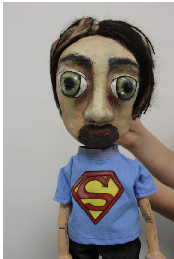
XI. Evelinin otac