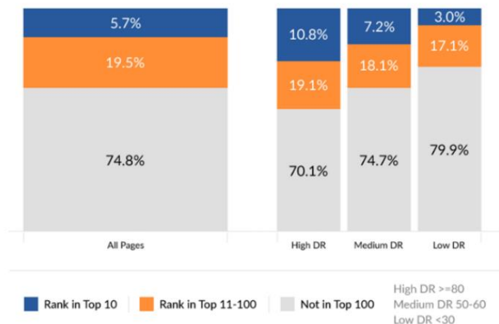
Grafikon 1. Uspješnost web stranica u rangiranju među prvih 10 rezultata pretrage u godini dana.