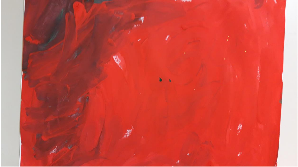
Slika 9., dječji crtež, 4 god.

Crtež pripada četverogodišnjem dječaku. Na dječjim crtežima crvena boja ima snažan utjecaj. Crvena kao boja krvi simbol je entuzijazma i energije. Rad nam sugerira da dijete koje crvenu boju koristi dosljedno, jest dominantan i ekstrovertiran te voli biti u središtu pažnje.