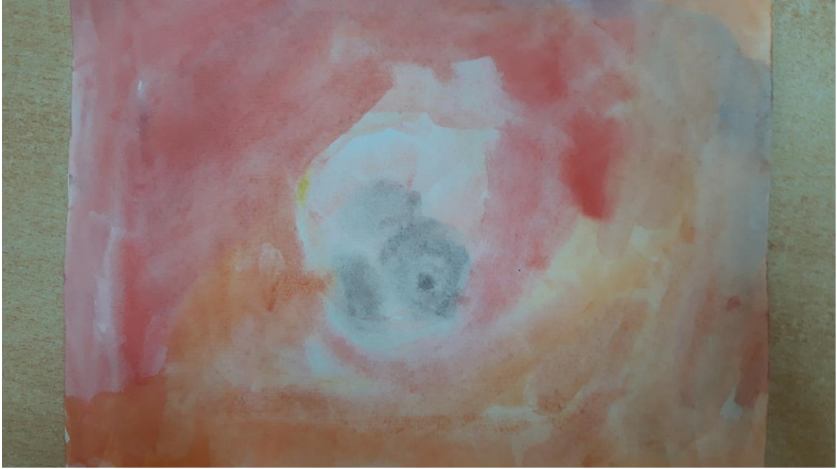
Slika 7., dječji crtež, 4 god.

Rad pripada četverogodišnjoj djevojčici. Prelagan potez kista otkriva bojažljivost, hipersenzibilnost, introvertno te kako je često vrlo suzdržano dijete. To može biti i znak potrebe za pažnjom, odobravanjem i pohvalom.