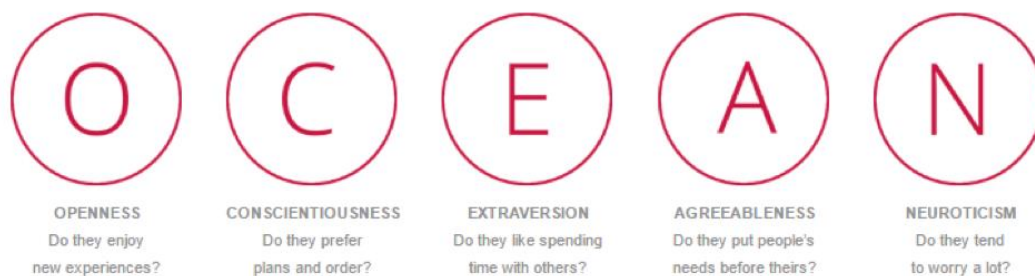
Slika 2. Prikaz modela osobnosti OCEAN