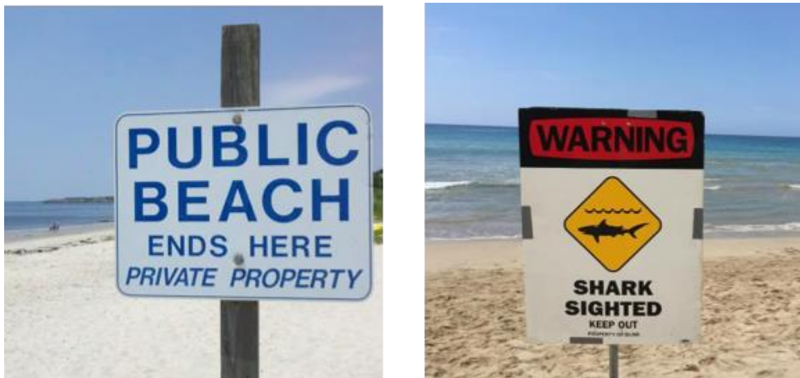
Slika 1. Primjer prenošenja poruke biheviorističkom komunikacijom

Cambridge Analytica u tome je trenutku imala podatke s kojima su mogli doći do velikog broja korisnika Facebooka, ali da bi te podatke iskoristili u korist političke kampanje, bila je potrebna strategija koja je uz analitiku podataka uključivala i biheviorističku znanost te inovativnu oglasnu tehnologiju. Rathi (2019) objašnjava da bihevioristička znanost proučava odnose u ponašanju i djelovanju ljudi ili životinja. Krajnji cilj Cambridge Analytice, pri vođenju političkih kampanja, bio je uvjeriti korisnike Facebooka da glasaju za svog klijenta, što je, objašnjava Rathi (2019), uključivalo prikazivanje oglasa koji bi najvjerojatnije rezultirali promjenom ponašanja kod korisnika. Rathi (2019) je naveo i primjer koji je preuzeo iz prezentacije Alexandra Nixa na Concordia summitu 2016. godine. Primjer na slici br. 1 ilustrira biheviorističku komunikaciju, odnosno važnost vođenja znanosti o ponašanju na um čovjeka prilikom prenošenja poruka. Nix (2016) objašnjava da kada bi čovjek šetajući plažom vidio dva znaka kao na slici 1., znak s lijeve strane bi možda potaknuo čovjeka da se okrene, dok bi znak s desne strane imao daleko jači utjecaj da to učinimo.