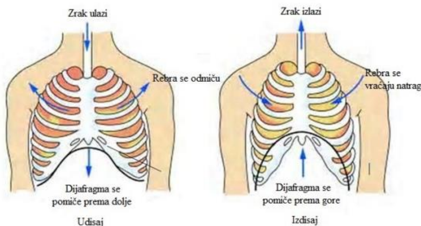
Slika 1. Prikaz položaja dijafragme tijekom udisaja i izdisaja (Bumba, 2020:4)

Dijafragma je jedna od najvažnijih respiratornih mišića, također se naziva i pjevački mišić jer aktivno sudjeluje u pjevanju. Dijafragma je prirodna barijera koja odvaja dva dijela tijela, odnosno odvaja prsnu šupljinu od trbušne šupljine i to je jedini mišić, uz srce, koji radi automatski, ali za razliku od srca, na dijafragmu možemo svjesno utjecati. Ona se podiže prema prsnoj šupljini u trenutku izdisaja, a spušta se prema trbušnoj šupljini u trenutku udaha zraka. Uz sudjelovanje međurebrenih i trbušnih mišića, dijafragma ima važnu funkciju u izvođenju pravilnog disanja, zatim u zadržavanju udahnutog zraka prije zapjeva (u tom trenutku pjevač ima osjet oslanjanja kojeg nazivamo appoggio 2 ). Ona ima važnu funkciju u reguliranju izdisaja daha, odnosno izlaženju zraka tijekom fonacije te svojom kontrakcijom prekida se struja zraka i na taj način ton prestaje.