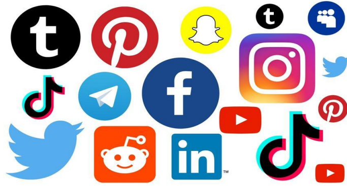
Slika 2 Prikaz nekih od najpoznatijih ikona društvenih mreža