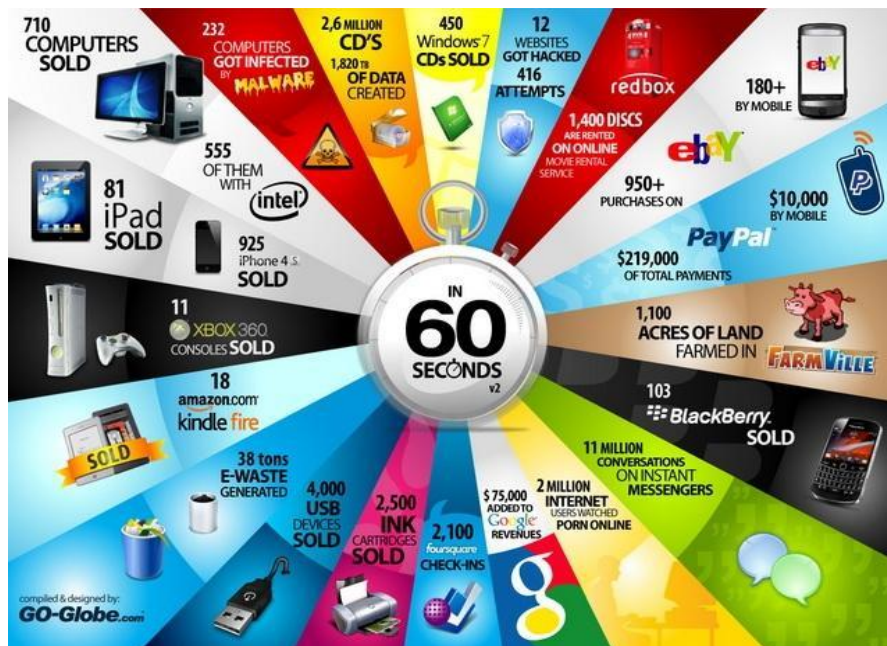
Slika 1 Prikaz onoga što se događa u jednoj minuti na internetu 2021. godini

„Broj aktivnih korisnika interneta i društvenih medija u stalnom je drastičnom porastu, pa je u travnju 2020. godine broj aktivnih korisnika interneta dosegao brojku od 4,57 milijardi, što je oko 59 % ukupnog broja svjetskog stanovništva tj. 7,79 milijardi (Worldometers, 2020).“ (Babić, T. 2021:18)