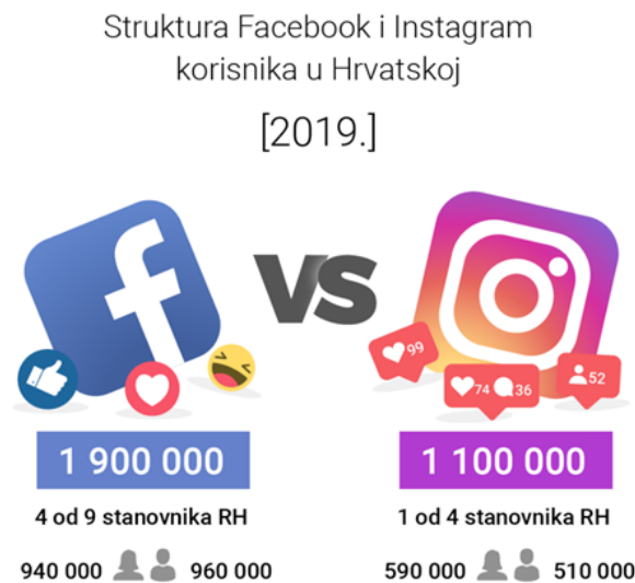
Slika 1. Facebook vs. Instagram na početku 2019. godine: tko smo i što nas najviše zanima (Arbona, 2019.)

od 4 Instagram. Maloljetne populacije (u dobi od 13 do 17 godina) više je na Instagramu. Dok na Facebooku prevladavaju korisnici u dobnoj skupini 25-34 godine, na Instagramu je to populacija u dobnoj skupini 18-24. Instagram je svoj veliki porast broja korisnika u RH doživio 2017. godine kada je broj korisnika sa 390 000 skočio na 730 000, dok ih je 2019. bilo preko milijun. Slika 1. pokazuje broj i spolnu strukturu korisnika jedne i druge mreže.