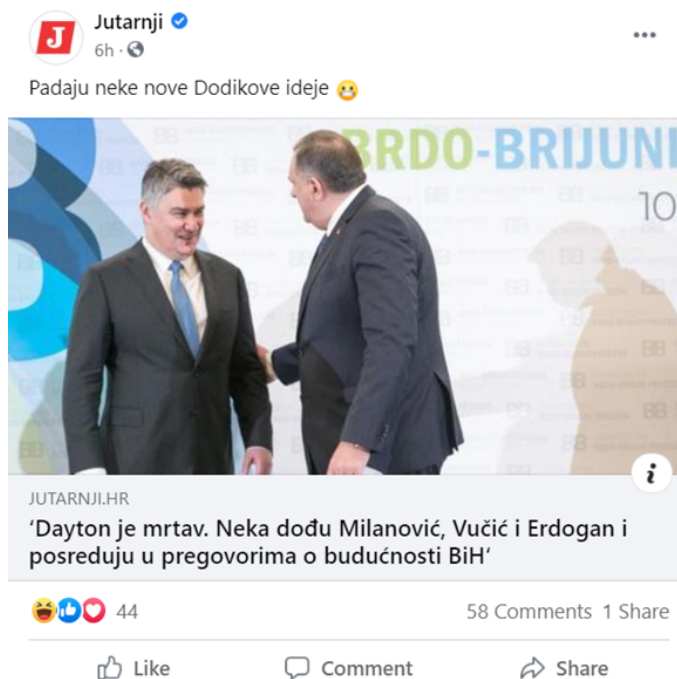
Slika 2. Stranice tiskanih medija na društvenim mrežama i njihove objave prostor su polemike i diskusije za čitatelje i pratitelje stranica (Jutarnji list)

možnostima i ograničenjima predmetnoga medija. U današnje vrijeme razlikuju se one društvene mreže kojima je prvenstvena namjena komunikacija (bilo posredstvom privatnih poruka, tekstualnih objava ili komunikacije u grupama, odnosno komentarima) te društvene mreže kojima je primarna namjena dijeljenje multimedijalnoga sadržaja, odnosno fotografija i videozapisa, dok je verbalna komunikacija u drugom planu, često kvantitativno reducirana (Van Dijck, 2013). Dakle, sam format i opcije mreža diktiraju dijelom način i opseg komunikacije putem njih. Svrhu i funkciju društvenih mreža Sandel i Ju (2019: 4) vide u njihovoj ulozi dostupnoga alata za ljudsku komunikaciju i socijalizaciju te kao način prevladavanja ograničenja masovnih medija 20. st. Uz društvene mreže, za ovakvu svrhu komunikacije korisnicima su dostupni i drugi formati kao što su blogovi (mrežni dnevници), vlogovi (blogovi zasnovani na videozapisima) i internetski forumi.