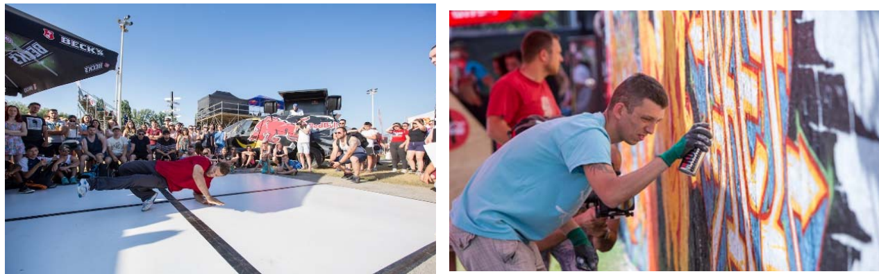
Slika 16. natjecanje u Hip Hop Jam

U nastavku rada se navode slike koje su obilježile Pannonian Challenge 2019. godine svaka u svom segmentu (plesu, grafitima i sportskim događajima).