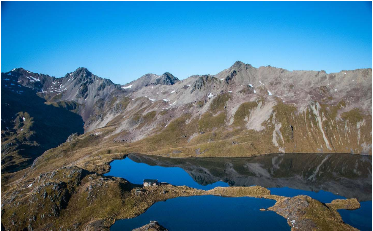
Slika 3. Nelson Tasman

Nelson Tasman je dio Nelson Lakes nacionalnog parka koji je ljubiteljima filma poznat kao mjesto istočni Bree kroz koje je Strider vodio hobite kako bi pobjegli od Crnih jahača.