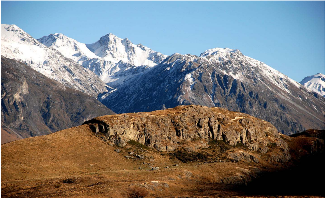
Slika 4. Edoras

Edoras je mjesto u kojem je bio glavni grad naroda Rohana (jahača) i zanimljivost ovog mjesta je da ništa od filmskog seta koji je trajao devet mjeseci nije na njemu ostalo, ali je i dalje popularno među ljubiteljima filma Gospodar prstenova, a i među drugim turistima.