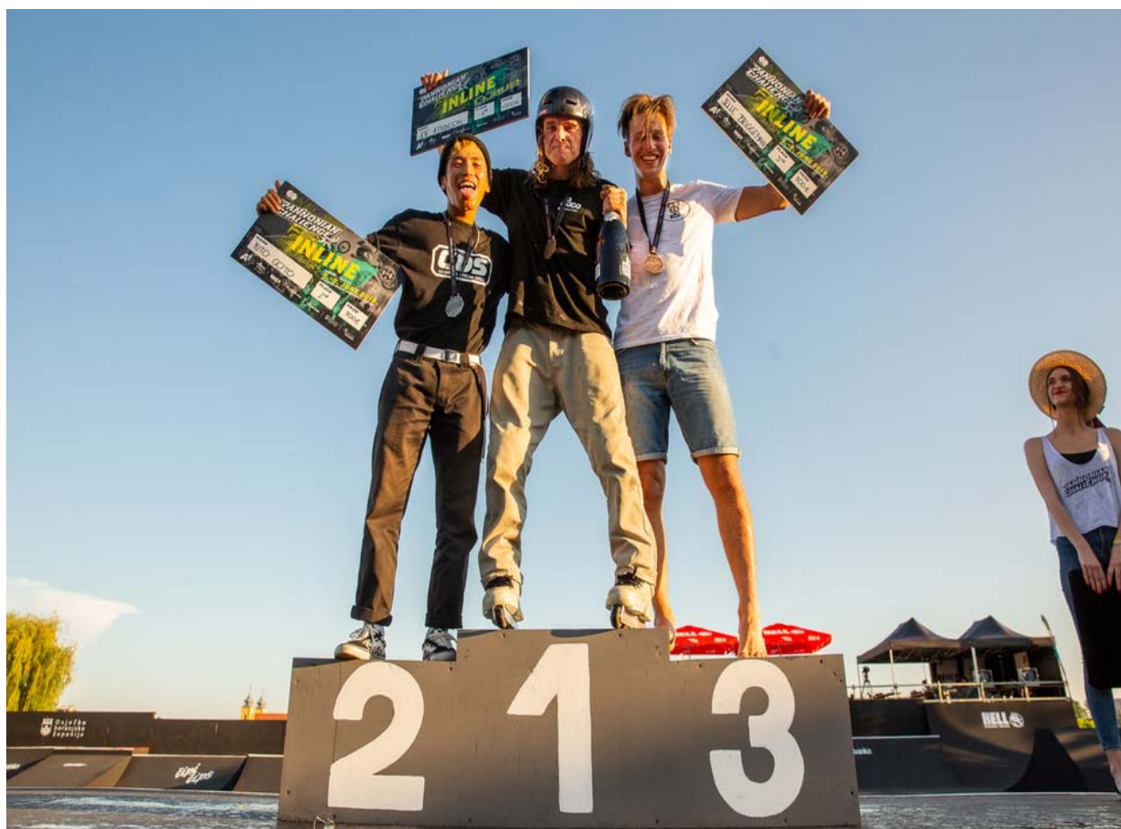
Slika 21. Proglašenje pobjednika u disciplini inline role

Na sljedećoj slici vidi se ceremoniju svečanog proglašenja najboljih natjecatelja u 2019. godini u disciplini inline role.