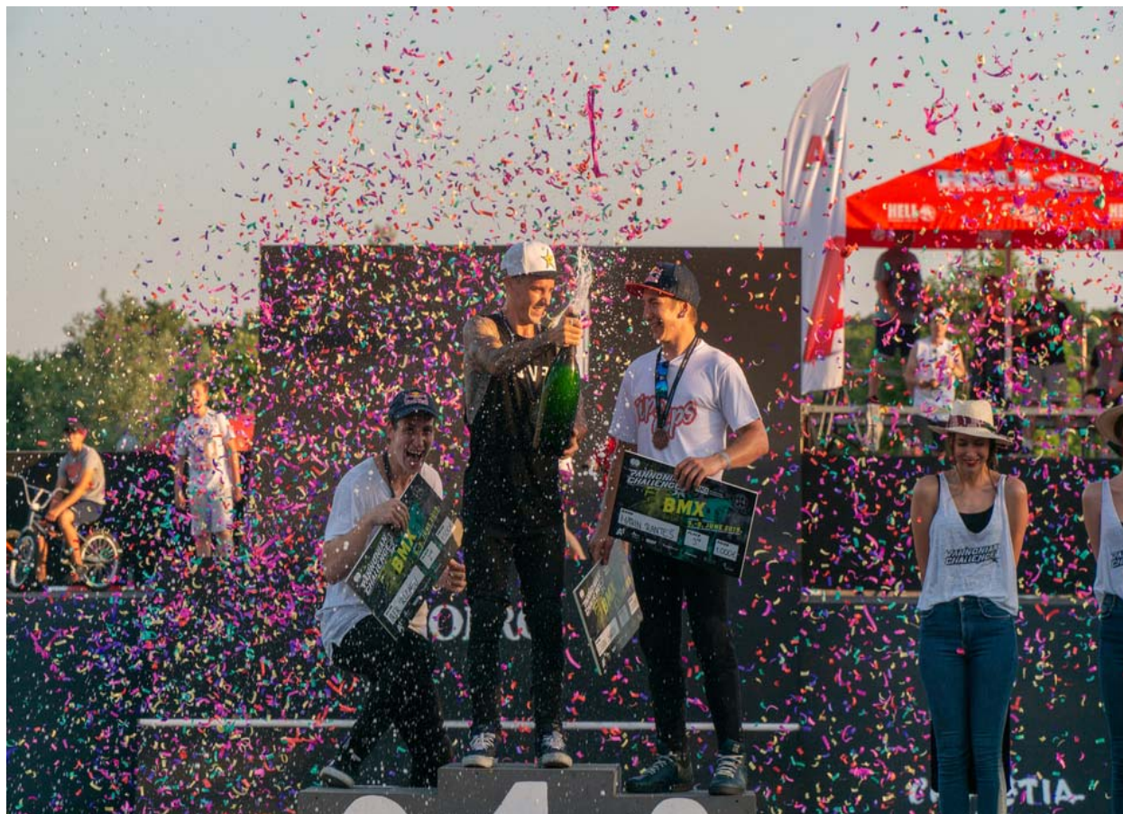
Slika 18. Proglašenje pobjednika u BMX disciplini muškarci

Na slici u nastavku vidi se dio ceremonije svečanog proglašenja najboljih natjecatelja za 2019. godinu u disciplini BMX.