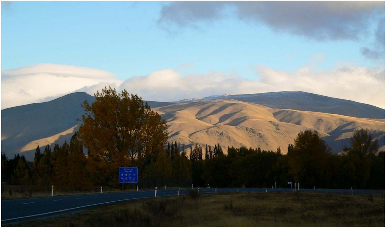
Slika 5. Pelennor Filds

Na Pelennor Fildsu je snimljena epska bitka na kojoj su se sukobili Orči sa pripadnicima Gondora i Rohana. Zanimljivost ove lokacije je što je to privatno vlasništvo, pa se sa vlasnicima mora dogovarati obilazak.