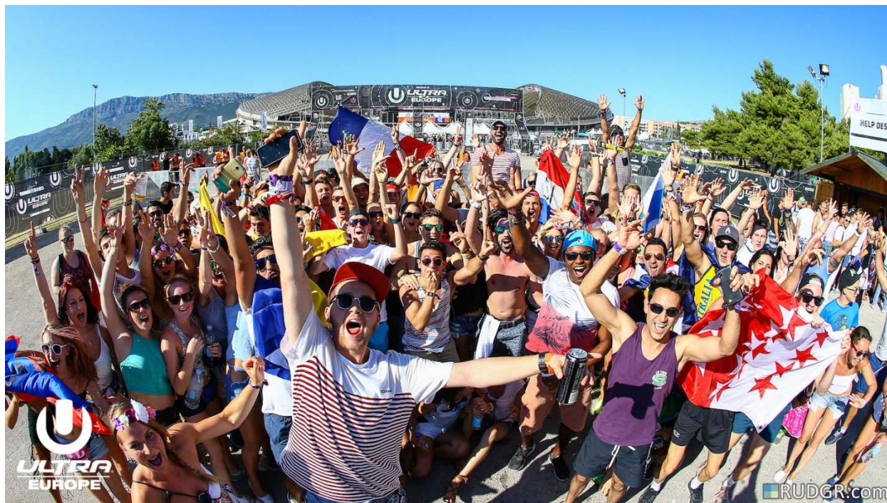
Slika 15. Ultra Europe ispred Poljuda kulturnog stadiona NK Hajduk

Slika u nastavku prikazuje jedan manji dio posjetitelja ispred Poljuda 2018. godine (stadiona na kojem se šest godina održavala Ultra sve do ove 2019 godine). Slika prikazuje stanje, neposredno prije početka Ulte na kojoj se jasno može vidjeti dobro raspoloženje posjetitelja, pa čak kod nekih i nacionalnu pripadnost što potvrđuju zastavama svojih država.