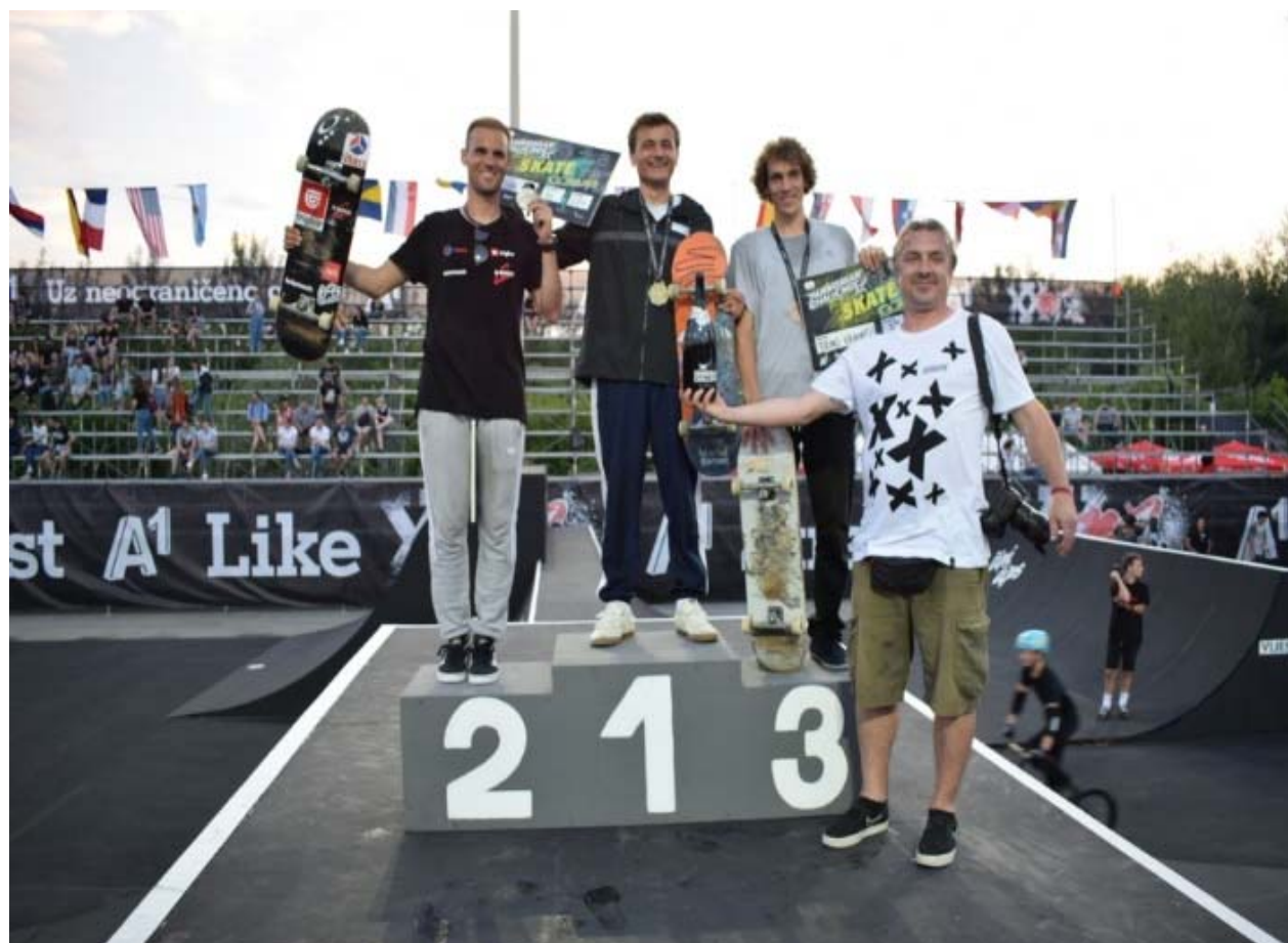
Slika 20. Proglašenje pobjednika u disciplini skate

Na slici ispod vidi se ceremonija svečanog proglašenja najboljih natjecatelja u 2019. godini u kategoriji skate.