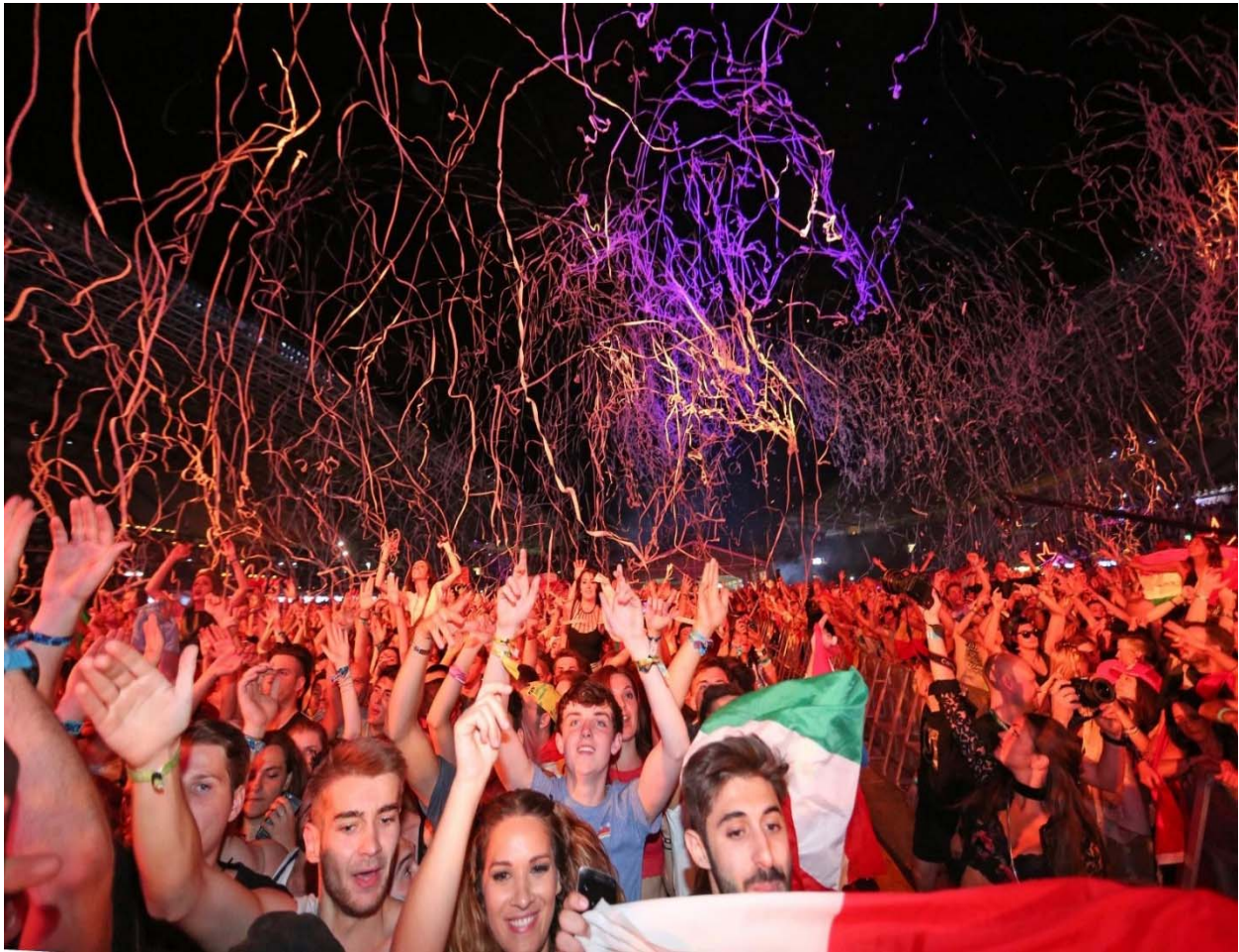
Slika 14. Sea Star

Slika u nastavku prikazuje posjećenost, atmosferu i dobnu pripadnost posjetitelja na Sea Star glazbenom festivalu 2019. godine.