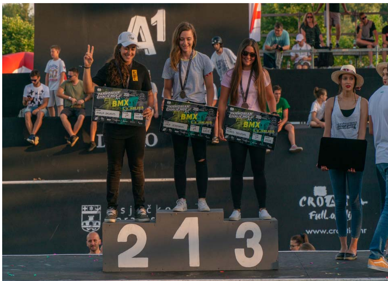
Slika 19. proglašenje pobjednika u disciplini BMX žene

Sljedeća slika prikazuje svečano proglašenje najboljih natjecateljica u 2019. godini u kategoriji BMX.