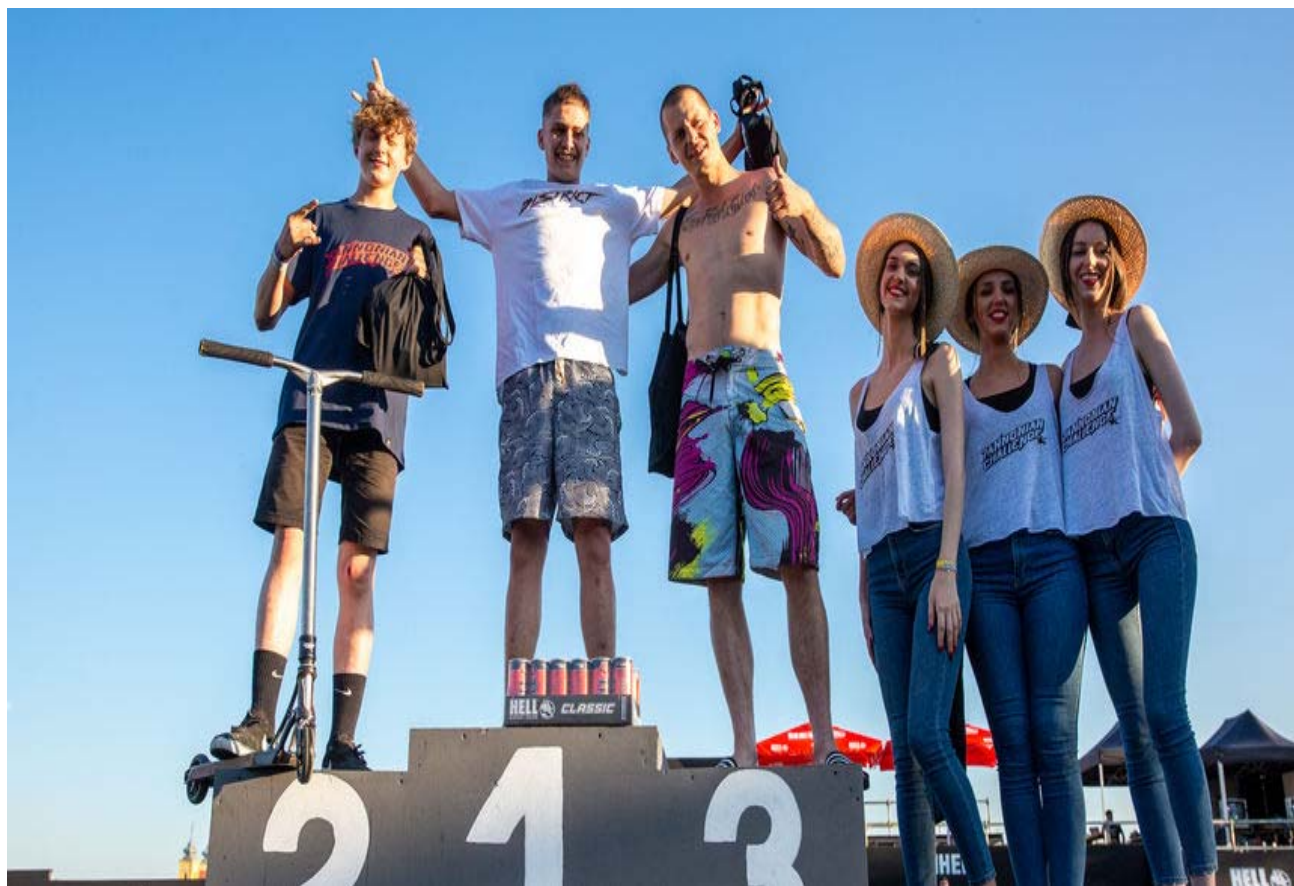
Slika 22. Proglašenje pobjednika u disciplini romobil koja je ove godine prvi puta uvrštena u natjecateljski program.

Na slici u nastavku vidi se premijerno ove 2019. godine svečano proglašenje najboljih natjecatelja u disciplini romobil. Ovo je disciplina koja je ove 2019. godine prvi puta uvrštena u natjecateljski dio programa i težnja je organizatora Pannoniana da od ove godine postane obavezni natjecateljski dio svake godine.