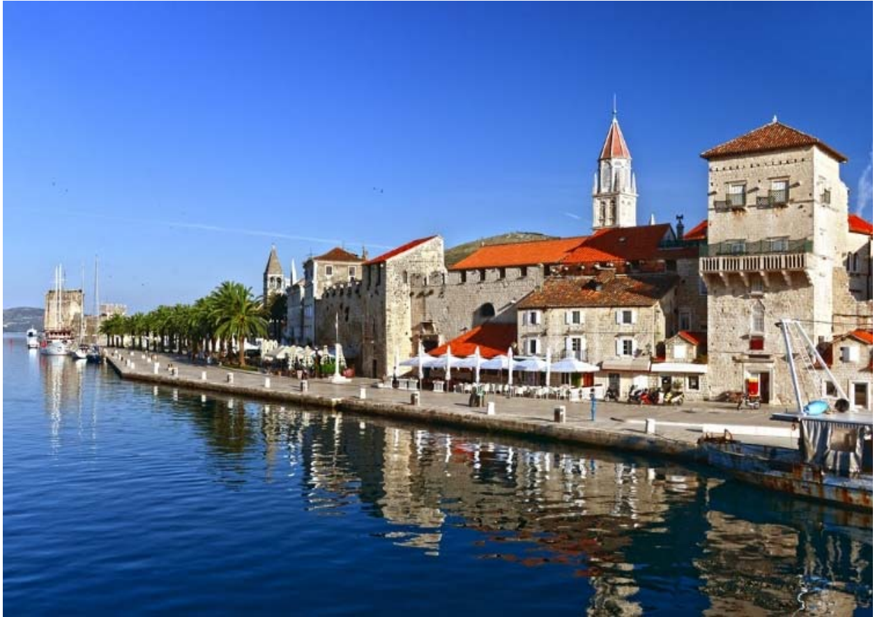
Slika 11. Trogir - Trgovačka luka Qartha

Izvor : https://getbybus.com/hr/blog/lokacije-snimanja-igre-prijestolja-u-hrvatskoj/