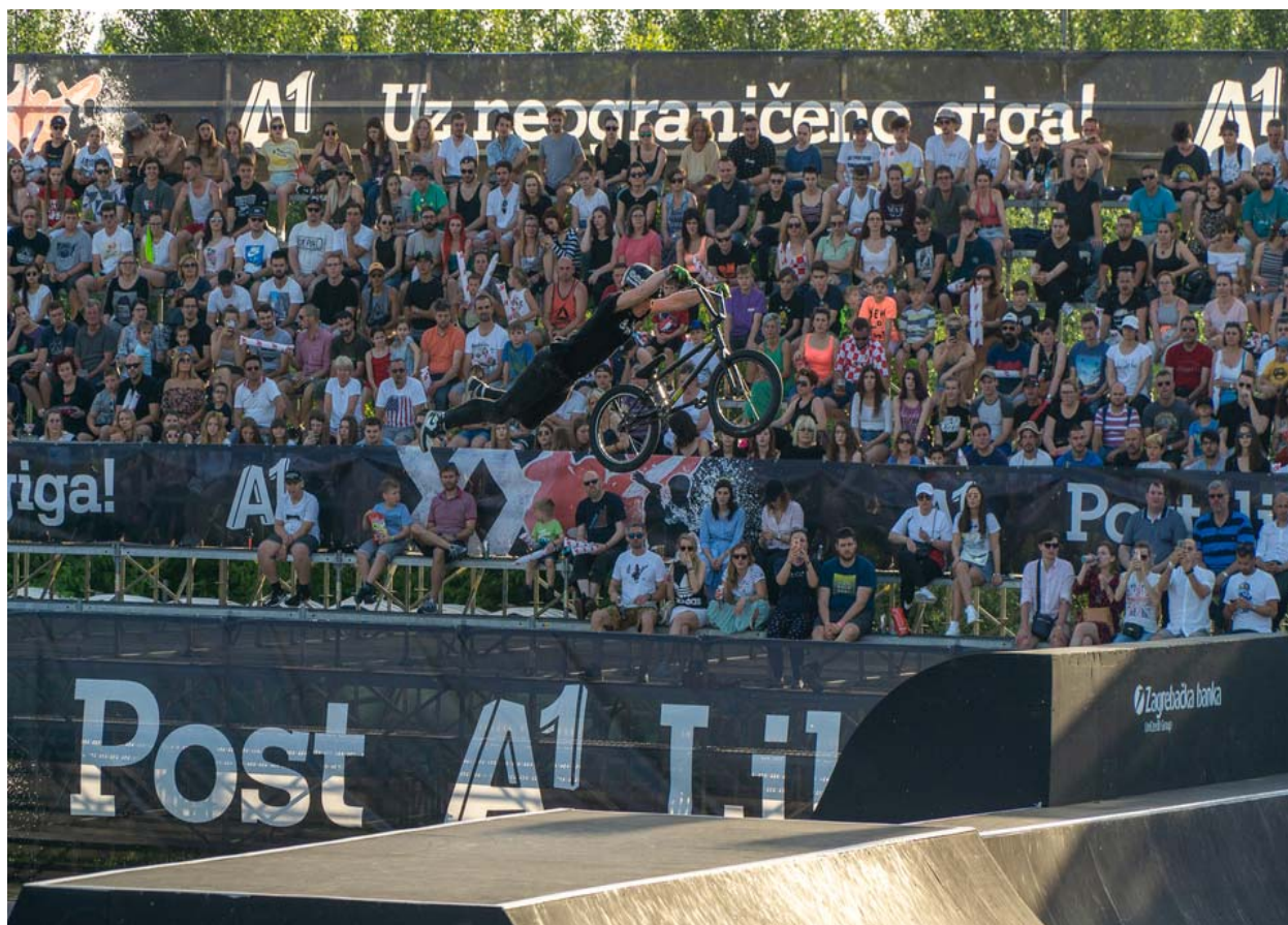
Slika 17. Pannonian Challenge