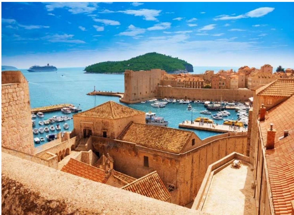
Slika 9. Otok Lokrum -Trgovački grad Qarth