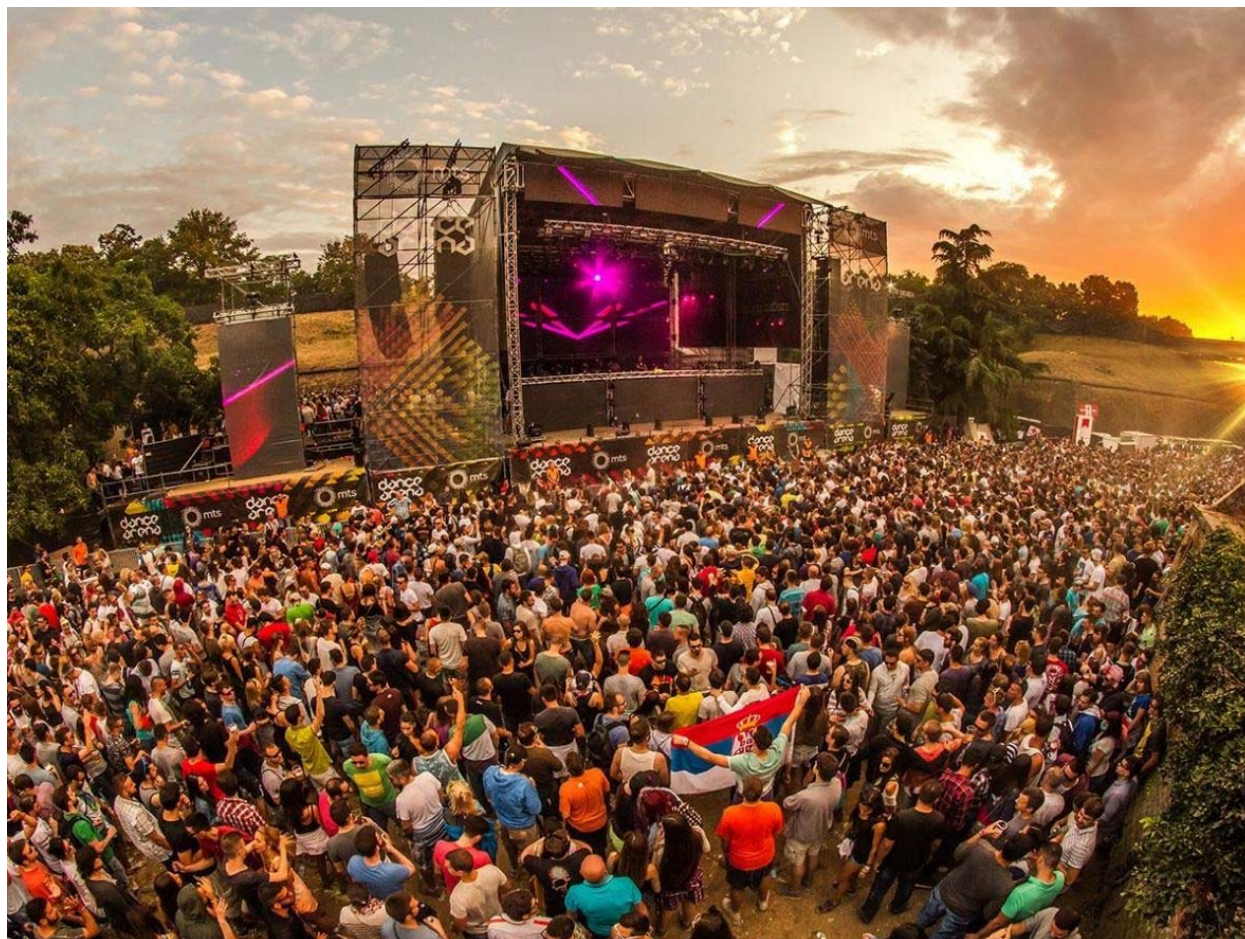
Slika 13. Glazbeni festival EXIT

Slika u nastavku rada prikazuje glavnu pozornicu na kojoj se izmjenjuju brojni izvođači tijekom pet dana trajanja festivala.