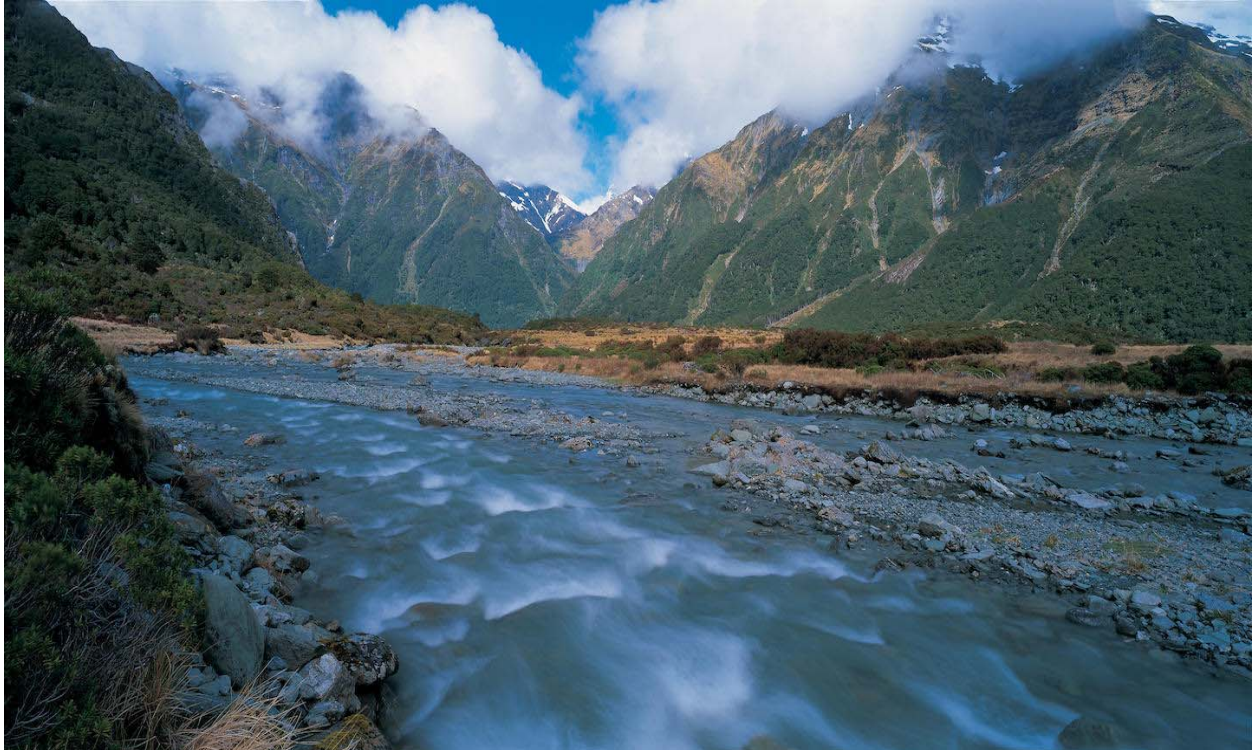
Slika 6. Ford of Bruinen, Gandalf's ride, Isengard and Lothlorien

Wanaka, Mount Aspiring nacionalni park dom je više filmskih scena korištenih u trilogiji Gospodar prstenova neka od njih su Gandalfova vožnja zaprežnim kolima od Isengard do Lothlorien bukove šume. Pojavljuje se i u uvodnom dijelu Dvije kule u Arrow River, tu se pojavljuju kipovi tj. stupovi kraljeva Anduina i Argonatha koji su računalno dodani u kadar. Tu je i mjesto seta Međuzemlja.