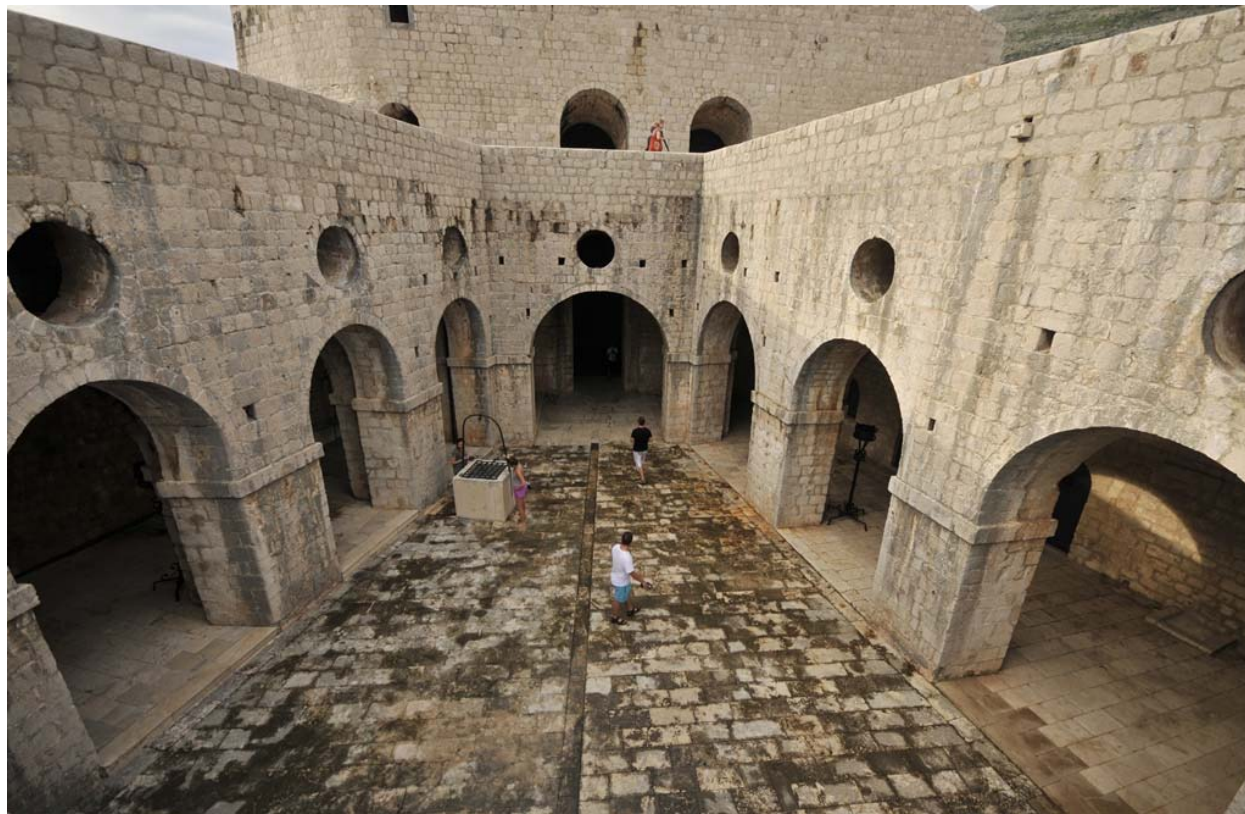
Slika 7. Kings Landing & Red Keep

Tvrđava Lovrijenac na filmskom setu je utjelovila King's Landing ili Kraljev Grudobran