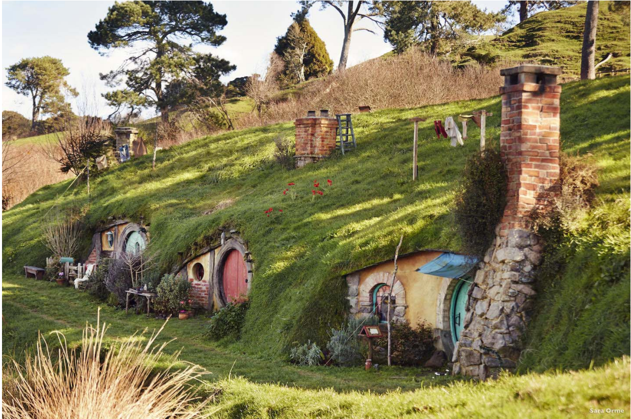
Slika 1. The Shire and Hobbiton selo u kojem žive Hobbiti

Matamata mjesto na kojem je smješten The Shire i Hobbiton je doslovno napravljeno za potrebe seta i ostat će trajna atrakcija. Ova slika prikazuje Shire selo u kojem žive Hobbiti, a nastalo je za potrebe snimanja trilogije.