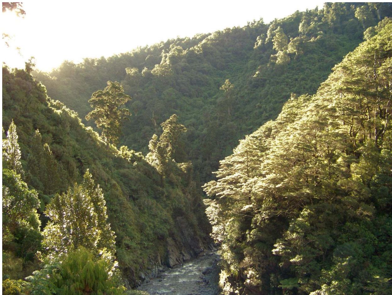
Slika 2. Mount Victoria

U Wellingtonu je sniman Gardens of Isengard, the River Anduin, Rivendell, Osgiliath Wood, Paths of the Dead. Ova slika prikazuje novozelandsku netaknutu prirodu koja je u više scena korištena kao filmski set, a postala je nezaobilazno mjesto posjeta ljubitelja trilogije Gospodar prstenova.