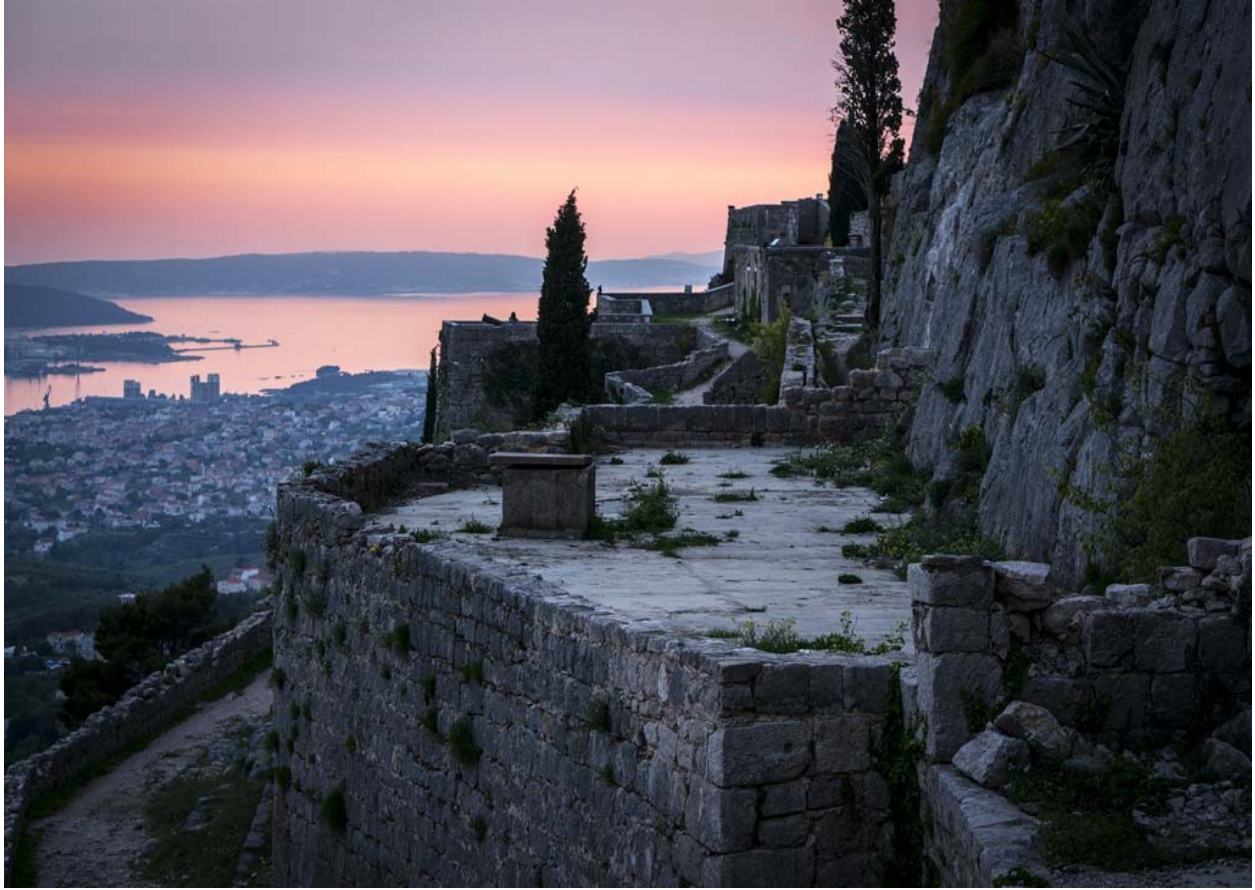
Slika 10. Split i Kliška tvrđava - Grad Meereen