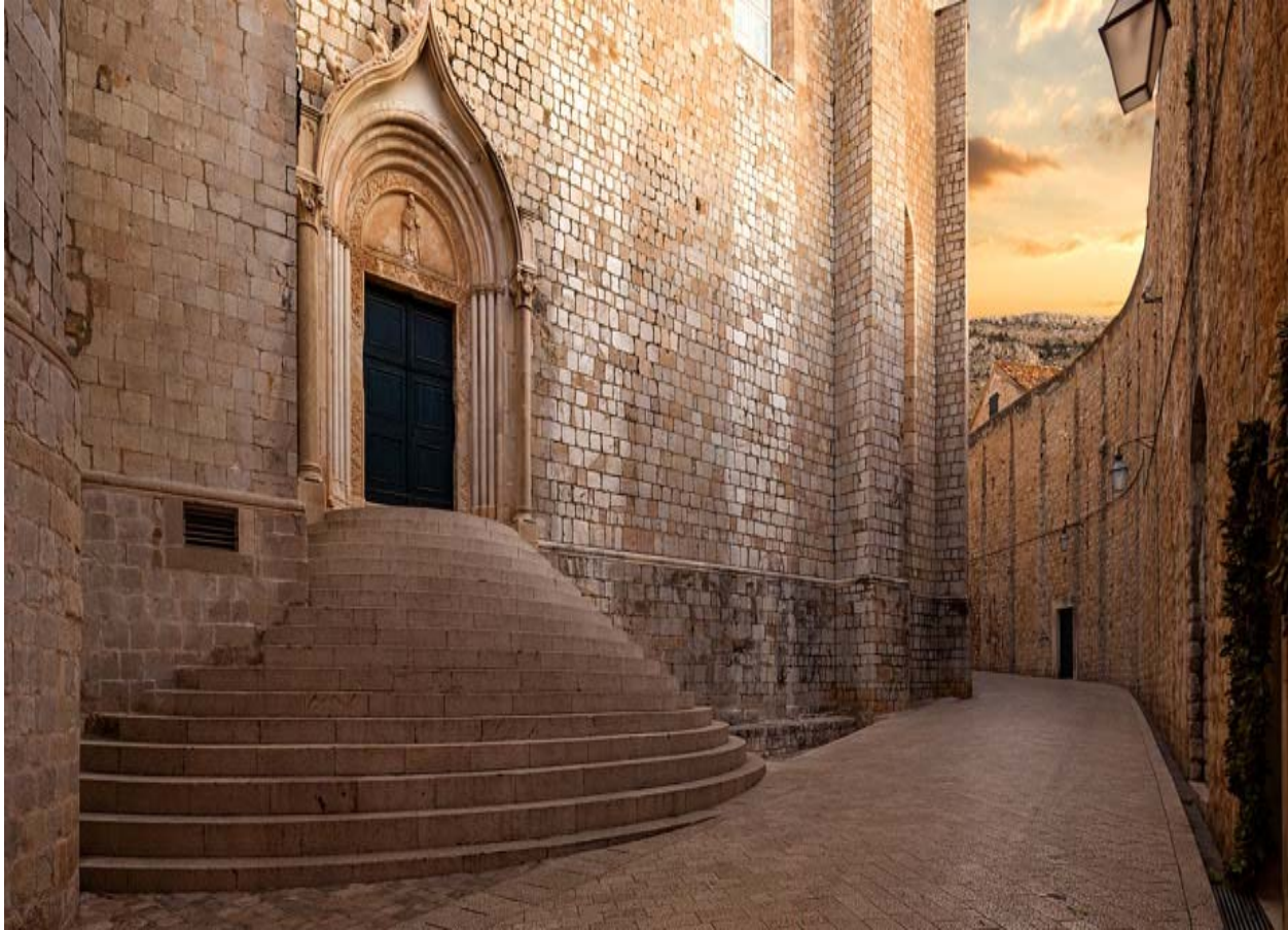
Slika 8. Ulica sv. Dominika lokacija poslužila za snimanje scene ubojstva nezakonitih sinova kralja Roberta i hod srama Cersei Lannister.