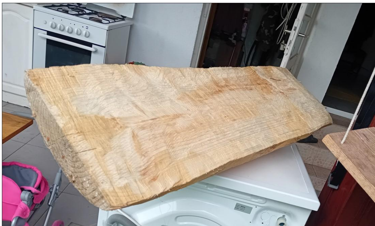
Slika 9. Oblikovanje drveta

Ideja mi je bila da drvo iz sredine ide prema van i vizualno se širi iz sredine. Kada sam završio grubu obradu drveta, skinuo sam brusnu ploču za drvo i stavio sam brusni papir na kutnu brusilicu. Brusnim sam papirom brusio cijeli donji dio skulpture, dok sam gornji ravni dio skulpture hoblom prešao kako bi se dodatno poravnalo. Zatim se stvorila rupa, odnosno pukotina, na gornjem djelu. Tada sam uzeo sitnu piljevinu i ljepilo za drvo, pomiješao ih i nanio na mjesto pukotine tri puta. To se sušilo 3 dana. Zatim sam cijelu skulpturu nastavio ručno brusiti, gornji i donji dio te sam blanjalicom na donjem dijelu napravio jedan mali ravni dio na koji će se skulptura oslanjati. Zatim sam krenuo u izradu kugle. Napravio sam nacrt sa šestarom, ravnalom i olovkom na papiru. Napravio sam krug sa šestarom i mrežu preko njega.