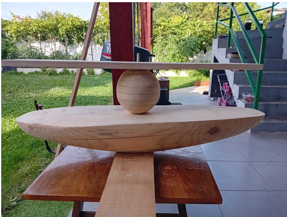
Slika 13. Gotova skulptura