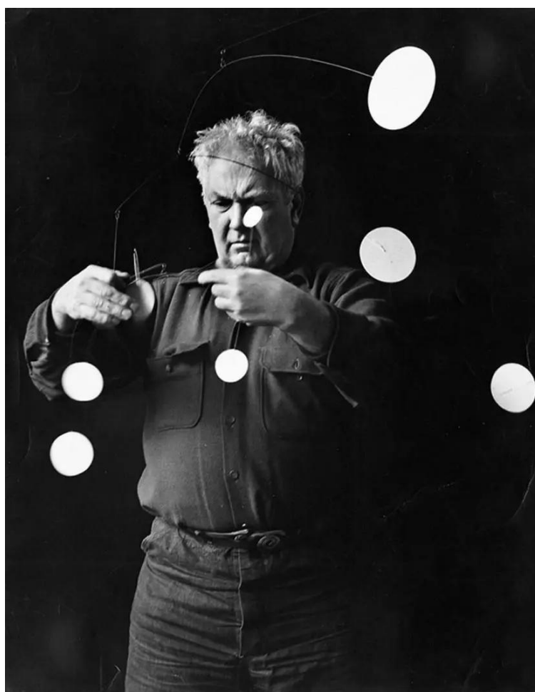
Slika 5. Alexander Calder sa Snježnom mećavom 1 , 1948.

Rođen 22. srpnja 1898. u Lawntonu u Pennsylvaniji, Alexander Calder američki je kipar koji potječe iz umjetničke obitelji. S obzirom na to da su i djed i otac bili kipari i da je majka bila slikarica portreta koja je studirala u Parizu, umjetnost je bila sastavni dio njegova okruženja od najranije dobi. Alexander Calder napravio je mobilnu skulpturu Snježna mećava , kao što se može vidjeti na slici 5.