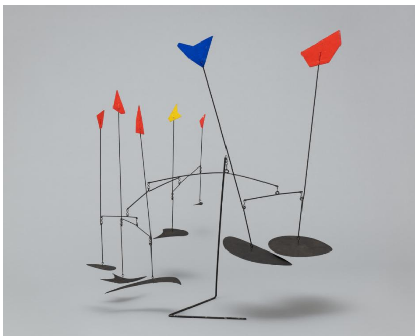
Slika 6. Alexander Calder, Mobil s četrnaest zastava , 1945.

Preuzeto 15. studenog 2023., poveznica: https://www.moma.org/collection/works/80871