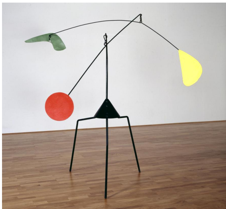
Slika 7. Alexander Calder, Bez naslova , 1937.

Preuzeto 15. studenog 2023., poveznica: https://www.moma.org/collection/works/80871