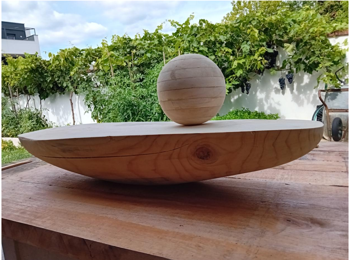
Slika 12. Oblikovano drvo i kugla

Zatim sam izbušio rupu točno na sredini kugle s bušilicom, debljine 1 cm i probušio sam rupu na glavnom dijelu skulpture, točno na sredini do dubine 3 cm, također širine rupe 1 cm. Točno na sredini daske izbušio sam rupu promjera 1 cm. Uzeo sam drvenu tiplu debljine 1 cm, skratio ga, krajeve sam izbrusio brusnim papirom kako bi lakše ulazili i izlazili te sam provukao tiplu kroz glavni veliki komad drveta, pa sam kuglu provukao kroz tiplu i dasku provukao kroz tiplu.