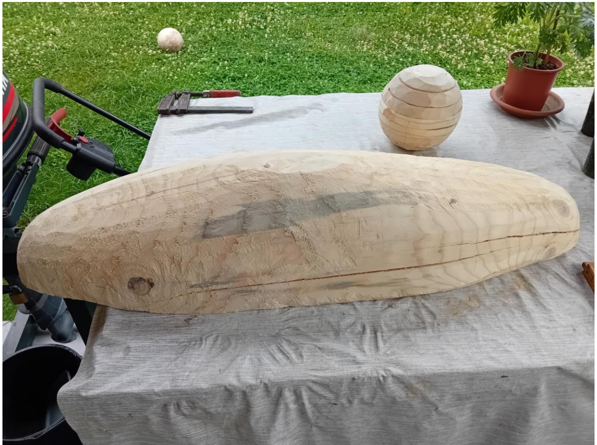
Slika 10. Oblikovanje drveta i kugle

Drugi sam dan stegom pričvrstio daske za stol i onda polako skidao na četiri dijela, dio po dio kutnom brusilicom brusnim papirom granulacije 40.