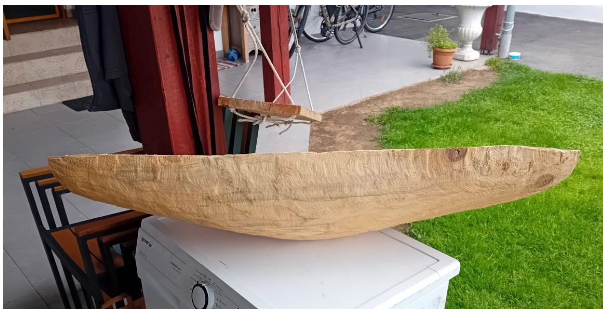
Slika 8. Oblikovanje drveta

Rad je realiziran tako što je komad drveta topole odsječen na pola motornom pilom. Sve je drvo korišteno za izradu rada topola. Ta polovica nije odrezana pravilno zbog teškoća s alatom, koji nije ravno prolazio kroz drvo i zbog veličine motorne pile koja nije bila adekvatna jer mač motorne pile nije bio dovoljno dugačak. Kada sam odsjekao polovicu drveta, krenuo sam još ugrubo rezati motornom pilom veće komade kako bi oblikovao komad drveta. Odsjekao sam više komada da bi dobio deblju sredinu drveta, a krajeve tanje. Zatim sam uzeo kutnu brusilicu i stavio brusnu ploču za drvo te sam krenuo u grubu obradu drveta. Ravni dio drveta koji sam odsjekao motornom pilom nije bio ravan, bio je grbav s dvije različite strane te sam to poravnao brusnom pločom za drvo. Kutnom brusilicom oblikovao sam drvo kako bi bilo oblije i vizualno mekše. Na sredini sam ostavio najdeblje dio jer na njemu mobil treba stajati. Krajeve sam kasnije motornom pilom malo skratio i oblikovao te sam nastavio oblikovati drvo kutnom brusilicom. Brusio sam tako kako bi na sredini ostalo najdeblje, a iz sredine se sužavalo prema krajevima, takve sam poteze radio s brusnom pločom za drvo.