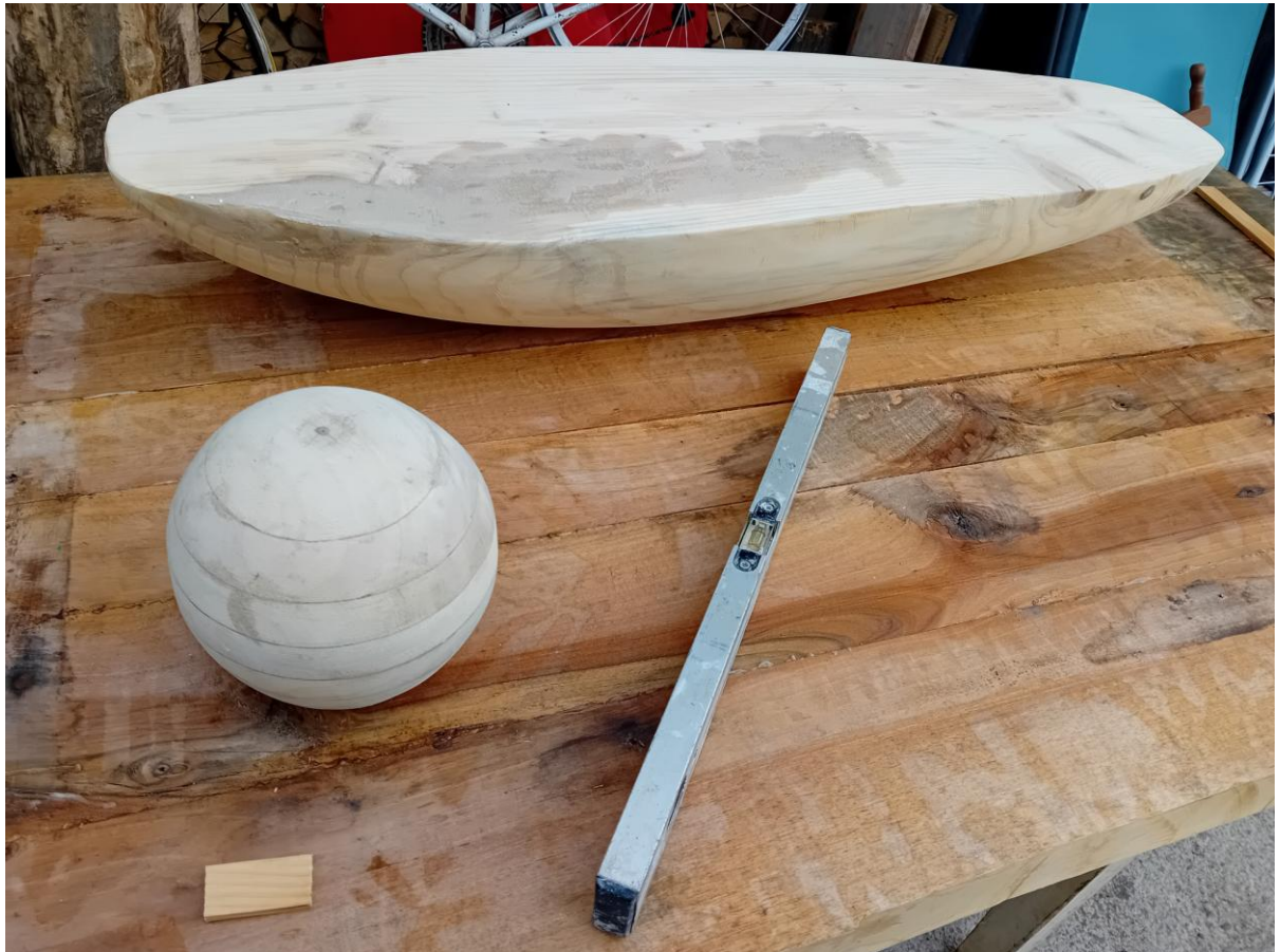
Slika 11. Oblikovanje drveta i kugle

Skidao sam tako da bi svaki dio bio zaobljen. Poslije toga išao sam granulacijom od 60. Na kraju sam brusio rukom, granulacijom 80. Skidao sam i oblikovao u oblik kugle, dok nisam dobio željeni oblik. Zatim sam uzeo dasku te sam odsjekao krajeve kako bi bili ravni pa sam s kutnom brusilicom na kojoj je bio brusni papir izbrusio cijelu dasku.