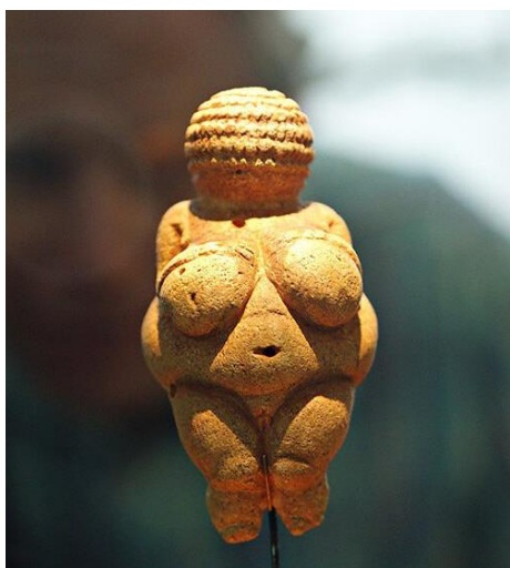
Slika 5. – Primjer stilizacije ljudskog lika, Willendorfska Venera , 25 000 pr.Kr., kamen

Ljudski lik, odnosno figura se još od prapovijesti pojavljuje kao dominantna tema preokupacije ljudskog uma te ga kao motiv nalazimo već na prvim spiljskim crtežima i pronađenim figurinama. Ljudi konstantno promišljaju i percipiraju sami sebe i druge oko sebe, pozicionirajući se u svijet koji ih okružuje. Ta percepcija se najeksplicitnije izražava kroz umjetnost i filozofiju, čija se uska povezanost može definirati kroz reprezentaciju određenih ideja putem konkretnog umjetničkog izričaja. Zbog toga se prikaz ljudskog lika kroz povijest mijenjao sukladno promjenama kroz koje je čovjek prolazio, a očitovao se na brojne i različite načine. 10 Pri tome pratimo njegov put od stilizacije, realizma, idealizma, naturalizma pa sve do ponovne stilizacije, apstrahiranja i potpune apstrakcije (Slike 5, 6).