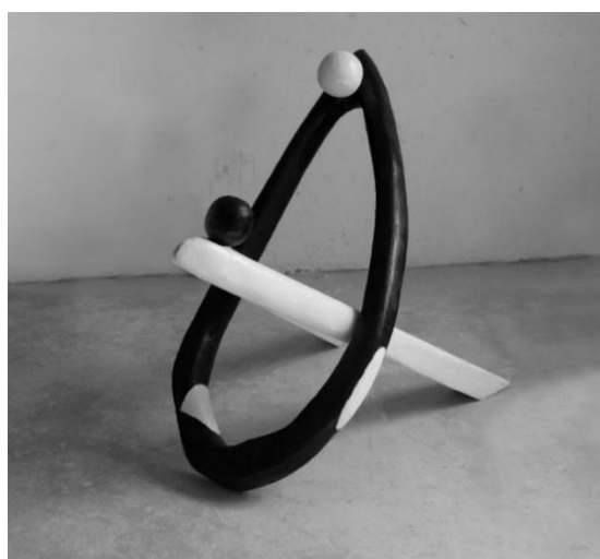
Slika 6. – Primjer stilizacije ljudskog lika, Šime Zupčić, Ples , 2023., drvo

Njegov prikaz manifestira se i kroz različite uloge koje je on u određenim periodima imao, pri čemu se one generalno mogu podijeliti na razne dokumentarističke prikaze i na one pomoću kojih se iznose i naglašavaju određene ideje i koncepti. U oba slučaja autor smatra da je umjetnost većim dijelom svoje povijesti bila ograničena, kako u duhovnom smislu (kroz univerzalne tematike i sl.), tako i kroz navedeno pomanjkanje tehnoloških znanja, sirovina i materijala. Čovjek je time dugo vremena prikazivan unutar zadanih normi koje možemo pratiti kroz prihvaćanje nekih općih ideja (pretila žena kao znak plodnosti, bog kao bradati starac, atletski građani heroji i sl.), ili kroz poštivanje zadanih pravila i načela (proporcije i perspektiva