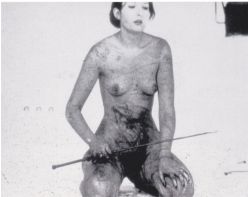
Marina Abramović, Thomasove usne , 1975., Innsbruck