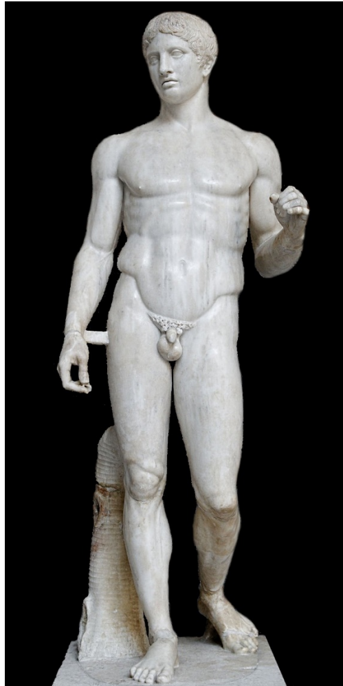
Poliklet, Dorifor ili Kopljonoša , 450 pr. n. e.

sasvim uobičajeno i normalno u grčkoj kulturi. Istraživači su tražili bilo kakve tragove antičke tradicije takve vrste i nisu ju uspjeli naći. To je koristilo ujedno i umjetnicima, jer atletima skidanje odjeće i boravljenje bez iste nije bilo strano.