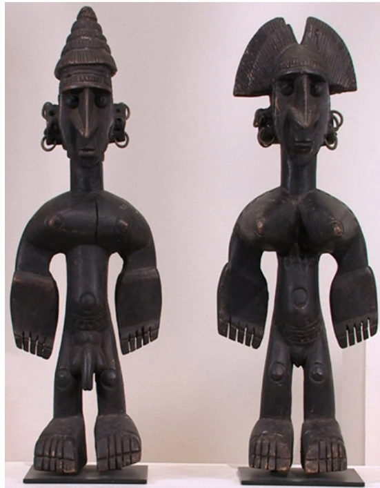
Bambara figurice, Mali, Zapadna Afrika, 1900 g. – 2010 g.

Ljudi često pregovaraju o raznim idejama koje se tiču identiteta, jedna od njih je kako prikazujemo svoj ili tuđi identitet kroz prikaz tijela. Tijelo u umjetnosti nam može dati neiscrpan izvor informacija te se može oblikovati kako bi nam poslalo određenu poruku; tijelo može prikazati imućnost, stalež, starost, spol... Spol uzimamo zdravo za gotovo kao nešto što je prirodno, ali kad počnemo razmišljati gledamo li prikaz muškog ili ženskog tijela u biti donosimo zaključke o tome kako ljudi inače prikazuju spolnost i koliko smo naviknuti na takav prikaz. Imamo zanimljiv primjer iz afričke države Mali i njihove etničke skupine Bambara. U prilogu niže vidimo dvije Bambara figurice koje reprezentiraju muško i žensko, figurice same po sebi su vrlo slične i po visini i po obliku glave, jedino što ih razlikuje su spolni organi koji nisu očit na prvi pogled. Prikaz tijela također povezujemo sa socijalnom ulogom, koliko je osoba više rangirana u društvu to je prikaz više ukrašen i veće je veličine. Interesantno je istraživati prikaz tijela određene kulture ili tradicije jer otkriva tijekom razmišljanja te kulture.