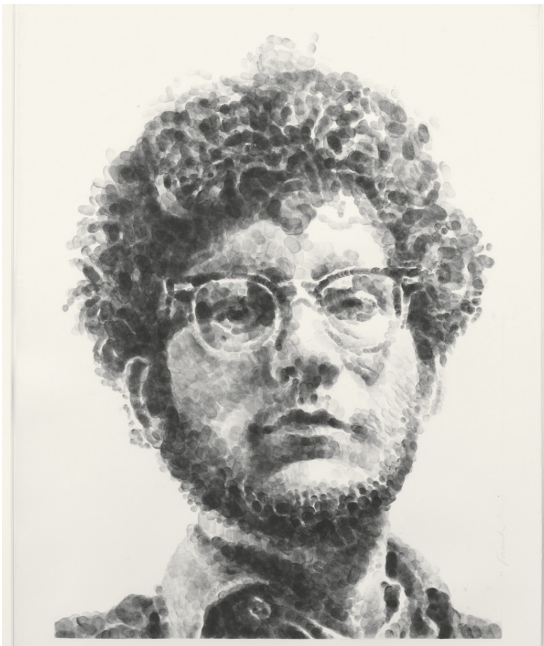
Chuck Close, Frank , 1980.

Tijekom kreativnog zadatka razgovarali bi o pojmu „daktioskopija“ i jesu li upoznati s njim. Riječ potiče iz grčkih riječi „ daktylos “ što znači „prst“ i „ skopeo “ što znači „gledam“ te označava metodu identificiranja osoba putem otiska prsta. Postavili bi pitanje znaju li koje vrste otiska prsta ili koji oblik papilarnih linija sve postoji? Dok analiziraju svoje prste, ponovili bi kako razlikujemo tri vrste otiska: oblik luka, oblik petlje ili zamke i kružni oblik. Na projekciji bi imali par primjera kako su ljudi ukrasili i na koji su način ostavili trag otiska prsta kao poticaj inspiraciji. Među njima bi bili radovi poznatog američkog umjetnika pod imenom Chuck Close koji je napravio kompletne, detaljne portrete koristeći otiske svojih prstiju.