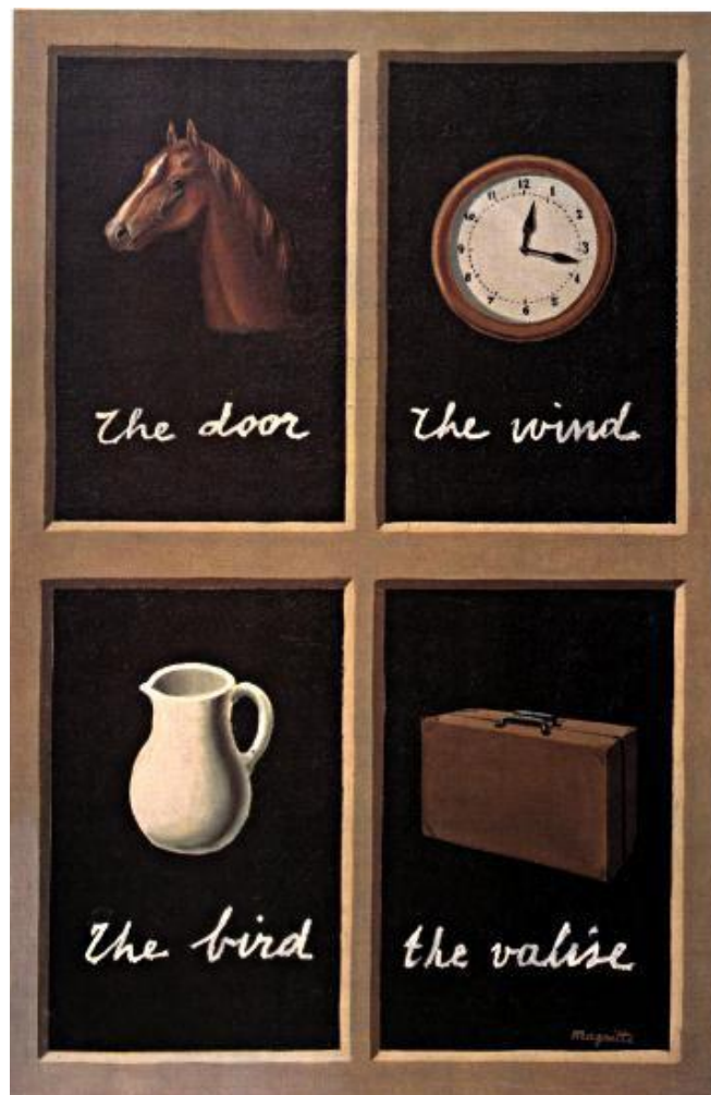
Slika 4. Renée Magritte: „Ključ snova“