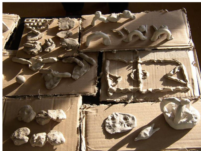
Slika 2. Dječji radovi. Motiv: taram, baram, beca