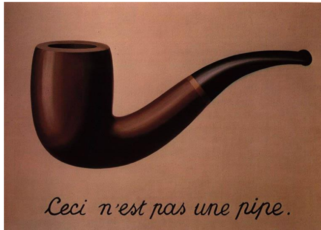
Slika 3. Renée Magritte: „Ovo nije lula“