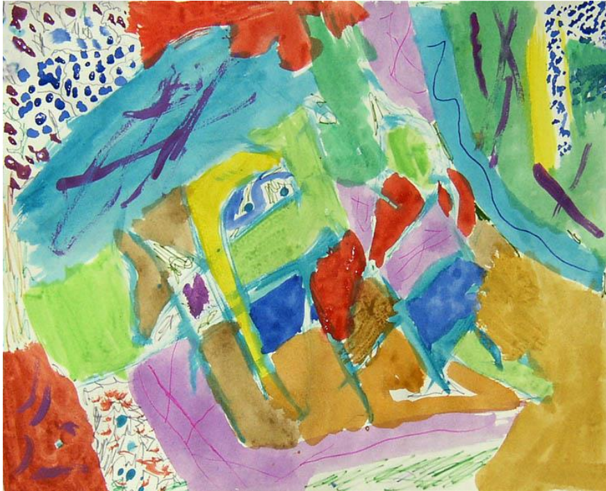
Slika 5. Dječji rad, motiv: glazba