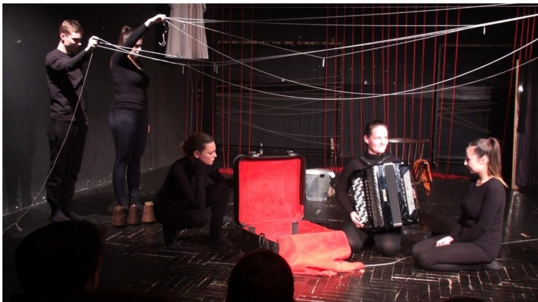
Slika 5: Promjena popraćena pjesmom: „Što je život?“

Svaka scena pomaknula je granice lutkarstva, svaka pjesma izmamila poeziju iz naših unutarnjih svjetova, svi vizualni efekti uspjeli su utkati još duše u sevdalinke, koje su je ionako pune. Jedini zadatak koji je ostao bio je pronaći jedinstveni kod igre koji bi prenio ljepotu nesebičnog kolektivnog dijeljenja i ispreplitanja unutarnjih života svakog od nas. Kako bismo to uspjeli predstavu nismo mogli ostaviti na razini tehničkog izmjenjivanja osmišljenih scena, nego smo ih uz pomoć igranih promjena spajali u cjelinu.