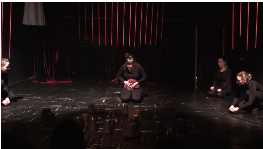
Slika 4: Spuštanje crvenih niti sistemom kolotura

Ne klepeći nanulama. Predmetima poput stolice za ljuljanje, kante te užeta za rublje nastojali smo stvoriti atmosferu toplog majčinskog doma koji će animacijom oživjeti pred očima publike i pokrenuti lavinu sjećanja. Najkompliciraniji scenografski element predstavljao je mehanizam u sceni inspiriranoj pjesmom Na mezaru majka plače . Zavjesa crvenih niti koja se spuštala sa stropa bila je izrađena uz pomoć niza kukica pričvršćenih na sajle kroz koje smo sistemom kolotura pokretali spomenute niti.