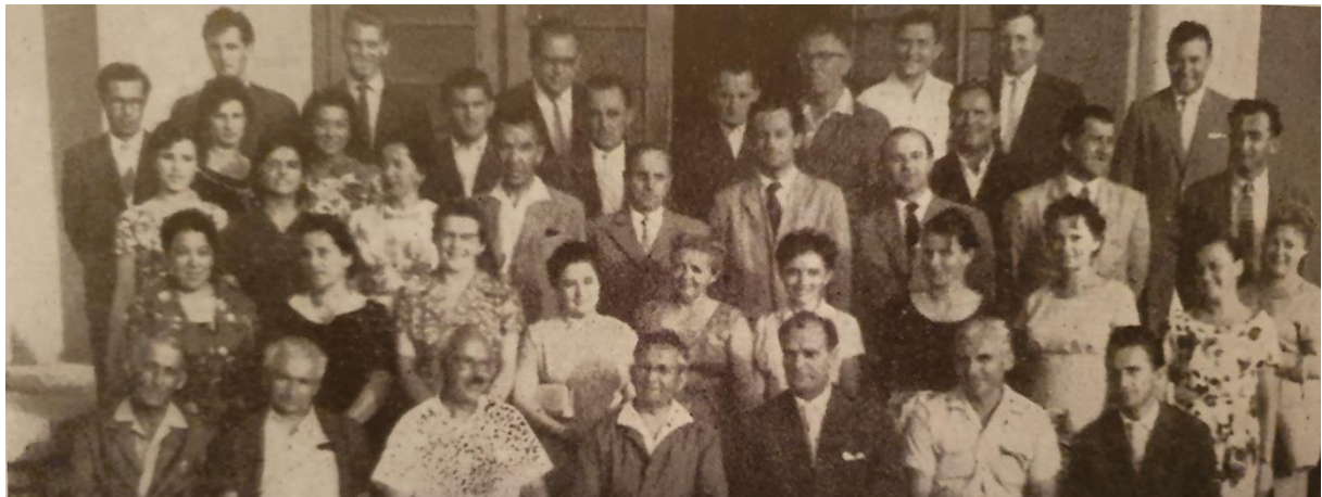
Slika 2. Skupina gradišćanskih Hrvata s nastavnicima na glazbenom tečaju u Crikvenici 1960. godine