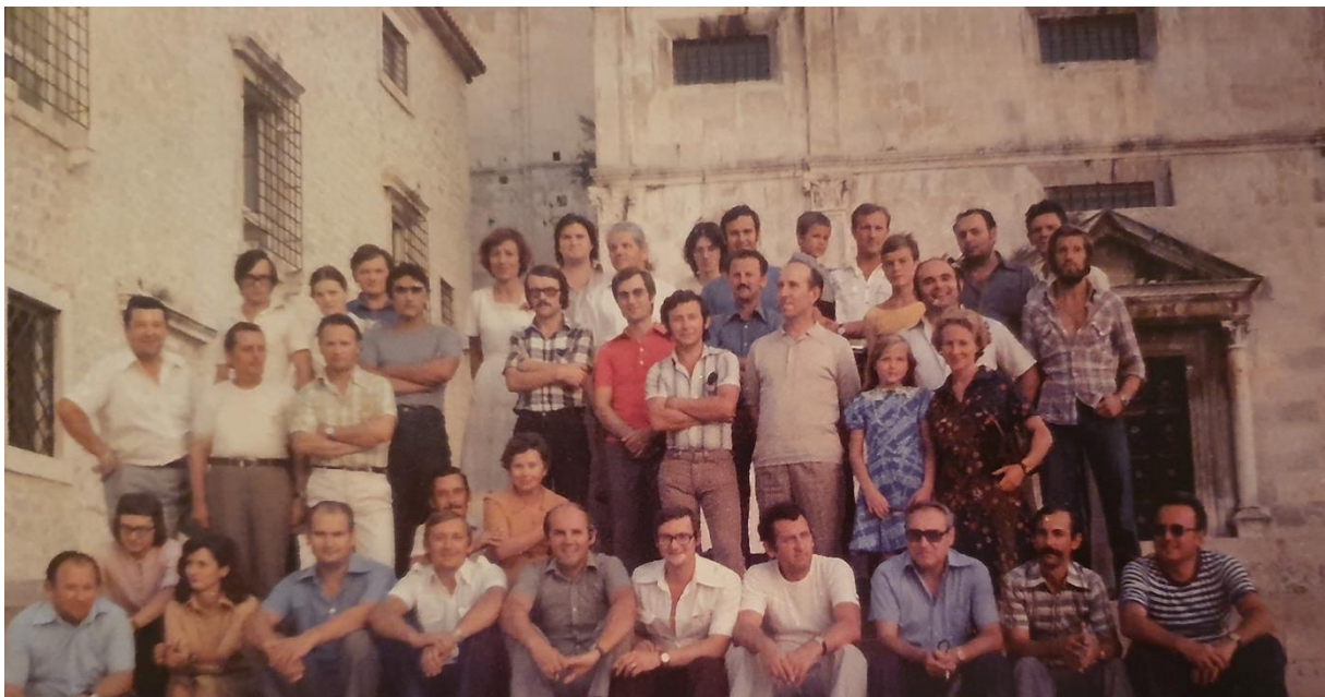
Slika 3. Polaznici i predavači Seminara za dirigente tamburaških orkestara i voditelje malih sastava u Zadru 1977. godine