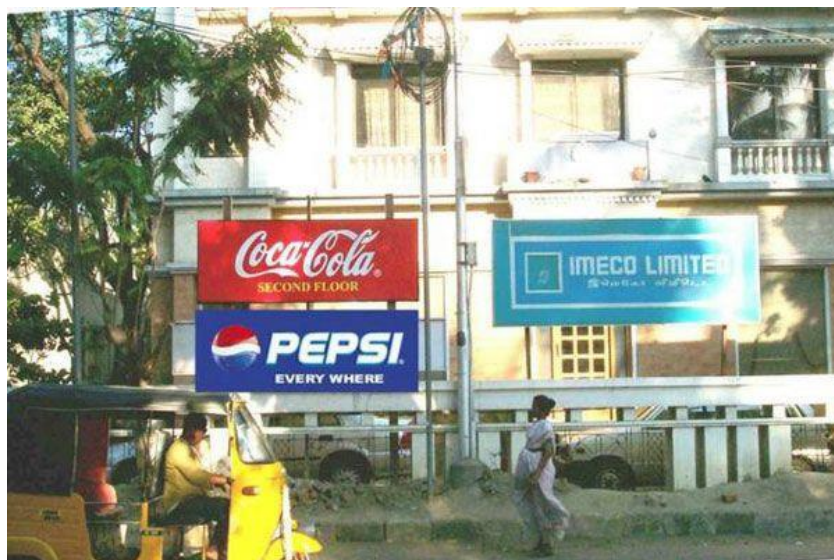
Slika 3: Rivalstvo Coca-Cole i Pepsija