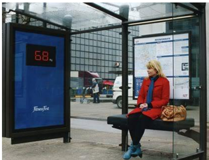
Slika 5: Primjer offline wait marketinga