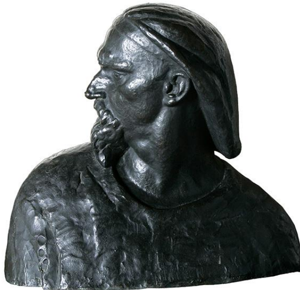
Slika 8. Autoportret Ivana Meštrovića, skulptura