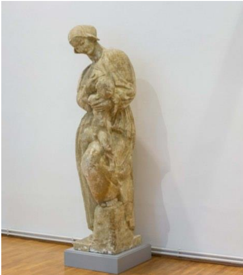
Slika 14. Majka doji dijete