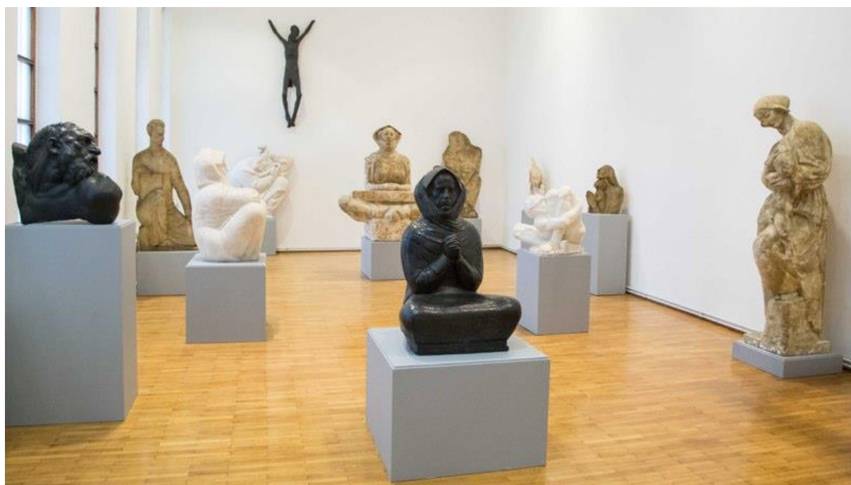
Slika 4. Stalni postav Spomen galerije Ivana Meštrovića u Vrpolju (1)