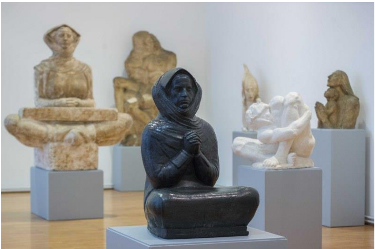
Slika 9. Djevojka u zanosu molitve, skulptura