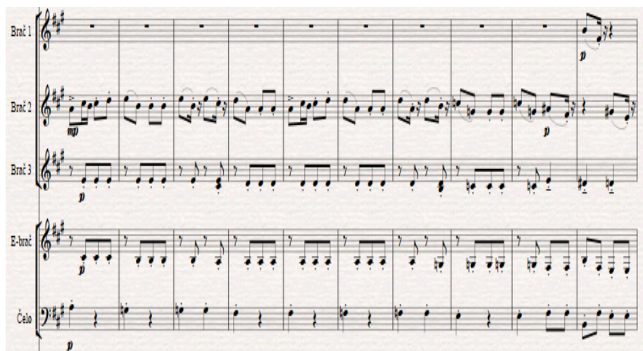
Slika 6. Detalj iz transkripcije (obratiti pozornost na dionicu čela)

Česta je upotreba sekundarnih dominanti te elipsastih rješenja.