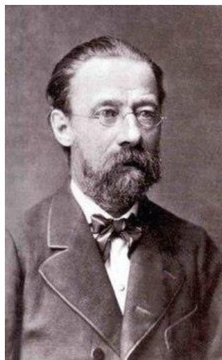
Slika 1. Bedřich Smetana

Bedřich Smetana (1824.-1884.) u češkom je narodu poznat kao utemeljitelj nacionalnog muzičkog smjera. Nakon nedovršenoga studija, u teškoj financijskoj situaciji, šalje skladbe Lisztu, koji je tada bio poznat kao dobročinitelj mladih talentiranih glazbenika. Neko vrijeme provodi u Švedskoj, a povratkom u Češku bavi se organiziranjem glazbenog života kao nastavnik, dirigent, glazbeni kritičar i kompozitor. Među najvažnijim djelima ističu se ciklus Simfonijskih pjesama Moja domovina ( Vltava kao najpoznatija pjesma ciklusa), te češka nacionalna opera Prodana nevjesta . U revolucionarnim zbivanjima 1848. godine u Pragu djeluje kao član Narodne garde, u uličnim borbama. Tada su nastale i njegove koračnice te rodoljubne pjesme kojima je poticao nacionalnu svijest svojih sunarodnjaka.