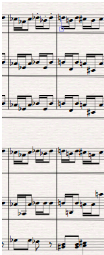
Slika 8. Detalj iz transkripcije

Imamo i kromatsku promjenu akorda gdje septakord es-g-b des postaje e-gis-h-d.