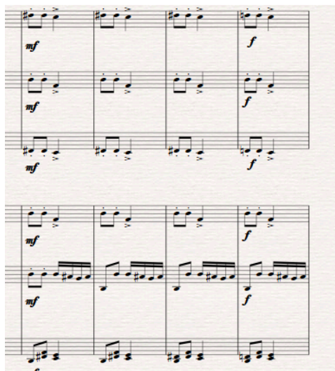
Slika 5. Detalj iz transkripcije

Harmonijski odnosi su najčešće paralelni (A-fis, cis-E). Odnos „svjetla“ i „tame“ prikazuje kroz kontrastni odnos izazvan mutacijama. Pr. 3. (169.-170.).