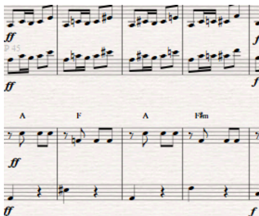
Slika 4. Detalj iz transkripcije (obratiti pozornost na harmonije)

Izmjena akorda udaljenih za malu i veliku tercu (ponavlja se i na drugim mjestima)