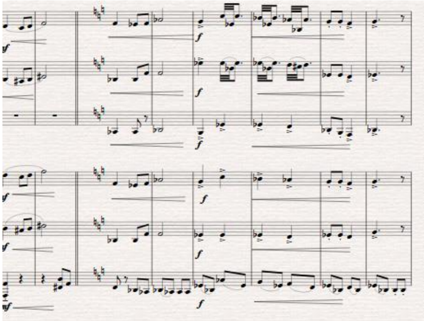
Slika 14. Detalj iz transkripcije

Primjer pokazuje različit zapis i različitu tehniku sviranja između violina i bisernica, no karakter bi uputom dirigenta trebao ostati isti.