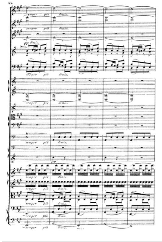
Slika 10. Originalna partitura

U nastavku je prikazano rješenje ovog problema: