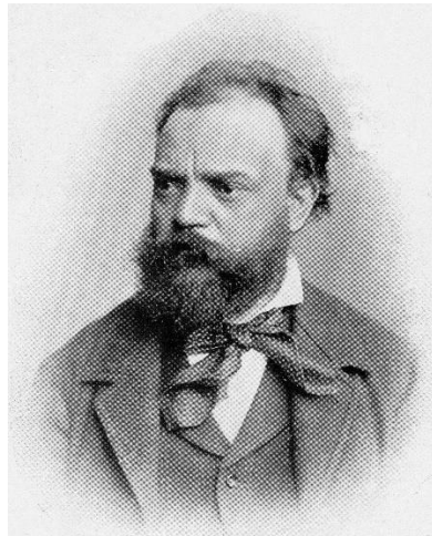
Slika 2. Antonin Dvořák