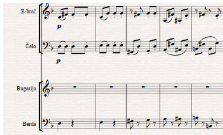
Slika 7. Detalj iz transkripcije (kromatika u basu)

Ples ne sadržava previše kromatike, ali se ona pojavljuje.