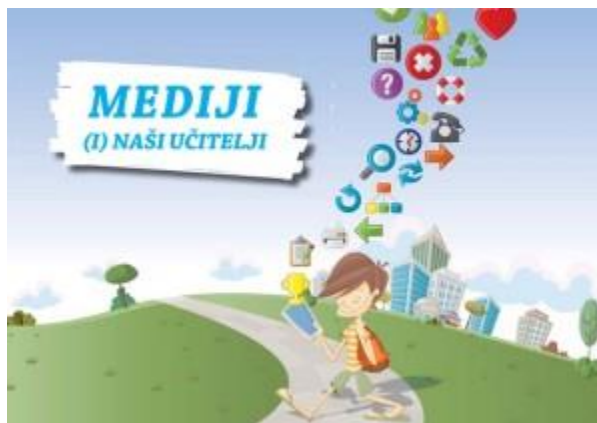
Slika 5. Brošura „Mediji (i) naši učitelji“