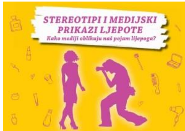
Slika 4. Brošura „Stereotipi i medijski prikazi ljepote: kako mediji oblikuju naš pojam lijepoga?

se vežu određeni načini ponašanja. Tako su recimo Afroamerikanci često prikazani kao ljudi nižeg društvenog statusa čija se djeca povezuju sa sportom ili glazbom. Latinoamerikanci se često povezuju sa nekim kriminalnim radnjama i ljepotom.