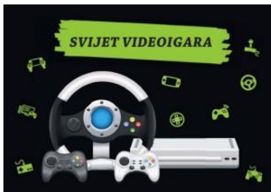
Slika 9. Brošura "Svijet videoigara"