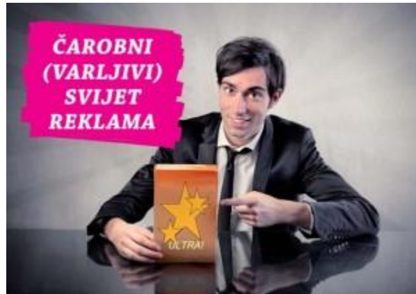
Slika 8. Brošura „Čarobni (varljivi) svijet reklama“