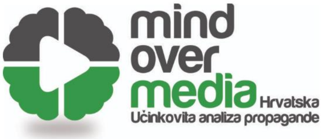
Slika 3. Mind Over Media