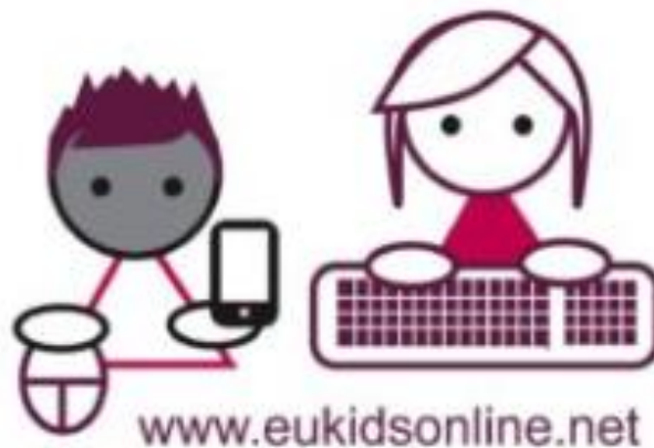
Slika 10. EU Kids Online

Koordinator istraživanja bilo je Društvo za komunikacijsku i medijsku kulturu, a glavni partneri su bili Agencija za elektroničke medije i Hrvatski Telekom. Ostali partneri bili su OŠ Većeslava Holjevca (Grad Zagreb), Hrvatska regulatorna agencija za mrežne djelatnosti te Centar za nestalu i zlostavljano djecu. Projekt su podržali i Ministarstvo znanosti i obrazovanja, Ministarstvo za demografiju, obitelj, mlade i socijalnu politiku i Grad Zagreb, Ured za obrazovanje, kulturu i sport.