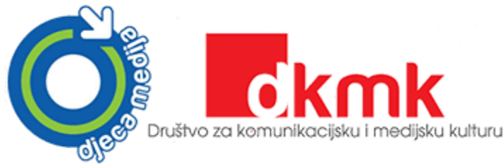
Slika 2. Logo Djeca medija i Društva za komunikacijsku i medijsku kulturu