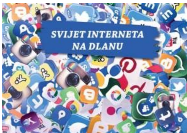
Slika 7. Brošura „Svijet interneta na dlanu“