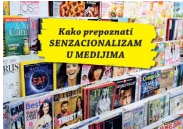
Slika 6. Brošura „Kako prepoznati senzacionalizam u medijima?“