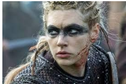
Slika VII. Vikinški stilizirani war paint