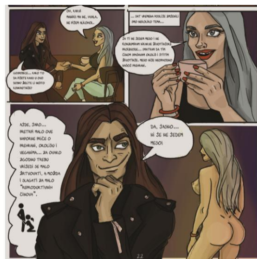
Slika XI. finalizirana tabla 16, Čelična čipka