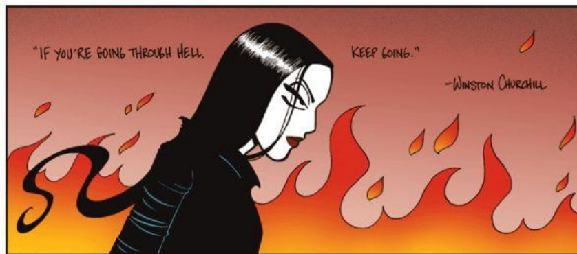
Slika VIII. Lise Myhre, fragment iz strip serijala Nemi , 2010.

Lise Myhre također je ilustrirala pjesme Edgara Allana Poea i Andréa Bjerkea.