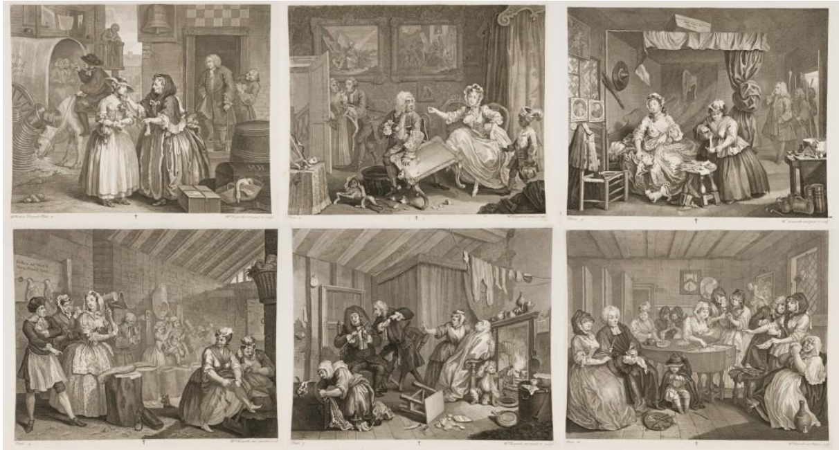
Slika II. William Hogarth, Život bludnice , 18. stoljeće

Ako ćemo pomno sagledati povijest, prvi koji se svojim ilustracijama najviše približio modernom stripu jest William Hogarth ( 1697. - 1764. ) koji je tekst i sliku objedinio u jedinstvenu cjelinu. Riječ je o seriji šest narativnih slika Život bludnice u kojima tadašnjim humorom i stilom opisuje život kurtizana.