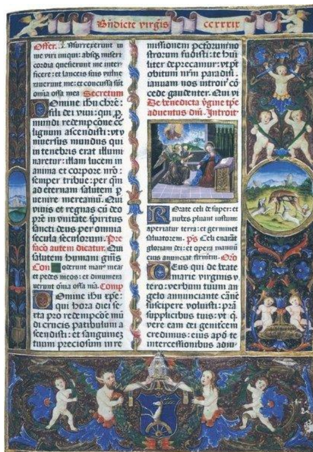
Slika I. Iluminacija, Misal Jurja Topuskoga, 16. stoljeće

Iskonska potreba čovjeka, bila je da crtežom oslikava svoje želje i iskustva. Kao što sam već spomenula, prve protostripove možemo naći kod Sumerana, Egipćana, antičkih Grka i Rimljana koji nam prikazuju razne mitologije, legende, ili prikaze iz svakodnevnog života. Kasnije, u srednjem vijeku, možemo tragove stripa naći u iluminacijama koje svojim kadriranim ornamentima, slikama i tekstovima imaju nekakvu poveznicu s današnjim stripom.