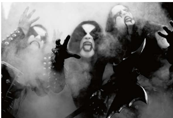
Slika V. Norveški black metal bend Immortal , 2003.