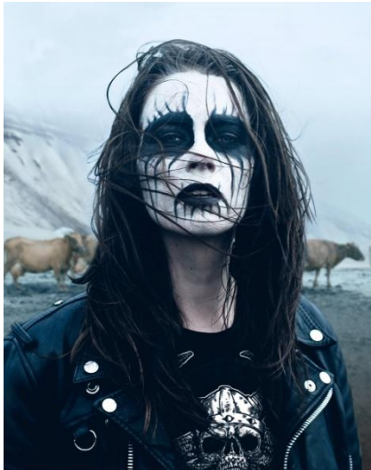
Slika VI. Corpse paint

Veliki utjecaj na strip, imao je i izgled black metalaca. Glavno, prepoznatljivo obilježje jest šminka, koja se sastoji od bojenja lica u bijelo i crno čime se postiže ekstreman, demonski izgled. Kontroverzan naziv tog stila šminkanja je Corpse paint . Budući da žanr potječe iz Norveške, corpse paint ima veliko poveznicu s vikinškim war paint om te načinom na koji su njihovi šamani pepelom bojali lice prije bitke ili rituala.