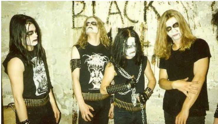
Slika IV. Norveški black metal bend Mayhem , 1992.

Black metal je podvrsta metala, obilježena kao veoma ekstremni glazbeni izričaj i čudna, neuobičajena struktura skladbe. Tematski je najčešće okrenut sotonizmu, bijesu ili depresiji, paganizmu i fantastičnim knjigama J. R. R. Tolkiena . Teme najčešće nisu međusobno miješane, već ovisi o samome bendu i njihovim glavnim utjecajima. Kao glazbeni žanr, prepoznatljiv je po brzom, apokaliptičnom ritmu i grozničavim, vrištećim vokalima.