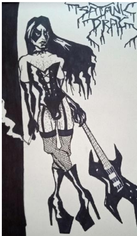
Slika III. Početni dizajn lika za strip album Čelična Čipka , 2019.

Prva ideja je bila ovjekovječiti heroja prvog stripa kojeg sam radila, muškarca koji voli nositi žensko donje rublje. Nakon toga, odlučila sam spojiti navedenog lika u današnji svijet koji je jako kontradiktoran, jer nam daje slobodu u našem izričaju onoga što jesmo, a istovremeno nas ograničava zbog velikih predrasuda prema svakoj sitnici koja odstupa od nekakvih poželjnih socioloških normi. Od malena smo učeni banalnim pravilima koja moramo slijediti kako bismo dokazali vlastiti spol koji prate određene stigme; djevojčice vole nositi ružičasto, a dječaci ne plaču. Učeni smo sramoti prema vlastitome tijelu.