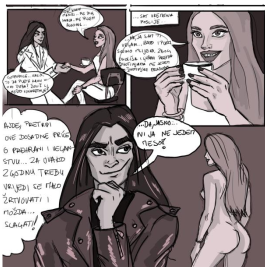
Slika X. skica table 16, Čelična čipka

U početku same izrade, odlučila sam raditi strip tradicionalnom tehnikom, odnosno tušem, bez dodatnih boja. Međutim, vrlo brzo sam shvatila da sama priroda tuša nije previše pogodna za nekakve velike korekcije, a vrijeme koje imam za sam rad je ograničeno. Kako ne bih sama sebi previše komplicirala izradu, prebacila sam svoj rad na digitalni medij, Photoshop . Što se tiče samih tehnika, tradicionalna i digitalna tehnika imaju svoje prednosti i mane. Kod tradicionalnih crtačkih i slikarskih tehnika imamo bolju kontrolu poteza i nanošenja količine tuša ili boje te uz to imamo prisutnu i taktilnu stranu rada. S druge strane, tradicionalne tehnike zahtijevaju dugotrajniji proces izrade, a greške su većinom nepopravljive. Digitalne tehnike, kao što je Photoshop , rade na principu kolaža, jer nam omogućuju da svaku novu stavku na istome papiru radimo u zasebnom, odnosno novom layeru . Samim time korekcije su znatno brže i jednostavnije, ali, s druge strane, kontrola poteza je puno zahtjevnija te se gubi taktilno osjetilo, koje je postojeće kod tradicionalnih crtački i slikarskih tehnika. Nakon odabira tehnike, počela sam raditi strip brzim skicama, koje sam kasnije temeljito tuširala, ali ipak sam ostavila vidljive tragove skica kako bi crtež djelovao slobodnije. Sljedeća stavka, bilo je bojanje pozadina u svim tablama, a kao zadnju stavku ostavila sam koloriranje i sjenčanje.