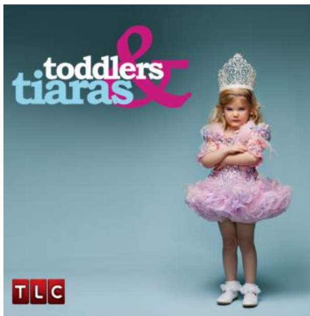
Slika 7. „Toddlers & Tiaras“, natjecateljska emisija izbora ljepote za djecu

Na kraju postavlja se pitanje direktne odgovornosti samih medija i zakona o medijima. Treba li možda prioritete rejtinga gledanosti pojedinih sadržaja, kojima se rukovode posebice komercijalni mediji u svrhu uspješnosti njihovog marketinškog trženja, svesti pod preciznije i jasnije definirane kriterije što zakonski može biti dopušteno, a što ne? (Hromadžić 2010, 626).