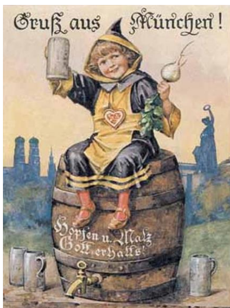
Slika 2. Duhovita razglednica Minhenskog djeteta (Münchner Kindl)