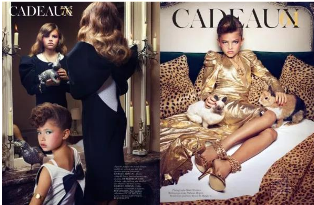
Slika 4. Modni editorijal seksualiziranih djevojčica u magazinu Vogue