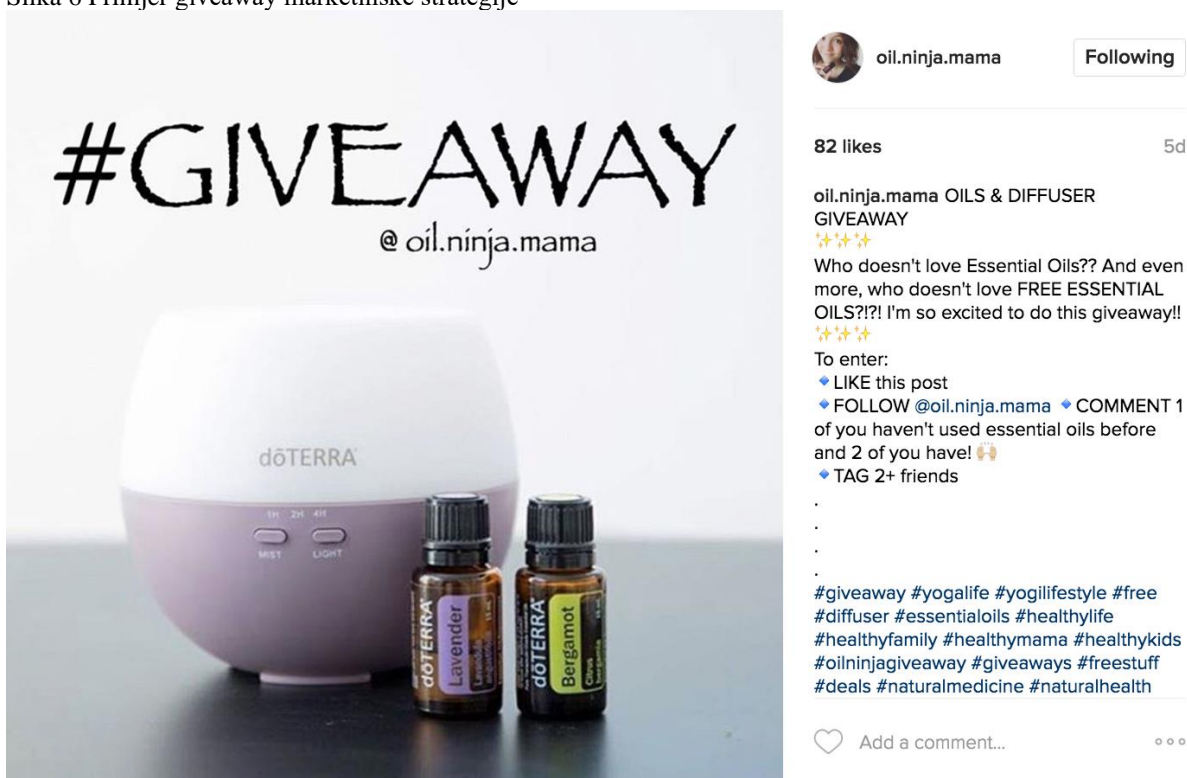
Slika 6 Primjer giveaway marketinške strategije

Giveaway je jedan od novih uspješnih oblika gerilskog marketinga koji je sve popularniji na društvenim mrežama. Da bi sudjelovali u giveawayu korisnici društvenih mreža često moraju informacije o proizvodu podijeliti sa svojim prijateljima i početi pratiti tvrtku koja omogućuje giveaway. Upravo stoga tvrtka stvara veliki pool novih pratitelja gdje može dalje dijeliti promidžbene materijale. Tako se i pokazuje kvaliteta proizvoda te stvara pozitivan odnos između potrošača i poduzeća.