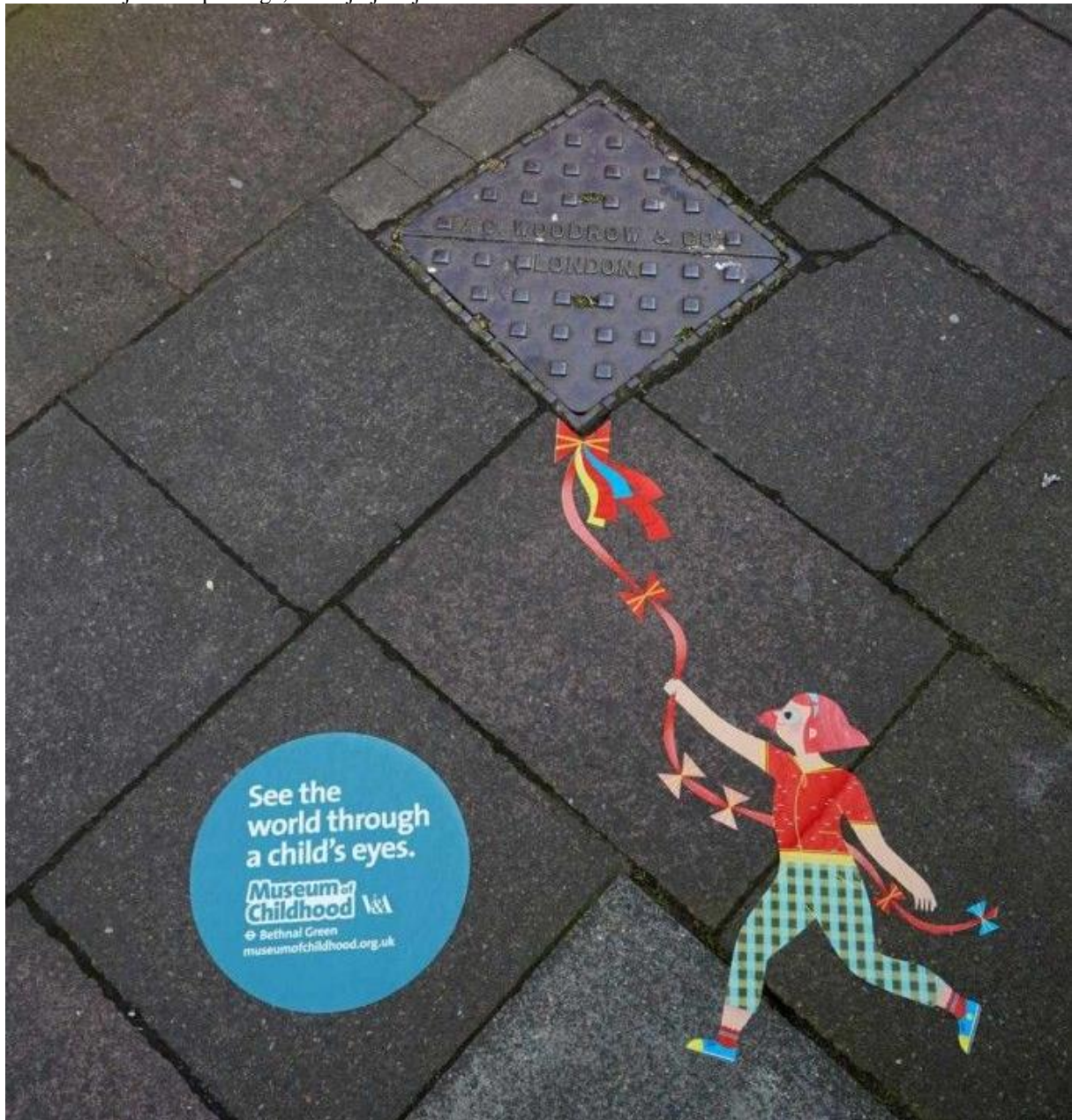
Slika 5 Primjer wild postinga, Muzej djetinjstva