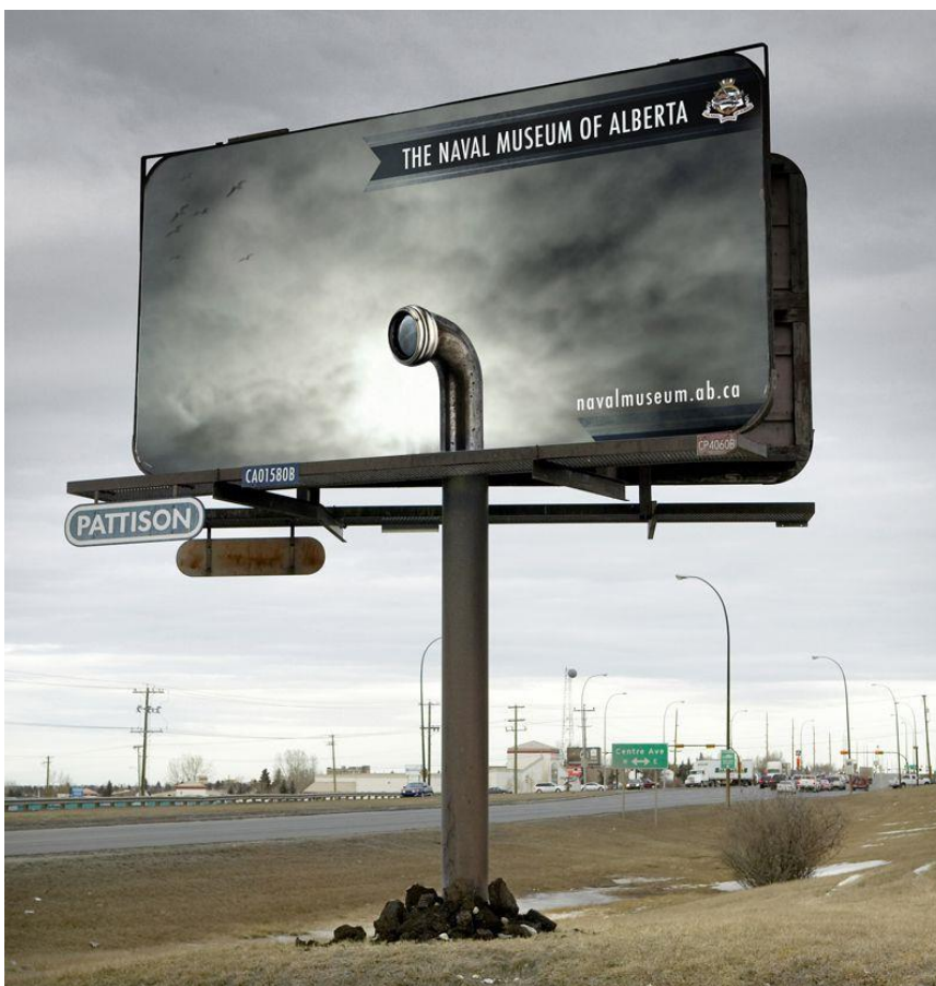
Slika 8 Bilboard mornaričkog muzeja Alberta, SAD

U gerila marketingu koriste se brojni mediji za prenošenje željenih informacija (Levinson, 2013 ). Bilboardi na jednostavan način privlače pozornost ljudi na tvrtku te omogućavaju široj masi upoznavanje s proizvodom ili brendom. Ipak, jumbo plakati imaju puno mana. Danas su možda pretjerano korišteni pa samo oni vrhunsko izvedeni i drugačiji od drugih uspijevaju zaokupiti pažnju pojedinaca. Za dobar dizajn i jasnu, zanimljivu poruku mora biti odgovoran marketinški tim. Glavni cilj plakata ne može biti ostvarenje bolje prodaje, no oni mogu podsjetiti ljude na brend, odnosno proizvod. Ukoliko je plakat dobro dizajniran i efektan zasigurno će privući pažnju potrošača.