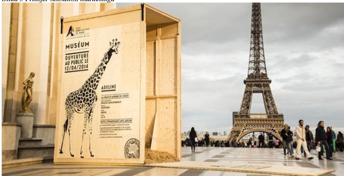
Slika 3 Primjer sensation marketinga