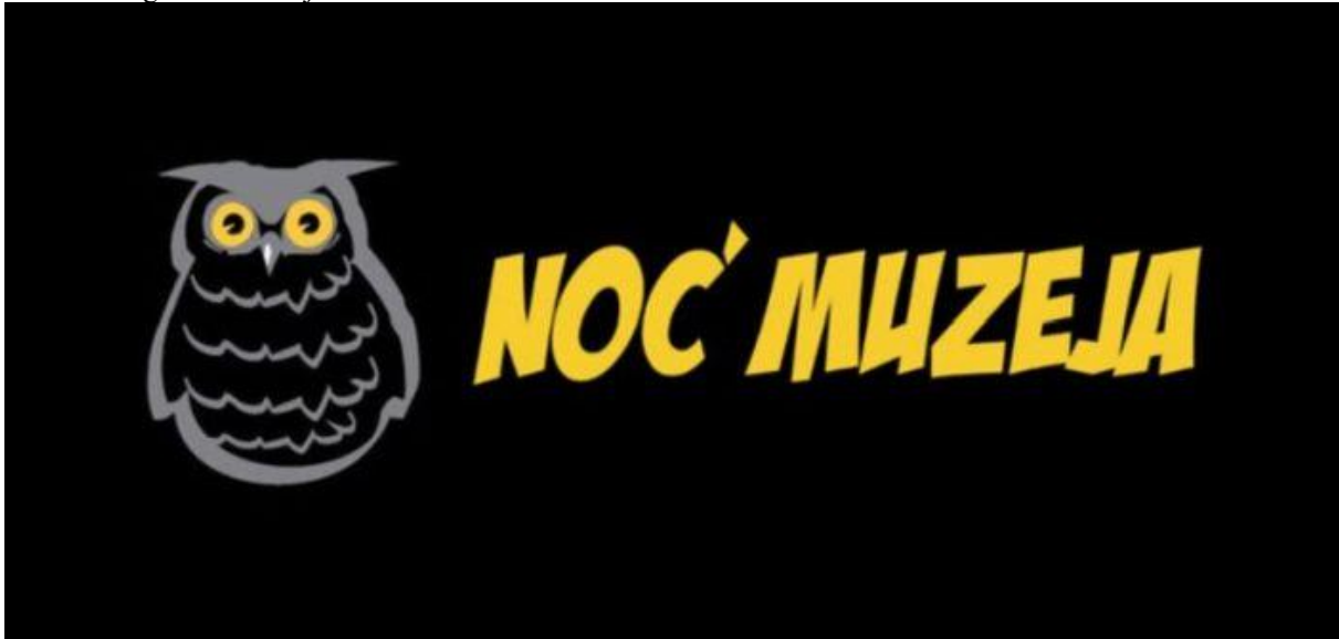
Slika 12 Logo noći Muzeja