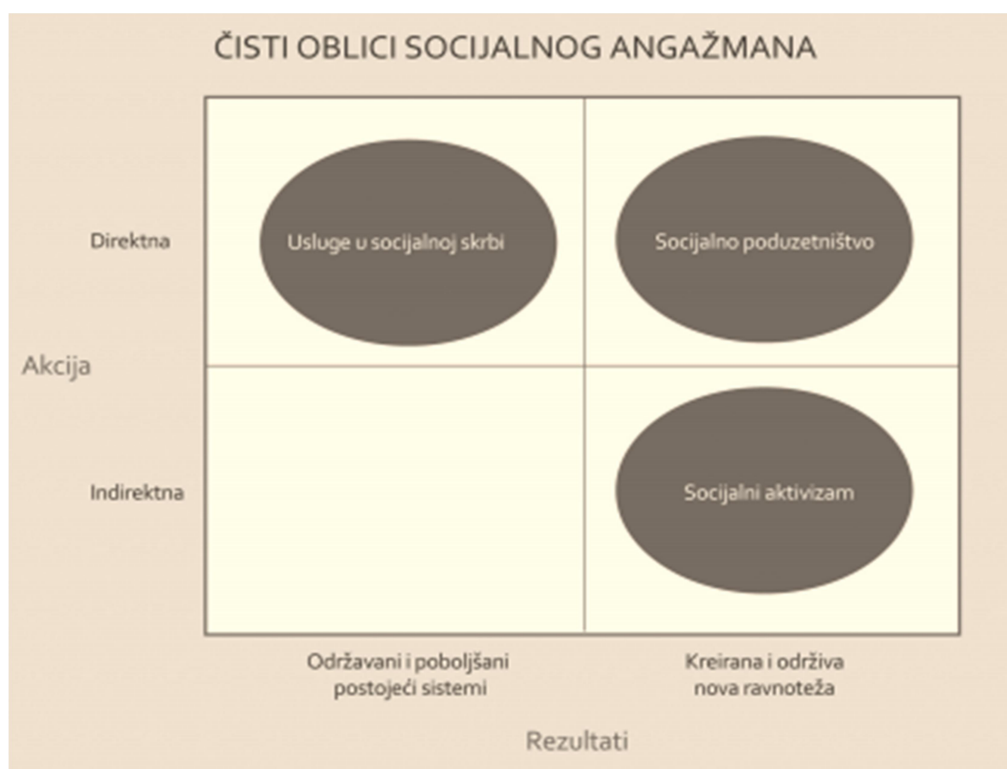
Grafikon 1. Čisti oblici socijalnog angažmana