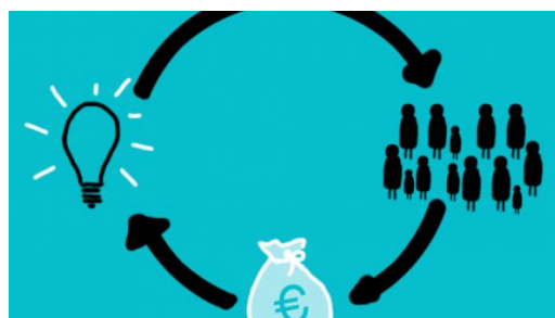
Slika 2. Ilustrativni primjer funkcioniranja crowdfundinga

Nedostaci, tj. rizici koji se vežu uz crowdfunding su: mogućnost prijevare i pranja novca, povećana odgovornost, nepostojanje sekundarnog tržišta, nepristupanje tradicionalnom pristupu, rizik stvaranja konkurencije jer su sve ideje i projekti vidljivo javno. Svi navedeni nedostaci i dalje imaju mjesta za napredak u razvoju crowdfundinga. (Šain, Bjelić i Josić, 2019:384-385)