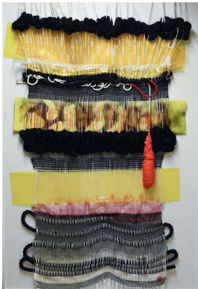
Slika 4: Desire Moheb- Zandi, Blistavi snovi , 2016.

Kipar, plesač i performer, koji ima iznimno svestran opus, američki je umjetnik Nick Cave koji koristi razne materijale poput kose i grančica do kristala duginih boja (slika 5). U konceptualnom smislu njegove skulpture imaju i aktivističku ulogu budući da se referiraju na rasnu nepravdu. (O'Grady, 2019) Njegov najveći umjetnički projekt pod nazivom Dok bio je izložen u galeriji suvremene umjetnosti Momentary u Bentonvilleu. Svojim skulpturama velikih dimenzija želi potaknuti kritičku raspravu o stanju i problemima u suvremenoj Americi.