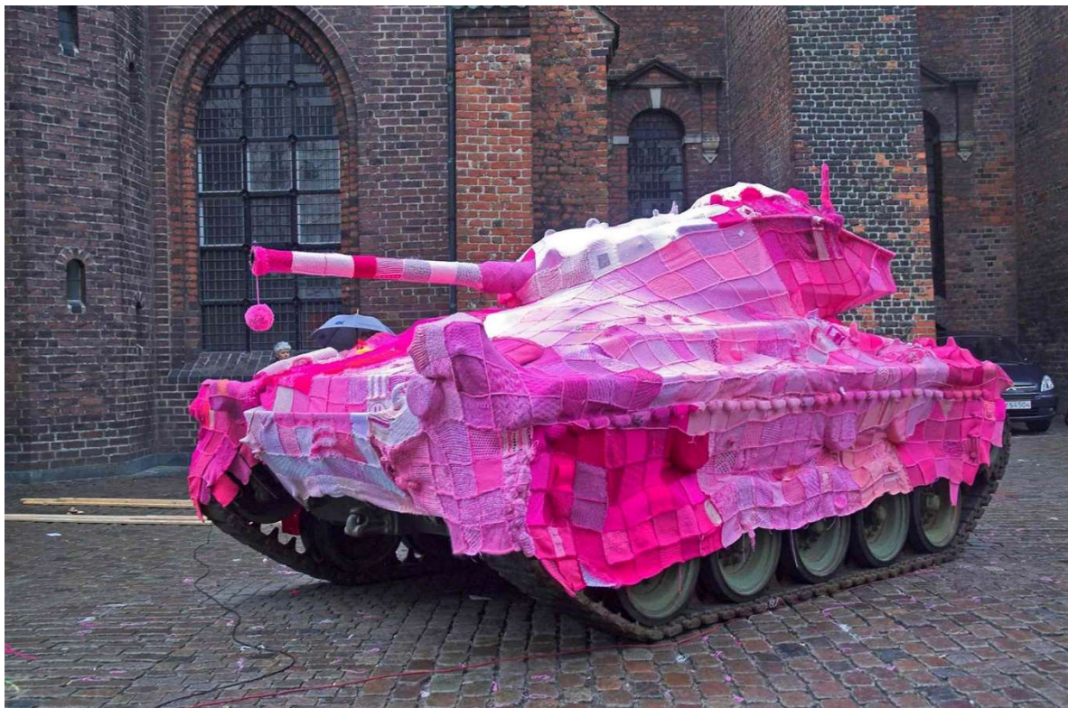
Slika 1: Marianne Jørgensen, Ružičasti tenk , 2006.

umjetnosti, zadnjih godina dolaze na vidjelo i to u likovnoj i aktivističkoj formi. Također, još neke od važnih poruka koje ovi umjetnici često šalju jesu borba za zaštitu okoliša, antirasističke poruke, antiratne poruke i pitanja socijalne pravde. Jedan od umjetnika je, na primjer, danska umjetnica Marianne Jørgensen i njen rad Ružičasti tenk koji je nastao kao oblik protesta na rat u Iraku (slika 1). Tenk iz Drugog svjetskog rata bio je prekriven s više od 4000 kukičanih kvadrata koje su pleli i volonteri iz nekoliko zemalja (Davidson, 2020). S obzirom na to da pletenje signalizira dom i da ima meditativan učinak na osobu koja plete i kukiča, upravo ovaj kontrast ima aktivističku ulogu i jasnu poruku.