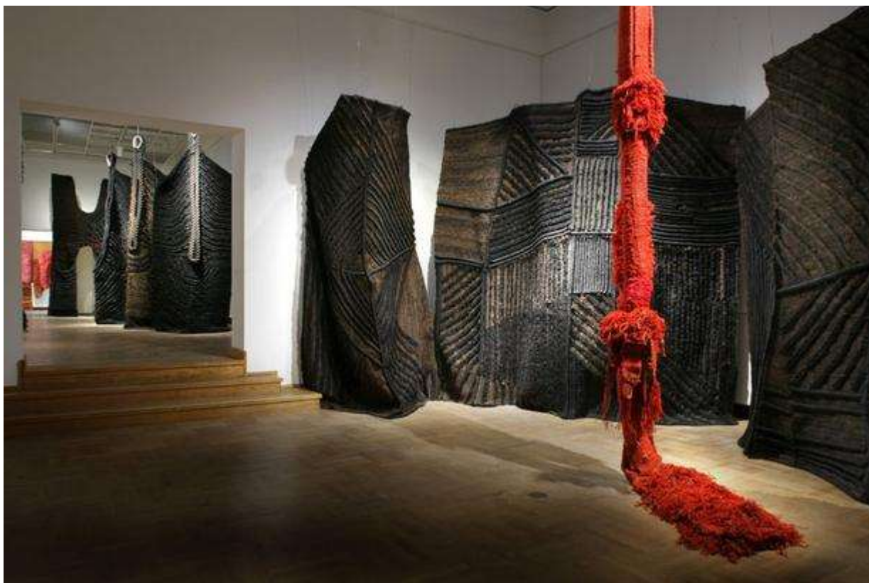
Slika 6: Postav izložbe Jagode Buić, Retrospektiva, u Muzeju za umjetnost i obrt, 2010.

U svom tekstu o tapiseriji 1966. godine Buić piše: „Tkalačko umijeće ima neograničene mogućnosti kombiniranja prediva i istraživanje u tom području još nije završeno. To se tisućljetno iskustvo savršeno odražava u suvremenom stvaralaštvu te nema nikakva razloga da se na tome stane... Umjetniku naposljetku preostaje tek dijalog s osnovom i potkom - tkanje prošlosti, stvaranje sadašnjosti i vizija budućnosti...” (Buić, 1966.)