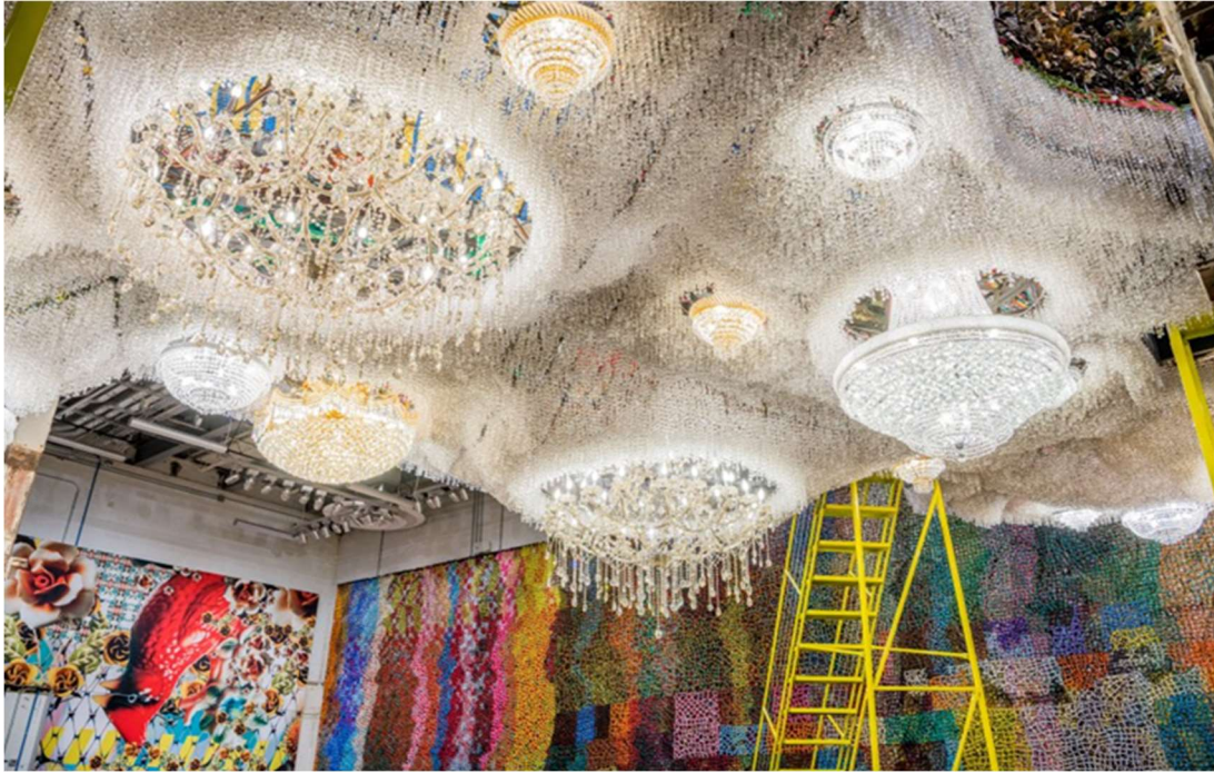
Slika 5: Nick Cave, Dok , 2016.

Hrvatska se može pohvaliti izuzetno uspješnim i poznatim tekstilnim vizualnim umjetnicama koje su doživjele svjetsko priznanje. Jedna od njih je Jagoda Buić, svjetski priznata umjetnica i kostimografkinja koja je svoje monumentalne tekstilne instalacije izlagala po cijelom svijetu (slika 6). Umjetnica uspostavlja tapiseriju kao nov, samostalan umjetnički izraz. Kustos Miroslav Gašparović piše: „Pripremiti retrospektivnu izložbu svestranoj umjetnici kakva je Jagoda Buić gotovo da bi se moglo proglasiti "nemogućom misijom". Njezin opus je toliko velik, raznovrstan, raznorodan i rasut po mnogim svjetskim muzejima i privatnim zbirkama da je doista nemoguće predstaviti sve što bi "moralo" biti zastupljeno na takvoj izložbi." (Gašparović, 2010)