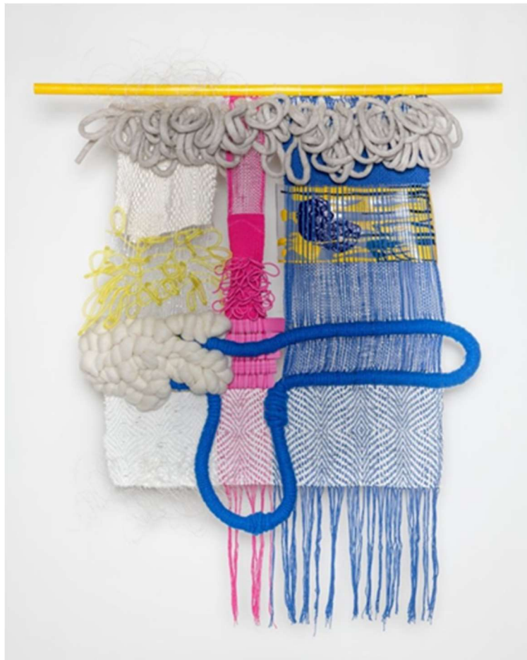
Slika 3: Desire Moheb- Zandi, Rijeka , 2019.

Kroz osobno umjetničko istraživanje istaknuo se rad njemačke umjetnice Desire Moheb- Zandi zbog poistovjećivanja s umjetničnim odabirom boja i tretiranjem tekstila. Ona svoju osobnu povijest i kulturni identitet integrira u svoje skulpturalne tapiserije te crpi inspiraciju iz sjećanja na svoje djetinjstvo u Turskoj gdje je promatrala svoju baku kako tka na razboju (slika 3 i 4). Moheb-Zandi povezuje tradicionalne tehnike s modernim motivima i medijima. Njezine tapiserije uključene su u različite izložbe feminističkih grupa u New Yorku. (Hahn, 2017)