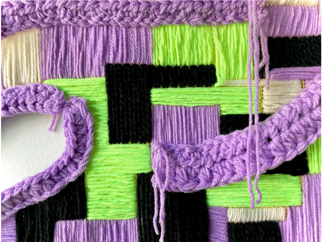
Slika 11: Detalj završnog rada