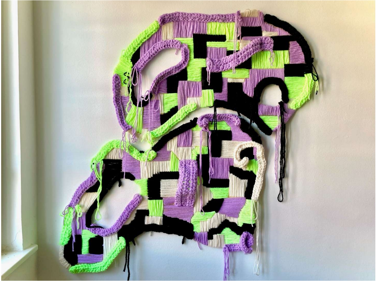
Slika 10: Završni rad, 107cm x 117 cm