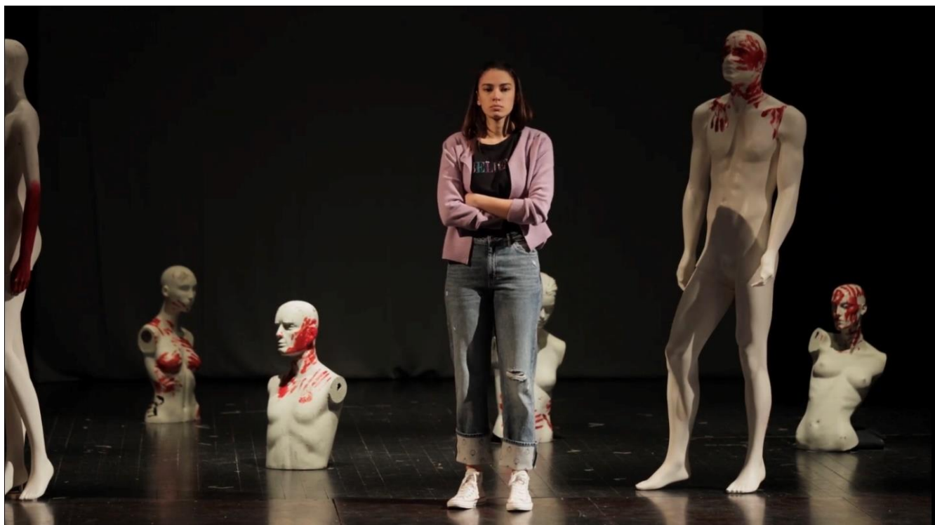
Slika 5. Lutke