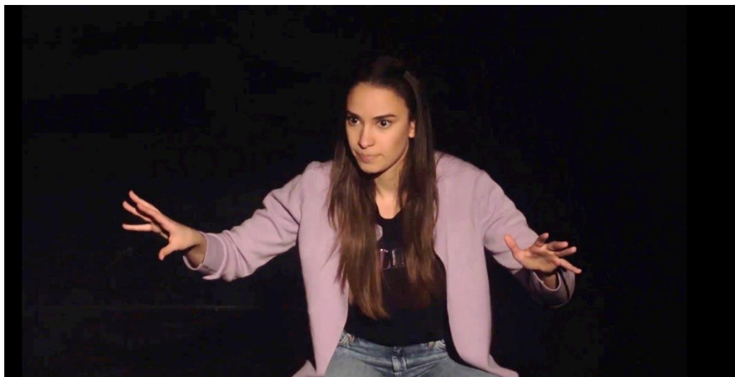
Slika 4. Plan

Kako bih bolje razumjela arhetip štreberice potražila sam neke druge likove koji dijele slične osobine i karakteristike.