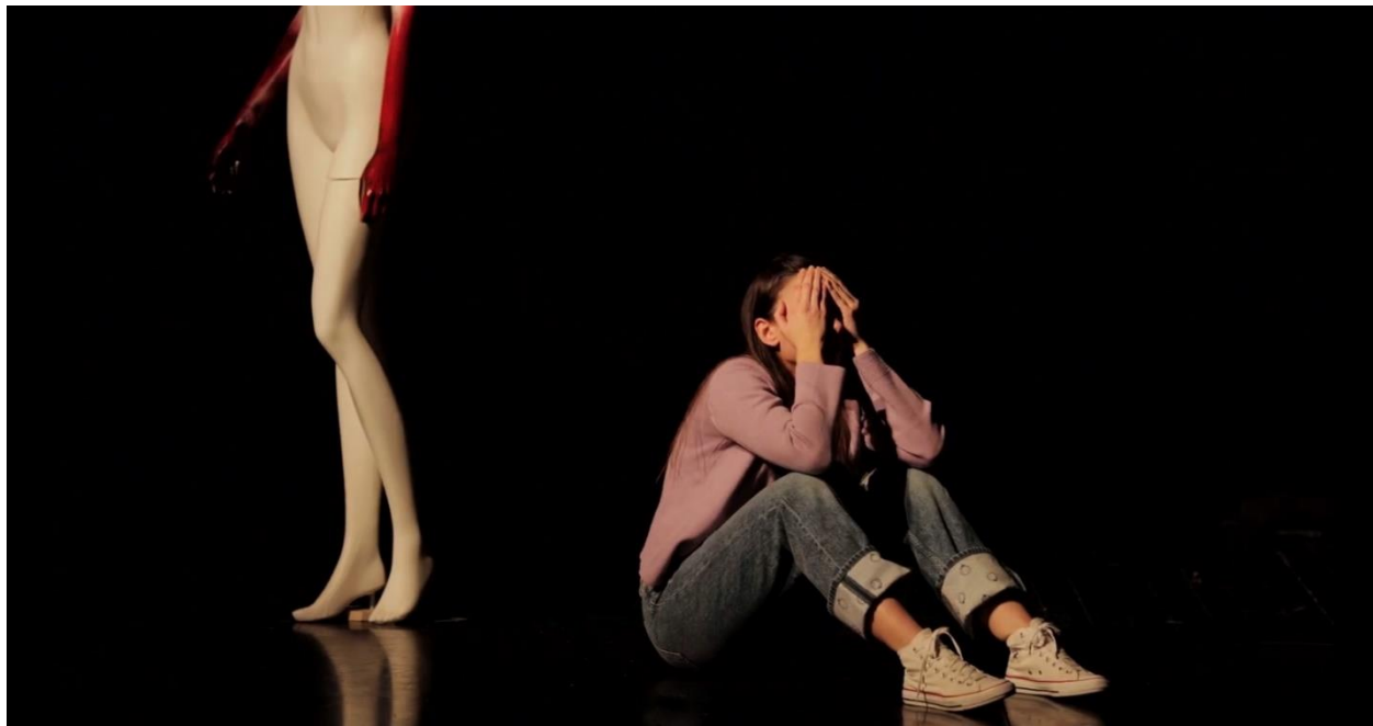
Slika 2. Mučnina

U ovakvim je komadima lako otići u patetiku što nipošto nisam htjela. Lako je izdramatizirati sve što se Luciji događa i to tako igrati. To zapravo ne bi bilo ni točno jer bi to bilo viđenje nekoga sa strane tko gleda Lucijin život, ona te stvari sigurno više ne doživljava tako. Postale su joj toliko normalne da ih priča kao nešto sasvim uobičajeno. To se često događa sa žrtvama nasilja koje svoje priče pričaju s nevjerojatnim odmakom koji ledi krv u žilama. Lucijin slučaj nije toliko