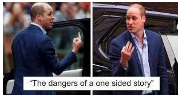
Slika 2 Opasnost od slušanja samo jedne strane priče

Fotografija iznad prikazuje kako se različitim kutom fotografiranja može promijeniti cijeli kontekst fotografije i izmanipulirati publika. Prva nam fotografija pokazuje kako čovjek pokazuje „prosti prst“ nekome izvan kadra, dok nam druga fotografija pokazuje ipak malo drugačiju priču.