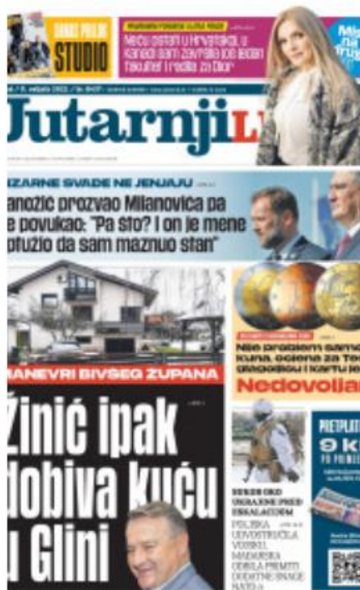
Slika 1 Naslovnica Jutarnjeg lista, veljača 2022.

„Fotografija u novinama vizuelno podržava tekst, nudeći dodatne informacije i privlačeci pažnju čitaoca/ čitateljice.“ (Isanović, 2007: 38)