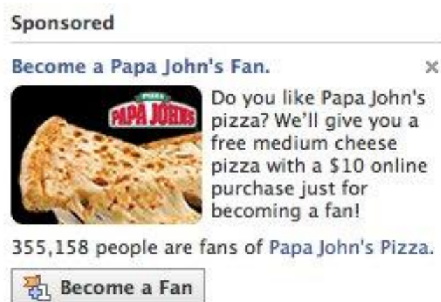
Slika 3. Papa John's promotivna kampanja