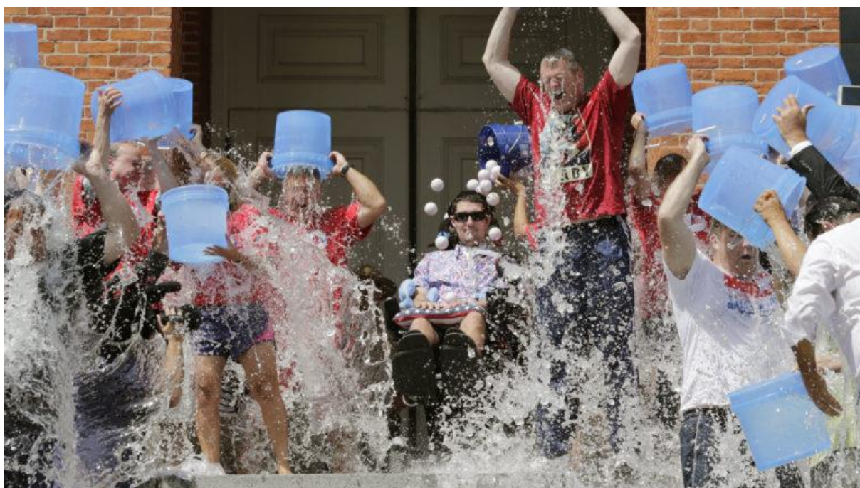
Slika 1. "ALS Ice Bucket Challenge" promotivna kampanja

Postoji mnoštvo primjera uspješnih kampanji viralnog marketinga. Jedan od najpoznatijih i najpopularnijih je „ALS Ice Bucket Challenge“. Pokrenut kao kampanja za podizanje svijesti o amiotrofičnoj lateralnoj sklerozi (ALS), teškoj neurološkoj bolesti koja se manifestira pogoršanjem motoričkih vještina pacijenta. Glavna ideja kampanje je bila da osoba koja prihvati izazov mora snimiti i podijeliti na društvenim mrežama video gdje sebe polijevaju kantom ledeno hladne vode. Nakon toga osoba koja je odradila izazov ima pravo javno nominirati bilo koju drugu osobu da napravi isto i također podijeli na društvenoj mreži i izazove nekog trećeg. Tu su najviši učinak imale poznate osobe od kojih je mnoštvo odradilo izazov i predložilo neku drugu poznatu osobu da ga prihvati. Kao alternativu odradi izazova, izazvana osoba mora donirati novac udruženju oboljelih od ALS-a. Kampanja je postala viralna i u nju su se uključili milijuni ljudi diljem svijeta, bilo odrađivanjem izazova ili dijeljenjem sadržaja vezanog uz njega. Bila je pokrenuta 2014. godine i tada je je bilo gotovo nemoguće izbjeći na društvenim mrežama. Prikupila je čak 115 milijuna dolara i gotovo utrostručila godišnja ulaganja u istraživanje bolesti (ALS Association, 2019.).