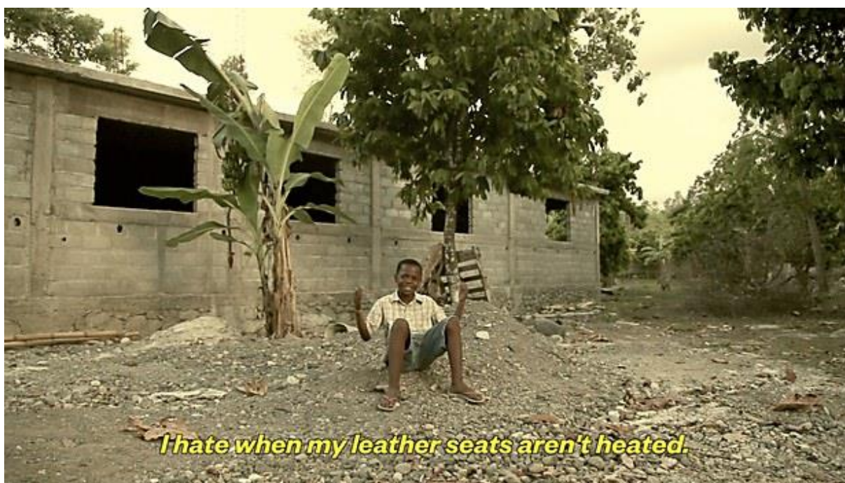
Slika 5. Kadar iz videa First World Problems Anthem

prikazuje djecu i osoblje sirotišta koji žive u nehumanim uvjetima dok istovremeno govore, primjerice, kako ne vole kada im je kuća toliko velika da im trebaju dva routera ili kako im smeta kada im kožna sjedala nisu grijana (YouTube, 2021.). Smisao ovoga je prikazati kontrast između visokog životnog standarda i uvjeta ljudi koji žive u tzv. zemljama prvog svijeta i siromaštva i svakodnevne borbe za preživljavanje s kojom se suočavaju mnogi ljudi u zemljama trećeg svijeta. Stoga je organizacija kreirala svoj hashtag naziva #HelpSolveRealProblems kako bi bar privremeno zamijenio onaj drugačije konotacije #FirstWorldProblems. Tako je kampanja i dobila naziv „Hashtag Killer“. Cilj ovog oglasa bio potaknuti ljude na akciju u vidu doniranja novca organizaciji koja, kao što je ranije spomenuto, osigurava pristup pitkoj vodi siromašnima.