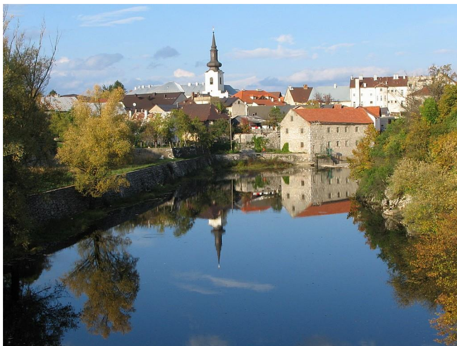
Slika 5. Tipična veduta grada Gospića danas

te šetnice i mjesto zadržavanja šetača i stanovništva. Pogled s novog mosta 8 na mlin čini i jednu od najprepoznatljivijih veduta grada. Veduta s pogledom na mlin nalazi se na stranicama Wikipedije pod pojmom „Gospić“, na lokalnim razglednicama, na mnogobrojnim društvenim mrežama (Facebook, Instagram i td.) te je danas prepoznatljiva slika kojom se definira izgled Gospića u očima njegovih posjetitelja. Početnog manjeg prostornog kapaciteta, s vremenom je proširivan. O promjenama koje su se događale sa samim objektom tijekom vremena više u nastavku poglavlja.