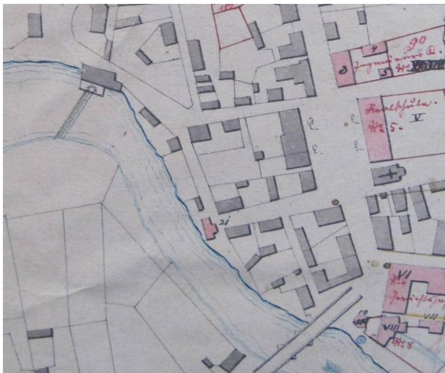
Slika 2. Murkovićev mlin na regulacijskoj osnovi 1874. godine, u gornjem lijevom uglu