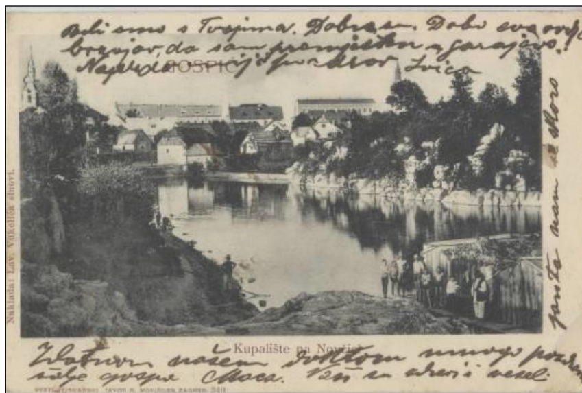
Slika 11. Drveno kupalište zvano „kerep“ na Novčici pokraj mlina 1905. godine.

građana, a sve do danas zadržana je ideja kao i želja da se na njenoj obali realiziraju ne samo šetalište, već i drugi sadržaji. Ovisno o događanjima i u slučaju velikog prometa preko (u 19. stoljeću jedinog) Starog mosta građani su koristili bent (ustavu) uz mlin kao prijelaz preko rijeke.