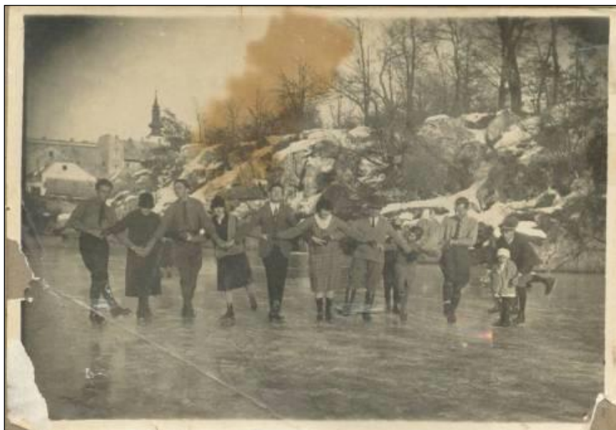
Slika 12. Klizanje ispred Murkovićeve mlina 1926. godine.