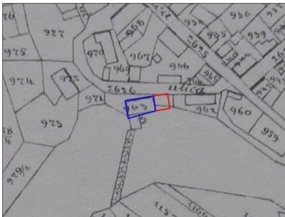
Slika 3. Tlocrt mlina na reambulaciji iz 1896.