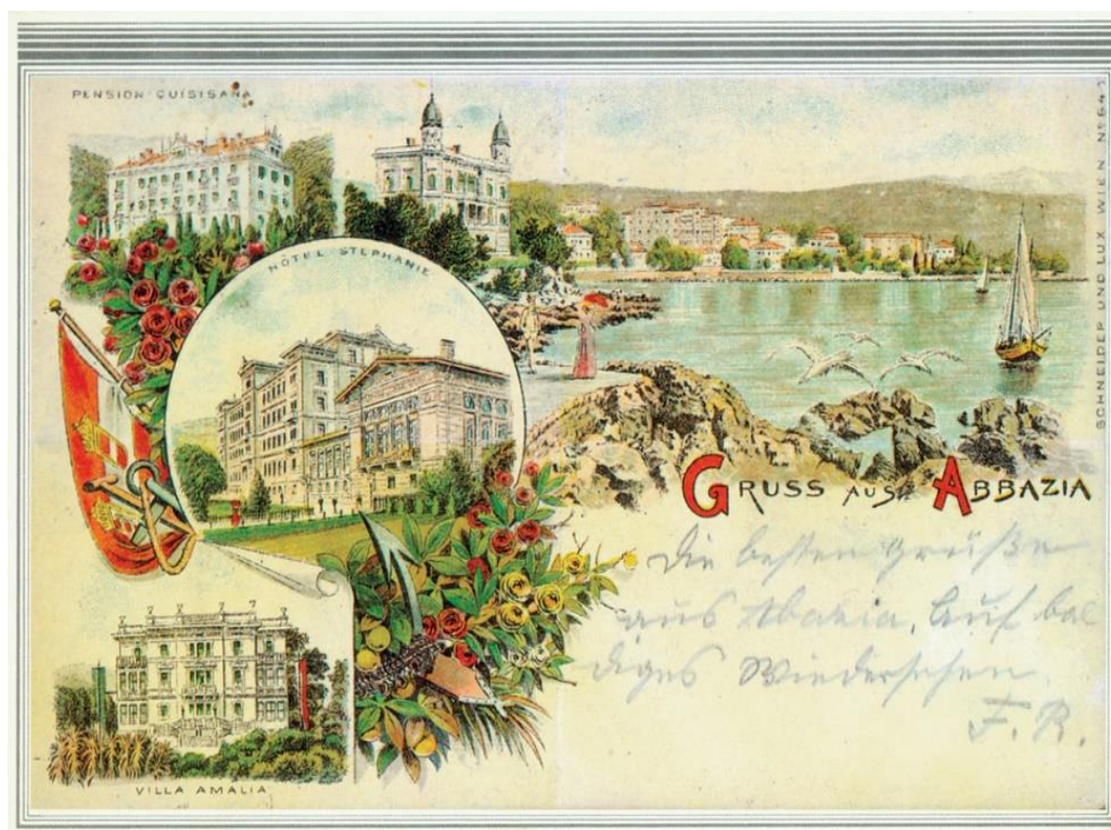
Slika 1. Opatija u počecima turizma u Hrvatskoj.

U razdoblju od sredine 19. stoljeća pa do I. svjetskog rata grade se ceste, željezničke pruge te se uvode brodske linije na Jadranskom moru. Otvaraju se i prvi hoteli (u Opatiji Villa Angiolina 1844. i Kvarner 1884.), pišu se prvi turistički vodiči (o Poreču i o Puli 1845.), organiziraju se prva istraživačka putovanja na Velebit i na jadransku obalu, primorska mjesta na Kvarneru postaju središtima zdravstvenog turizma. Prva turistička društva osnivaju se u Krku 1866. i na Hvaru 1868. godine.