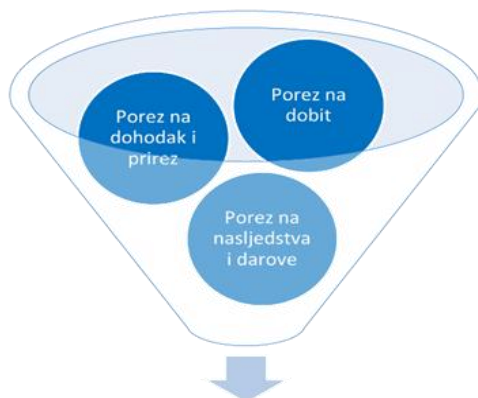
Slika 2 Izravni porezi u Republici Hrvatskoj