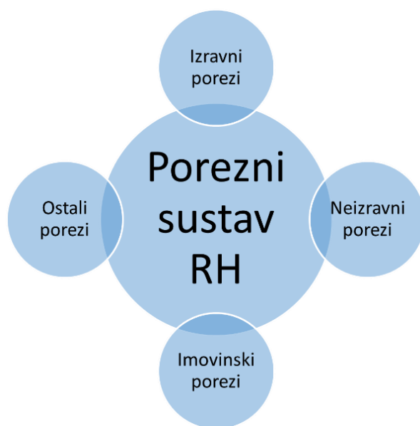
Slika 1 Porezni sustav u republici Hrvatskoj