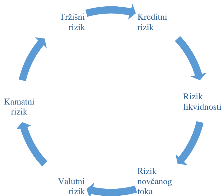
Slika 3 - Financijski rizici