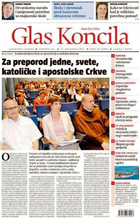
Slika 3