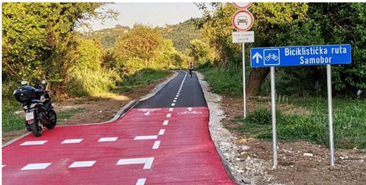
Slika 11 Biciklistička staza Samobor - Sv. Nedelja