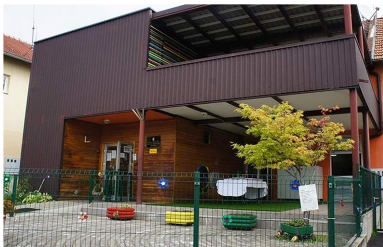
Slika 12 Opremanje Dječjeg vrtića "Grigor Vitez" Galgovo