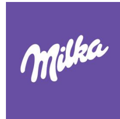
Logo Milke 1

Prvu čokoladu Milka napravio je švicarski slastičar Phillippe Suchard 1901. godine, dok je današnji vlasnik licence međunarodni koncern Kraft Foods. Ime Milka je složenica prvih nekoliko slova dviju riječi: MILch i KAKao.