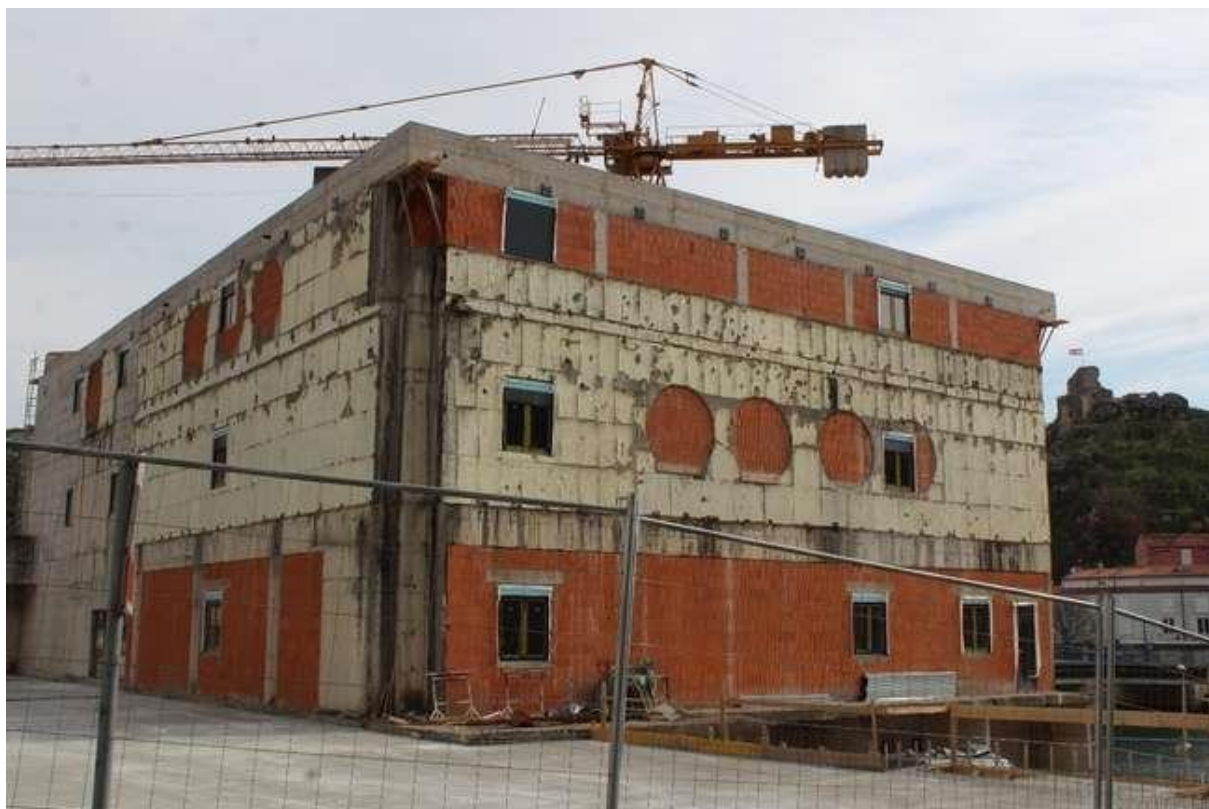
Slika 5: Stara robna kuća