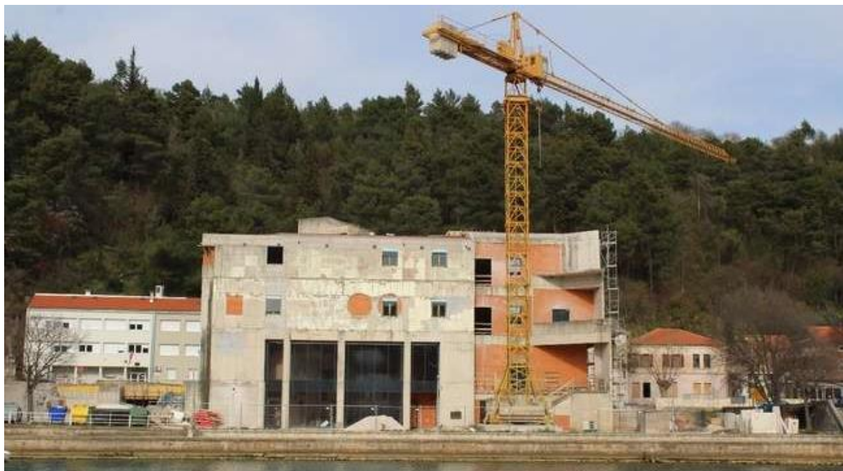
Slika 6: Preuređenje stare robne kuće