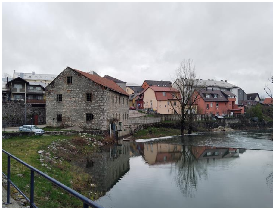
Slika 4. Pogled na mlin i mlinsku branu

Gospić se u doba kratkotrajne francuske vladavine već oblikovao oko rijeke Novčice koja se na istoku ulijeva u rijeku Liku. Uz glavne prometnice – Dalmatinsku, Karlobašku i Karlovačku cestu vezale su se nove ulice koje su podijelile naselje na četvrti. Najstarija od njih, uz kulu age Senkovića, jednu od prvih građevina u Gospiću, obuhvaćala je građevine vojne namjene i gospodarske objekte. Ovoj četvrti pripadao je i Murkovićeve mlin.