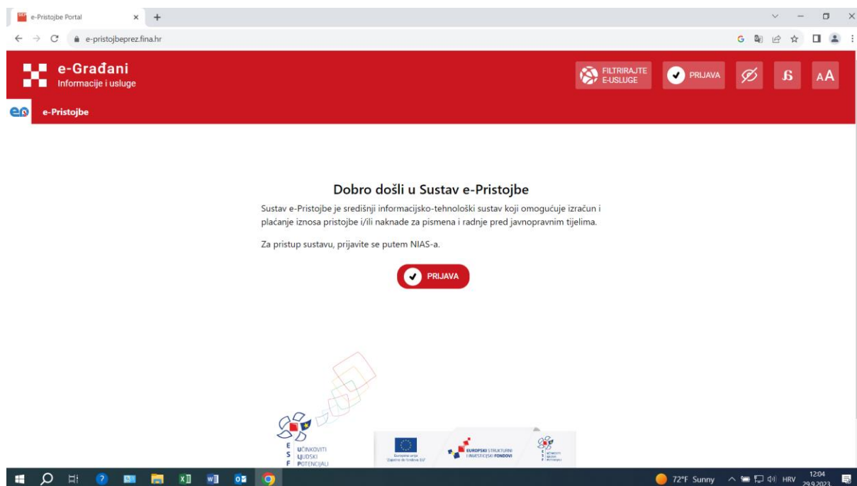
Slika 2. Sustav e-Pristojbe

Na slici 2. je prikazan početni zaslon aplikacije e-Pristojbe.