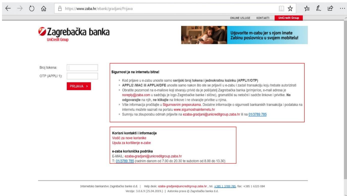
Slika 1: Početna stranica internet bankarstva Zagrebačke banke.