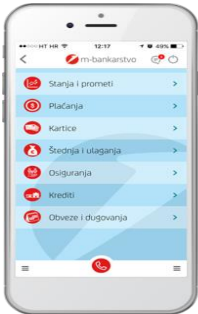
Slika 3: Početni ekran m-zaba, mobilnog bankarstva Zagrebačke banke

Nakon autorizacije putem PIN broja javlja se izbornik na kojem se izabire usluga koju klijent želi obaviti.