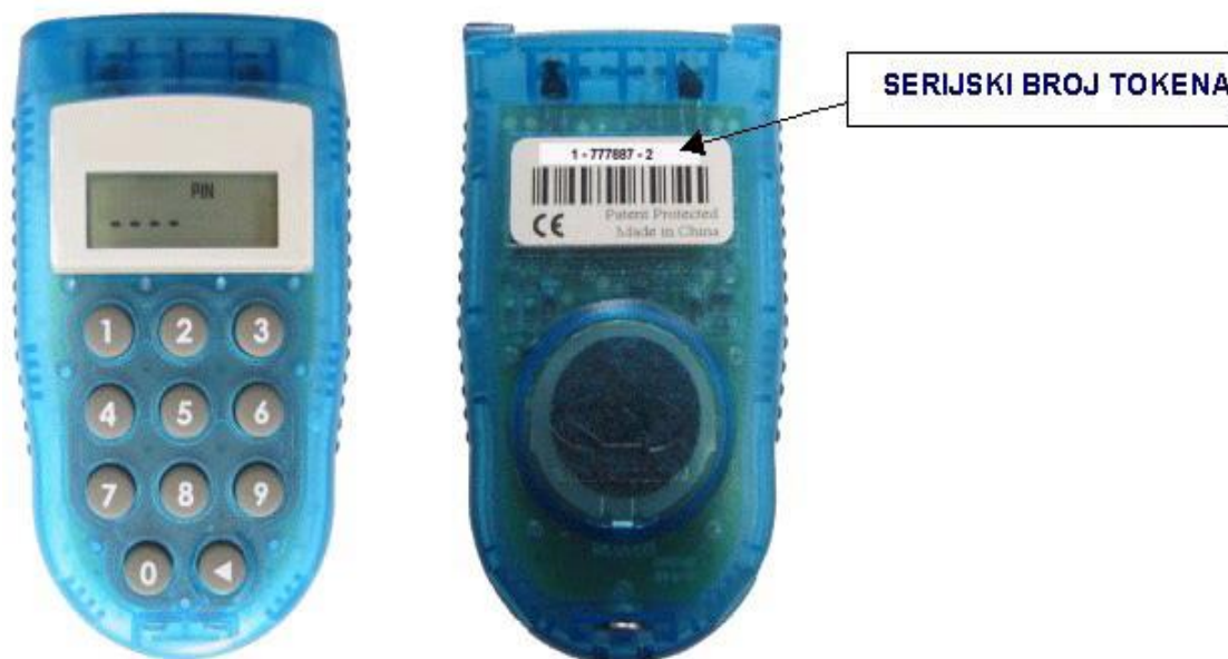
Slika 4: Izgled tokena i serijskog broja