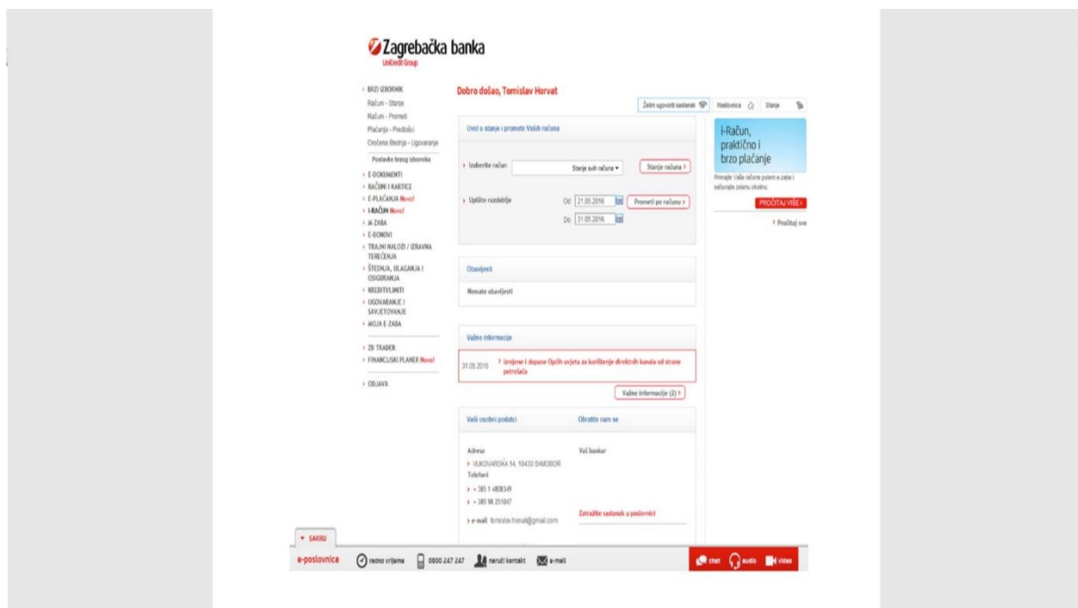
Slika 2: Izgled korisnikove početne stranice e-zaba