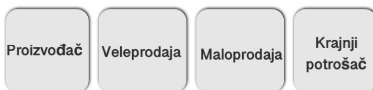
Slika 1. Ilustracija – krug subjekata u marketing trgovini

Trgovina je gospodarska djelatnost u kojoj pojedinci i tvrtke, odnosno fizičke i pravne osobe, posreduju između proizvodnje i potrošnje kao kupci i prodavatelji dobara i usluga te organizatori tržišta. Kao posebna djelatnost trgovina omogućuje najbržu i najuspješniju povezanost proizvođača i potrošača. Unutarnja se trgovina obavlja unutar granica jedne države, dok se vanjska trgovina obavlja između subjekata koji su rezidenti različitih država. 1