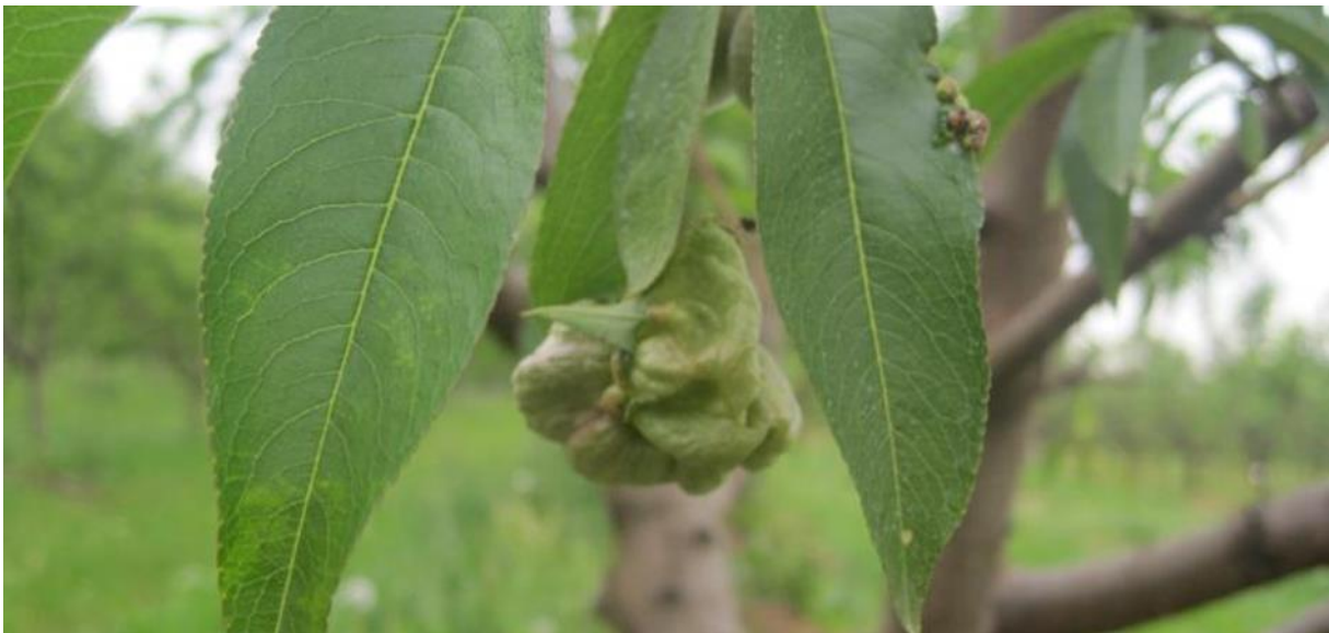
Slika 9. List breskve zaražen fitopatogenom gljivom Taphrina deformans [ web 16 ]

Nekoliko je načina zaštite od ovog patogena. Ako se radi o manjoj površini inficiranoj ovim patogenom, infekciju je moguće smanjiti kidanjem inficiranih listova te rezidbom zaraženih izbojaka. Također je infekciju moguće smanjiti tretiranjem breskve različitim fungicidima.