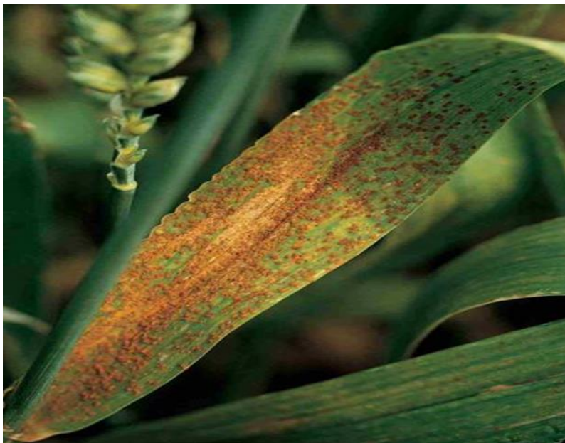
Slika 10. Pšenica zaražena fitopatogenom gljivom Puccinia recondita (bolest poznata kao „smeđa hrđa“) [ web 17 ]

Smeđa hrđa pšenice bolest je koju uzrokuje fitopatogena gljiva Puccinia recondita . Redovito dolazi sa pšeničnim usjevom, a napada zelene listove pšenice, jer jedino na takvom listu ovaj patogen može opstati. Optimalne temperature za klijanje spora ove fitopatogene gljive su od 15°C do 20°C, te treba vioku vlažnost zraka. Bolest se suzbija preventivno, prije same pojave simptoma, ili pri pojavi prvih simptoma bolesti. Pri tretiranju se koriste fungicidi na bazi strobilurina ili triazola [ web 17 ].