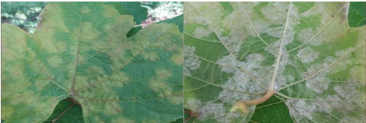
Slika 7. List vinove loze zahvaćen plamenjačom [ web 14 ]

Postoji nekoliko načina zaštite od infekcije. Prije svega, kod sadnje vinograda bilo bi dobro izabrati one vrste koje su otpornije na ovaj patogen. Osim toga redovito uklanjanje zaraženih listova, vitica, cvjetova i ostaloga smanjuje mogućnost širenja bolesti. I naravno redovito tretiranje fungicidima. [ Web 14 ]