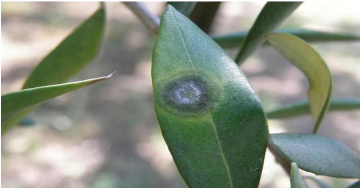
Slika 12. List masline zaražen bolešću paunovo oko [ web 19 ]

Najčešća bolest maslina u Hrvatskoj je pojava „paunovog oka“, bolesti koju izaziva gljivica Spilocaea oleagina [ 4 ]. Na bolest „paunovog oka“ najviše u osjetljiva stabla koja žive u uvjetima sjene i visoke vlage. Simptomi bolesti pojavljuju se uglavnom na gornjoj strani listova, gdje se pojavljuju kruglaste pjega ili mrlje, veličine 10 do 12 mm, a vremenom se oko pjega formira žuto-zeleni prsten, dok centralni dio posmeđi, odakle i dolazi naziv „paunovo oko“. Pjege obično pokriju cijeli list, što vremenom dovodi do otpadanja listova. Ostali organi biljke rjeđe su podložni zarazi ovom bolesti, a ukoliko dođe do nje, tada je ona prepoznatljiva po smeđim pjegicama. Suzbijanje ove zaraze provodi se dva puta godišnje, s obzirom na vrijeme početka infekcije, kod nas još pomoću fungicida na bazi bakra, dok se u ostalim zemljama EU rabe se fungicidi na organskoj bazi. Bakar iz fungicida, osim što suzbija spomenutu bolest, povoljno djeluje i na rak masline. [ web 18 ]