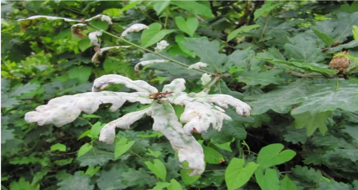
Slika.3. List hrasta zaražen fitopatogenom gljivom Erysiphe alphitoides [ web 9 ]

Najveću štetu ova gljiva čini sadnicama hrasta, dok starija stabla puno lakše podnose prisutnost ovog patogena. Međutim, ukoliko je prisutnost patogena u kombinaciji sa nekim drugim štetnim čimbenikom, kao što je naježda insekata koji se hrane lišćem, tada to može dovesti propadanja hrasta [ web 9 ].