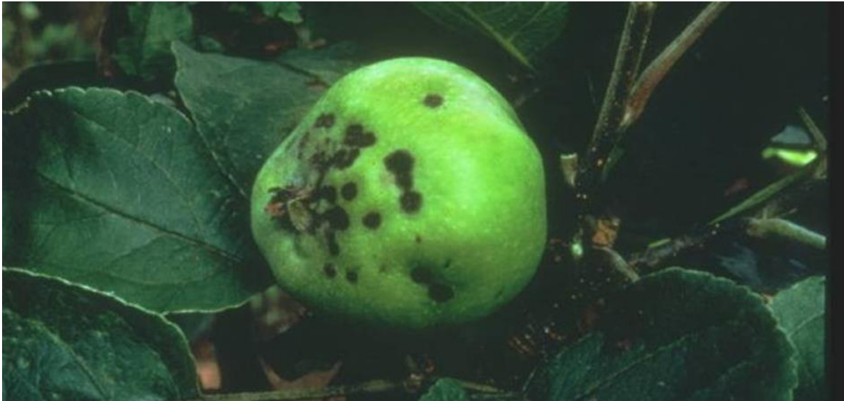
Slika 8. Plod jabuke zaražen fitopatogenom gljivom Venturia inaequalis [ web 15 ]

vrijeme cvatnje koriste se strobilurinimi. Što su plodovi jabuke stariji, to su otporniji na pojavu bolesti, stoga je vrlo važno reagirati pri pojavi prvih simptoma na mladim listovima. [Web 15 ]