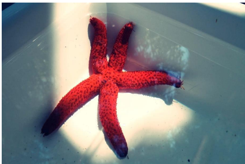
Slika 4. Echinaster sepositus L. – crvena zvjezdača (fotografija iz privatne zbirke; terenska nastava; Rovinj, 2016.)

Regeneracija kraka zvjezdače pod kontrolom je središnjeg živčanog sustava. Na modelu vrste Asterina gibosa L. u laboratorijskim uvjetima dokazano je da ukoliko se ukloni radijalni živac regeneracija nije moguća. Tijekom regeneracije potreban je živčani sustav u cjelini. Morfolaktički procesi kod zvjezdača prilično su spori u odnosu na epimorfne procese stapkobodljikaša i zmijača. Posebice početna faza popravka može trajati tjedan ili više ovisno o temperaturi mora i vrsti zvjezdače. Aktivnost staničnog ciklusa je prilično niska u početnoj fazi.