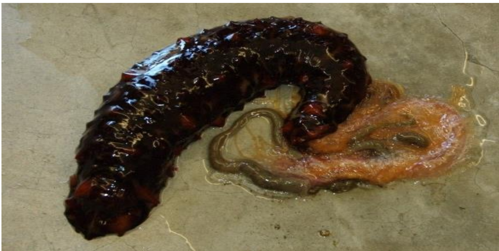
Slika 3. Evisceracija crijeva i vodenih pluća kalifornijskog trpa Parastichopus californicus L. (Web 3)

Ukoliko trpovi dožive stres podliježu procesu evisceracije. Evisceracija je proces prilikom kojega dolazi do raskidanja prednjeg ili stražnjeg dijela tijela kroz koji se izbacuje čitavo probavilo. Tijekom procesa evisceracije dolazi do prekida kontraktilnog vezivnog tkiva na točno određenom mjestu gdje se probavilo veže za stjenku tijela. Dolazi do kidanja vezivnog tkiva koje probavilo povezuje sa stjenkom tijela. Izbačeno probavilo se regenerira, a znanstvenici smatraju da se proces evisceracije događa i spontano u svrhu izbacivanja nakupljenih otpadnih tvari odnosno u svrhu čišćenja organizma. Nakon evisceracije takvo izbačeno probavilo služi za zavaravanje predatora dok trp dobije na vremenu za bijeg (Garcia-Ararras i Greenberg, 2001). Ova pojava tipičan je epimorfni proces u kojemu se formira blastemu slična struktura kao što je zadebljanje srednjeg ruba lamele (Candia Carnevali, 2006). U sljedećim fazama ponovni rast probavila može podrazumijevati dva alternativna mehanizma staničnog grupiranja. Jedan je mehanizam od ostataka jednjaka i kloake, preko morfolaktičkih mehanizama tkiva migracijom i proliferacijom endodermalno izvedenih stanica. Drugi mehanizam od celomskog epitela, izravnom migracijom i proliferacijom novih mezodermalno izvedenih progenitorskih stanica; mehanizam se javlja u situaciji kada se endodermalno izvedena tkiva potpuno izgube evisceracijom.